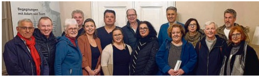
Erfahrungsaustausch der Integrations-Kommissionen im Landkreis Hersfeld-Rotenburg in Imshausen.

In vielen Dingen waren sich die drei Kommissionen einig, eine intensivere Öffentlichkeitsarbeit soll betrieben werden. Orte und Räume der Begegnung sollen geschaffen werden, die Teilnahme oder Ausrichtung von Veranstaltungen soll Menschen mit unterschiedlichsten kulturellen Hintergründen zusam-