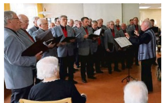
Der Männergesangsverein Breitenbach präsentierte sich jüngst im Altenwohnheim der AWO Bebra.