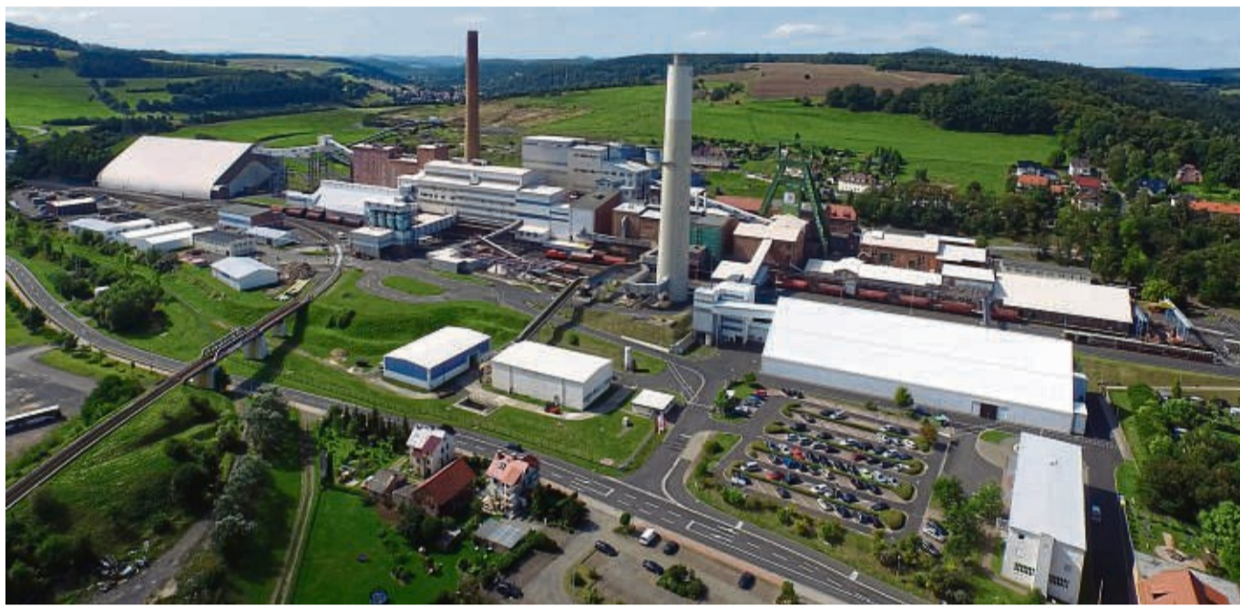
Soll sich auf die Granulierung von Düngesalzen konzentrieren: Am thüringischen K+S-Standort wird ab 2027 kein Rohsalz mehr an die Erdoberfläche gebracht. Dafür soll die Fabrik 20 Jahre länger als geplant in Betrieb sein.