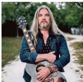
Musik aus dem Herzen Amerikas: Israel Nash ist ein prominenter Vertreter des Americana Roots-Rocks.