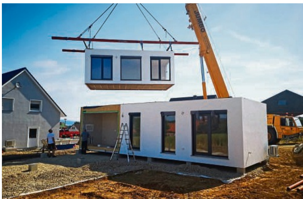
Mit der Modulbauweise kann man auch mehrstöckig bauen. Das spart Bauplatz.

Verschiedene Hersteller bieten diese neuartige Form des Hausbaus an, die sich jenseits konventioneller Fertig- und Massivhäuser bewegt. Durch ein Baukastenprinzip ergibt sich ein hohes Maß an Individualisierung: Die Einzelmodule in etablierter Holzständerbauweise können bis zu 50 Quadratmeter groß sein und bilden die Basis des Hauskonzepts. Je nach gewünschter Wohnfläche und Präferenz können die einzelnen Hausmodule flexibel