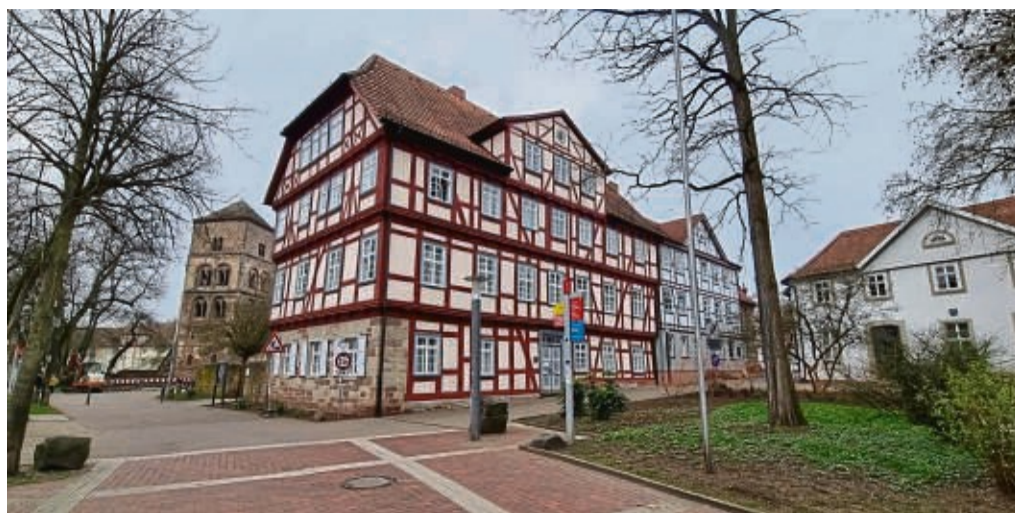
Am Eingang zum Stiftsbezirk in Bad Hersfeld: In dem alten Fachwerkhaus Im Stift 9 ist das Studienseminar untergebracht.