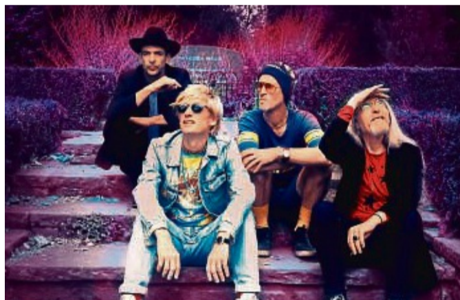
Die erste Brit Pop Band in der bunten Geschichte des Festivals: Kula Shaker.