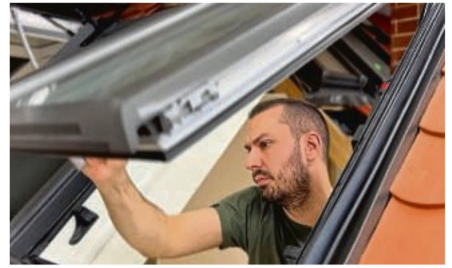
Eine regelmäßige Wartung und gelegentliche Reparatur einzelner Teile schafft bei in die Jahre gekommenen Dachfenstern kostengünstig und ressourcenschonend Abhilfe.

Auch eine Außenmarkise helfe, die warme Luft im Wohnraum zu halten und die Kälte auszusperren: „Sie hat zudem den Vorteil, dass sie in geschlossenem Zustand den Raum nicht komplett verdunkelt.“