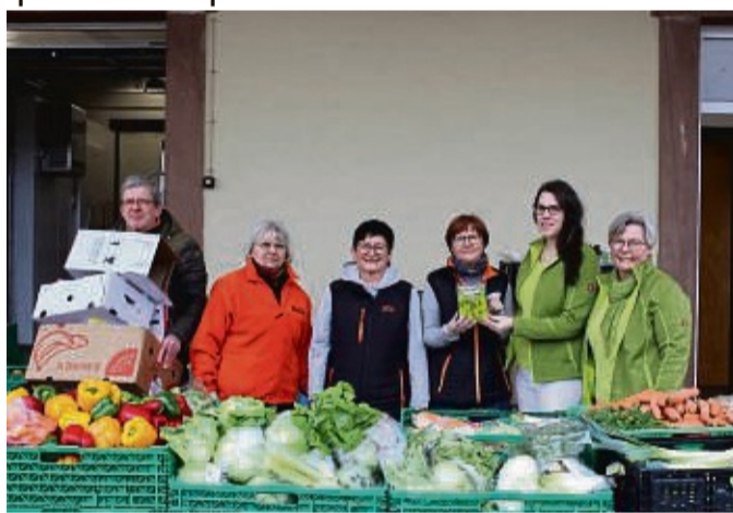
Christians Apotheken Niederaula spendet für die Tafel Bad Hersfeld.