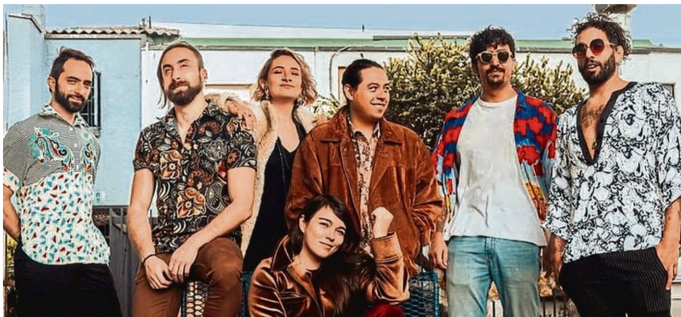
La Sonora Mazurén aus Bogota präsentieren „Psych Tropical“, eine neue (Tanz-)Bewegung aus Südamerika.