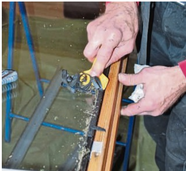
Defekte Teile des Dachfensters können ganz einfach ausgetauscht werden. So muss man selbst bei einem defekten Fenster nicht gleich ein neues einbauen.

„Das ist aber nur ein Problem, wenn man nichts unternimmt“, erklären Experten. Dienstleister der Regi-