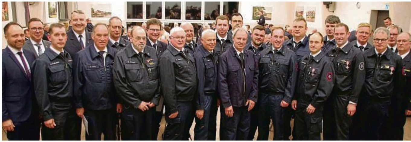
Treue und verdiente Feuerwehrkameraden ehrte das Land Hessen mit Brandschutzehrenzeichen und Anerkennungsprämien in der Jahreshauptversammlung der Feuerwehren der Stadt Rotenburg, hier zusammen mit den Vertretern der Feuerwehren und Gästen.

Zur neuen Ausstattung gehörten nun Tauchpumpen, ein mobiler Hochwassererschütz, D-Schlauch-Material und Löschrucksäcke. Mobile Anhänger als Stromerzeugung für einen Stromausfall