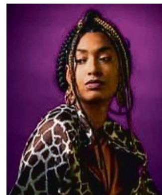
La Nefera, Schweizer Rapperin, tritt auf dem Hippie-Festival auf.