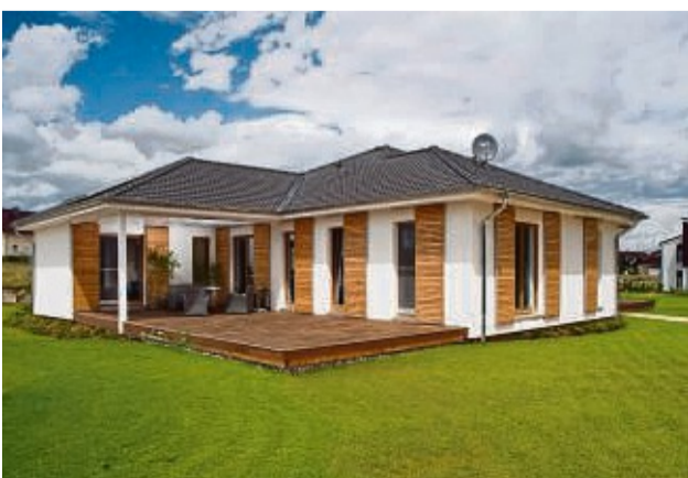
Durch die modulare Bauweise sind ganz individuelle Hausgrundrisse möglich.

Die Fertigung eines Modulhauses erfolgt innerhalb weniger Wochen in einer wettergeschützten Produktionshalle. Dadurch profitieren Bauherren von einem reibungslosen Bau ohne herkömmliche Baustelle. Ungeplante Komplikationen und monatelange Verzögerungen bleiben ihnen somit erspart. Nur wenige Stunden nach der Aufstellung auf dem Grundstück sind die vorgefertigten modularen Häuser bezugsbereit. Bei Bedarf können Module auch Jahre später flexibel erweitert und zurückgebaut werden oder reisen bei einem Umzug komplett mit.