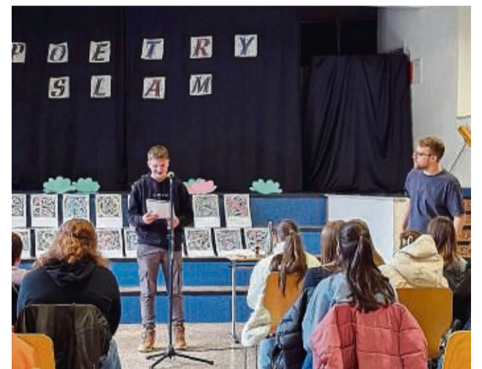
Poetry-Slam Workshop in der Gesamtschule Niederaula.