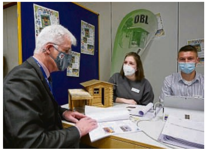
Ostermesse 2022: Landrat Torsten Warnecke ließ sich von den Auszubildenden erklären, was die Obersberger Landhaus GmbH zu bieten hat.