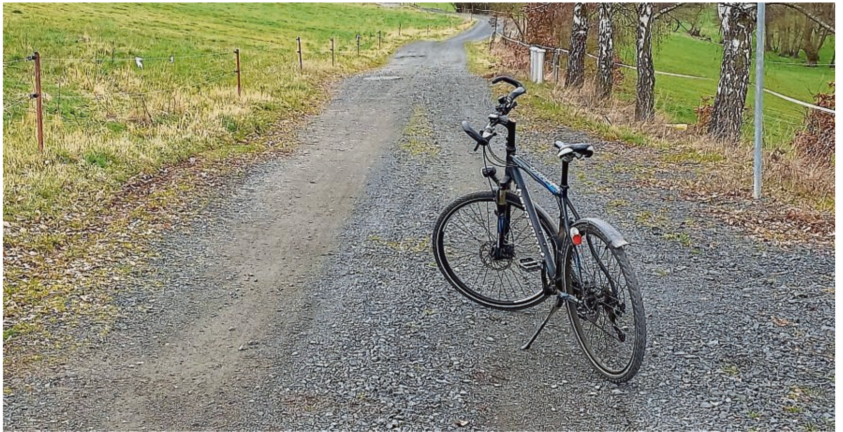
Aktuelles Problemstück: Die schlechte Fahrbahndecke zwischen Völkershausen und Luttershof mindert den Fahrspaß auf dem neuen Oechsetal-Radweg von Vacha nach Masbach.