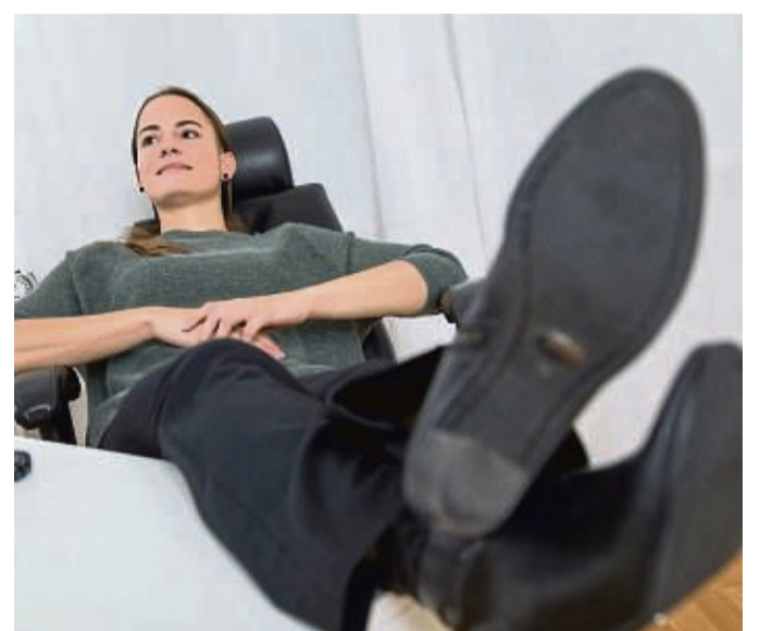
Spontane Pausen bewusst zur Erholung zu nutzen, ist clever – das steigert die Produktion.