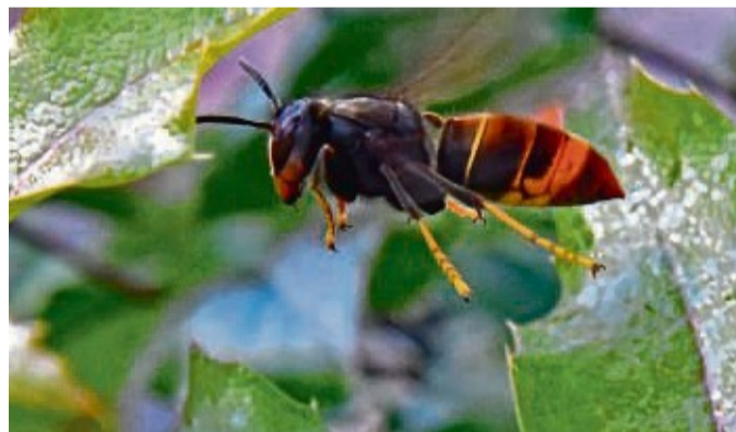
Die Asiatische Hornisse breitet sich weiter in Hessen aus.

„Zur Versorgung ihrer Larven jagt und erbeutet die Asiatische Hornisse zahlreiche Insekten, bevorzugt Honigbienen. Diese werden daran gehindert, Pollen und Nektar zu sammeln, können das Bienenvolk dann nicht ernähren und keine Pflanzen bestäuben“, heißt es in einer Pressemitteilung des Landesbetriebs Landwirtschaft Hessen.