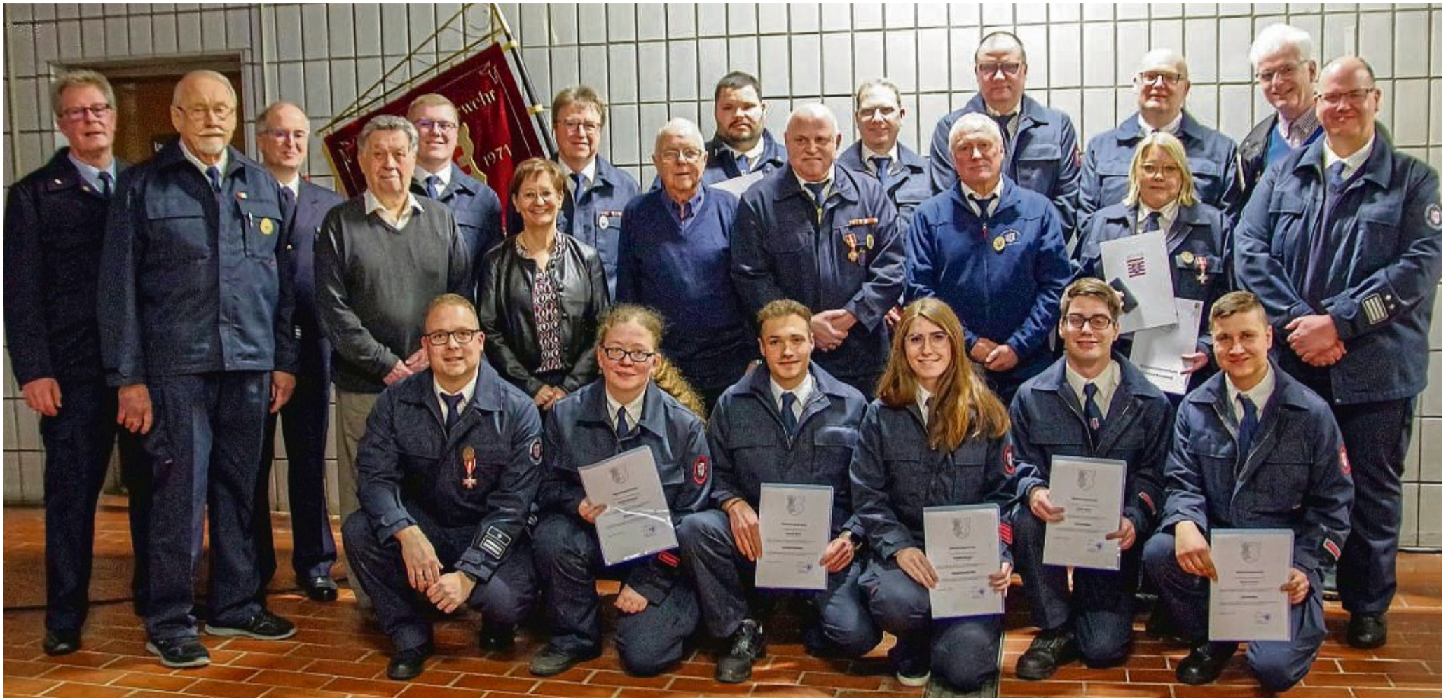
Ausgezeichnet: Ehrungen, Beförderungen bei der Feuerwehr Bad Hersfeld-Kernstadt.