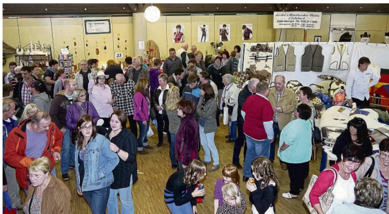
Ein Bild aus besseren Tagen: Die von der Heringer Werbegemeinschaft organisierten Gewerbeausstellungen lockten zahlreiche Besucher ins Bürgerhaus.