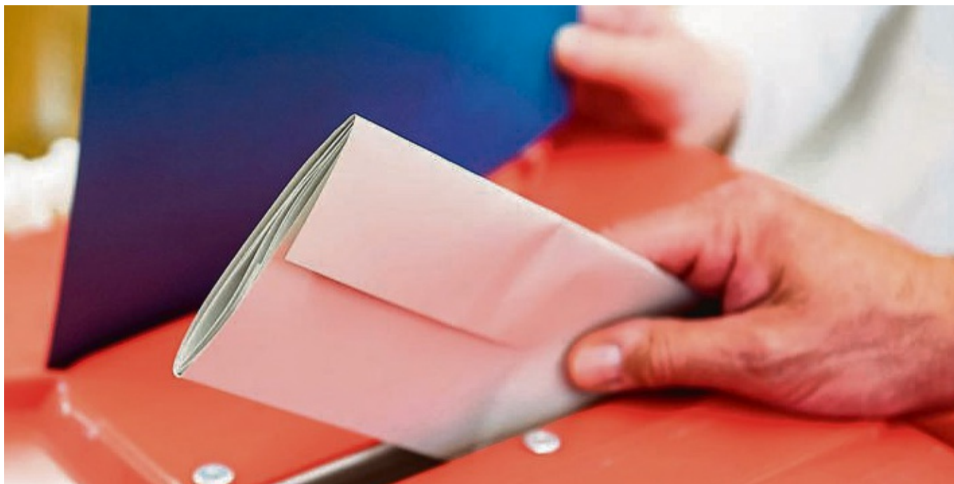
Die Europawahl findet am 9. Juni statt.