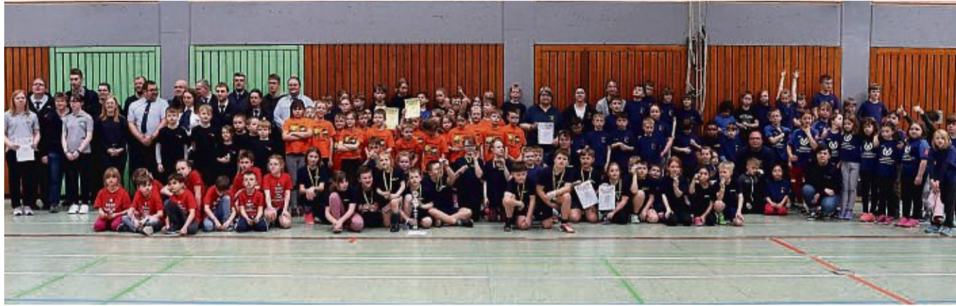
Quitschieturnier der Kreisjugendfeuerwehr für die Kinderfeuerwehren.