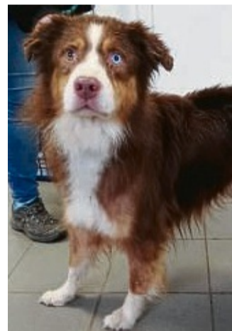
Abgemagert: Dieser Australian Shepherd hat lange Zeit zu wenig Futter bekommen.

Nach Informationen der Hersfelder Zeitung handelt es sich bei den Tierhaltern um ein Ehepaar mittleren Alters, das mit seinen zwei Kindern zurückgezogen in einem Mietshaus am Ortsrand gelebt hat. Aufmerksam wurden die Behörden zunächst durch Beschwerden über Ruhestörung durch Hundege-