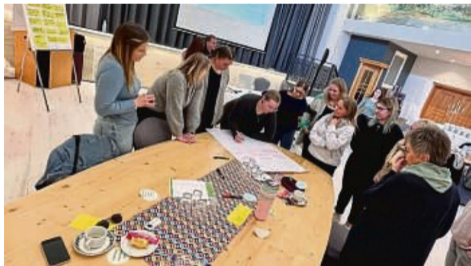
Erster gemeinsamer Fachtag der pädagogischen Fachkräfte der vier städtischen Kindertagesstätten in Bebra.