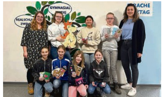
Tolle Spendenaktion der Geistalschule für die Kleinen Helden.