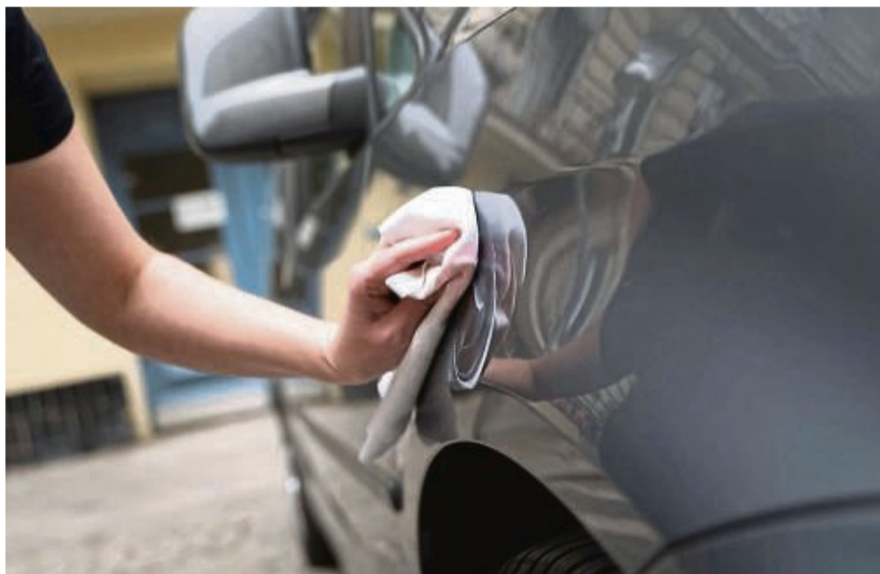
Wer dem Auto etwas Gutes tun will, befreit es sorgsam vom Winterschmutz und lässt ihm ein paar Pflegemaßnahmen angeeiden.

Innen wird's ungemütlich. Wer saugt schon gern in hintersten Ritzen, wischt penibel die Innenscheiben und entstaubt das Cockpit. Macht wenig Spaß, sorgt aber für Wohlgefühl und klare Sicht. Der Lack glänzt,