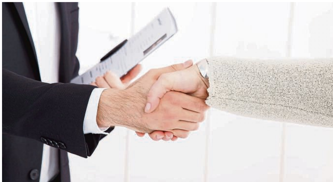
Höflich, selbstbewusst, gepflegt und zugewandt: Diese Eigenschaften sollten Bewerber mindestens mitbringen, um den berühmten ersten Eindruck für sich zu gewinnen.

Oft ist der erste persönliche Eindruck entscheidend. Sie sollten beim ersten Kennenlernen nicht zu sehr vortreten, aber trotzdem