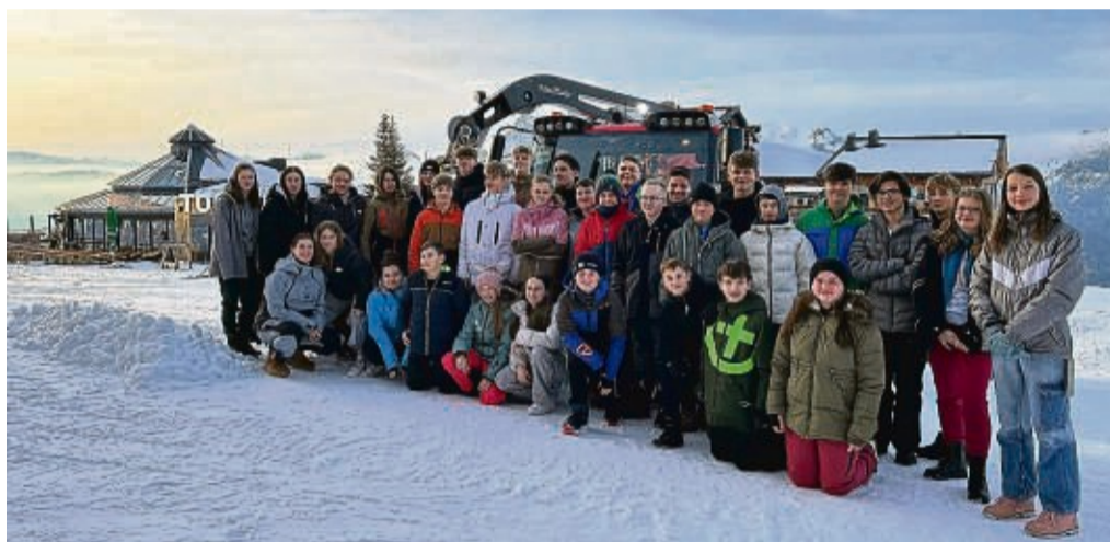
Bei der Skiwoche der Gesamtschule Geistal mit Schülerinnen und Schülern der Jahrgänge 7, 9 und 10.

Die Kreisjugendfeuerwehr bedankt sich bei dem Förderverein der Jugendfeuerwehren der Gemeinde Nentershausen für die hervorragende Ausrichtung des Wettbewerbs und der vielfältigen Verpflegung. Ein großer Dank gilt auch dem DRK Obersuhl für die Übernahme des Sanitätsdienstes bei dieser Veranstaltung. red/ah