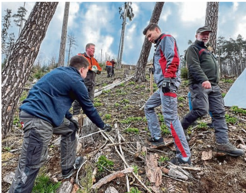
Auszubildende engagieren sich für die Natur: 500 Douglasien wurden im Gebiet Falkenbach gepflanzt.

Auch spezielle Fragen zur Pflanzaktion, wie der Abstand zwischen den Bäumen, die Wachstumsgeschwindigkeit und der Schädlingsbefall in der Region, wurden beantwortet. Die Initiative dauerte insgesamt etwa drei Stunden und wurde von einem Imbiss bei schönem Wetter beglei-