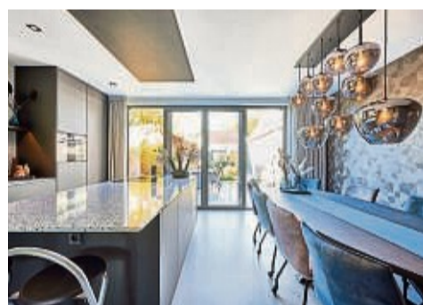
Die richtige Deckengestaltung für Ihre Küche

sind so vielseitig, dass du sie harmonisch jedem Wohnstil anpassen kannst. Wohn-, Schlaf- und Esszimmer sowie Küche, Flur und Bad erhalten damit schnell ein neues Gesicht. Montiert werden sie einfach unterhalb der vorhandenen Decke. Kein ausräumen nötig, lediglich die Möbel wer-