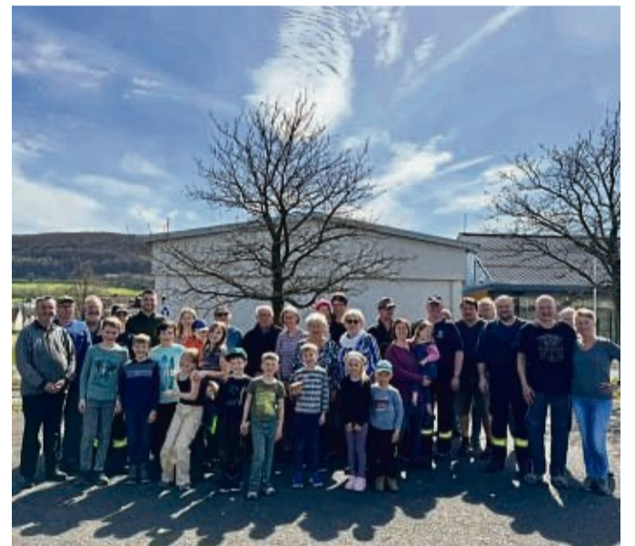
Fleißige Helfer: Der Ortsbeirat und weitere Einwohner von Friedewald haben achtlos in die Landschaft geworfenen Müll gesammelt.