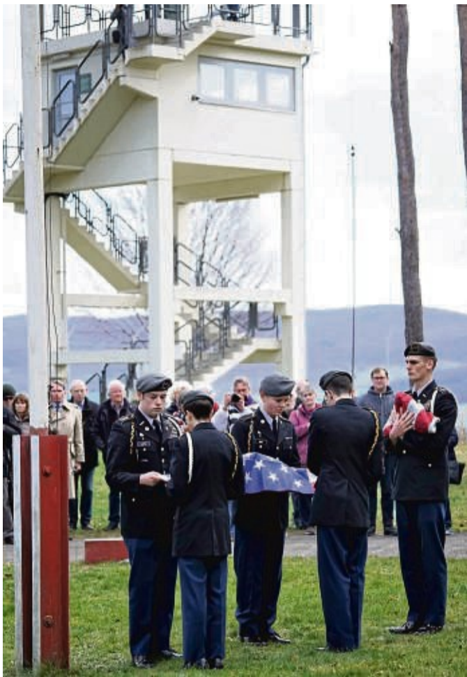
Am 19. April wird im US Camp von Point Alpha traditionell das Sternenbanner eingeholt und an die Point Alpha Stiftung übergeben.

„Wer heute 40 Jahre oder jünger ist, kann kaum einen eigenen Eindruck von den Ereignissen haben, auf die wir bei der Last Border Patrol zurückblicken. Deshalb sind Gedenkveranstaltungen wie diese so wichtig. Angesichts