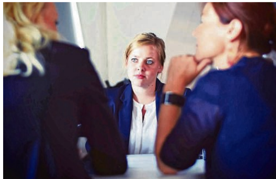
Keine einfache Situation: Bei einem Jobinterview stehen viele Bewerber unter Druck.

Wer diese Tipps befolgt und sich auf sich selbst und seine Stärken konzentriert, wird sicherlich nichts falsch machen. Viel Erfolg! mas