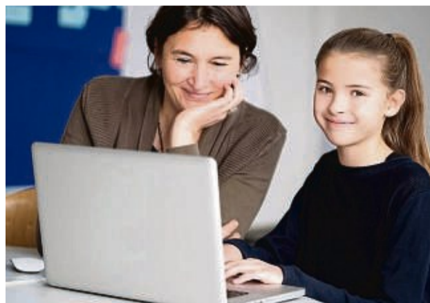
Man kann schon früh anfangen, sich über mögliche Berufe zu informieren. Dabei zählt erst mal alles, was Spaß macht.

Die Berufs- und Studienwahl erfolgt bei jungen Menschen im besten Fall also