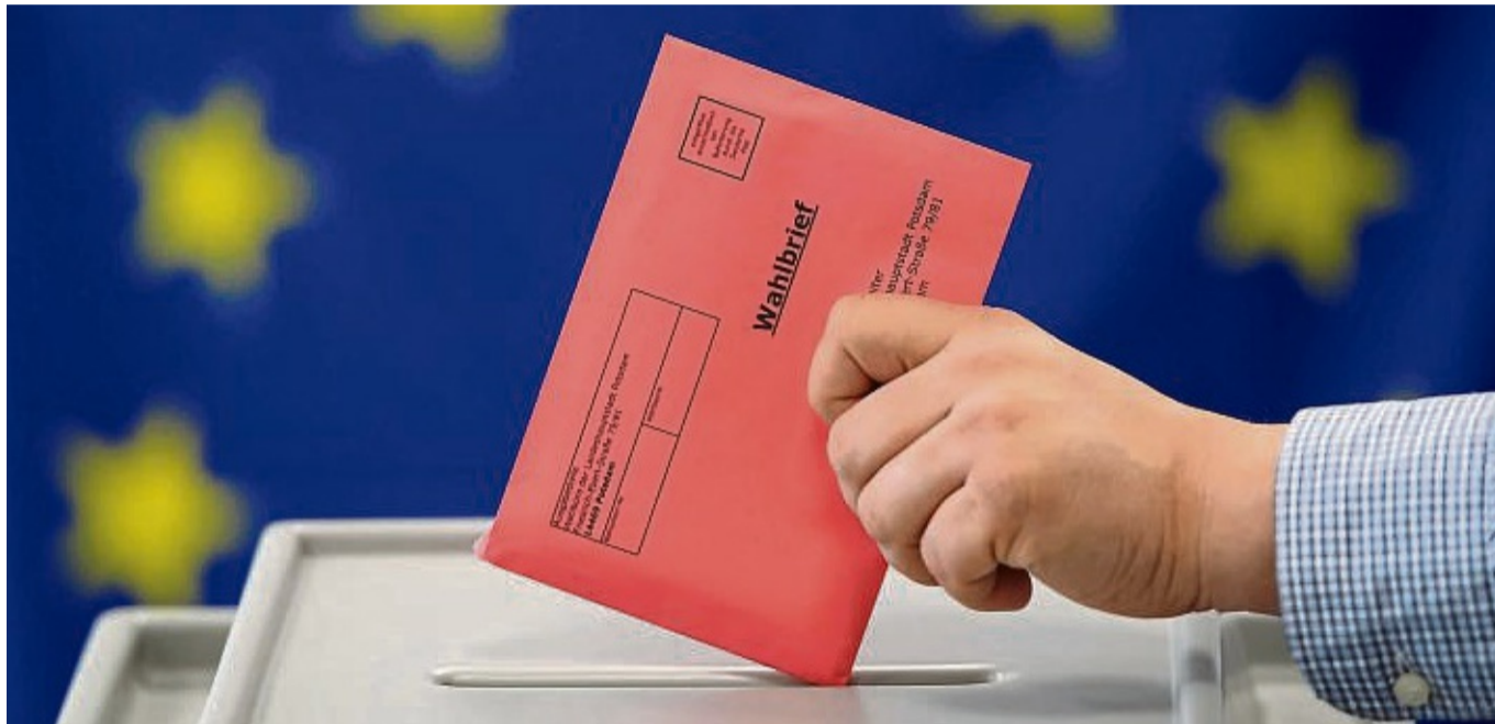
Die Europawahl findet in Deutschland am 9. Juni statt: Schon jetzt können Wahlberechtigte aber auch Briefwahlunterlagen beantragen.