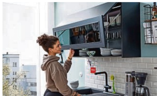
Hängeschränke vergrößern den verfügbaren Platz und können auch optisch ein Gewinn sein.

Die fängt mit der Küchenform an: „Eine Küchenzeile passt in jeden Raum“, wissen Experten. „Darin lässt sich alles, was man braucht, gut integrieren.“ Basics sind hier Kochfeld, Backofen, Kühlschrank und Spüle, dazu ausreichend Stauraum für Geschirr und Kochutensilien. Bei größeren Küchenformen – etwa der L- oder U-Form, einer zweizeiligen Küche oder einer mit Kochinsel – sollte auf das sogenannte „Arbeitsdreieck“ geachtet werden. „Damit ist eine geschickte Anordnung von Spüle, Herd und Kühlschrank gemeint, denn zwischen diesen Punkten bewegt man sich viel hin und her, sodass kurze Wege wichtig sind“, erklären die Fachleute. Auch ein Ess- und