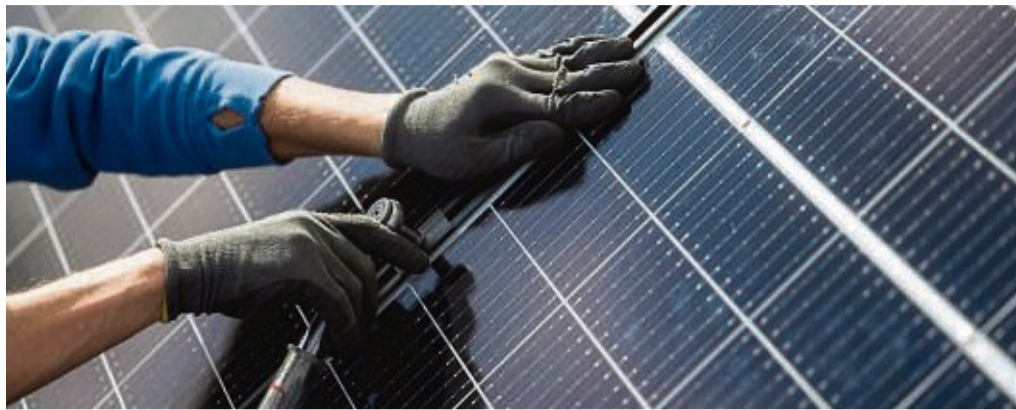
Eine durch Stürme zerstörte Photovoltaikanlage in Malsfeld hat die Energiegenossenschaft Hersfeld-Rotenburg jetzt wieder aufgebaut.

Hersfeld-Rotenburg – Über günstigen Strom freut sich die Firma „Reimer Logistics“ in Malsfeld, auf deren Dach die Waldhessische Energiegenossenschaft (WEG) eine größere Photovoltaikanlage wieder aufgebaut hat. Die Anlage war durch mehrere Stürme völlig zerstört worden und konnte seit 2021 keinen Strom mehr produzieren.