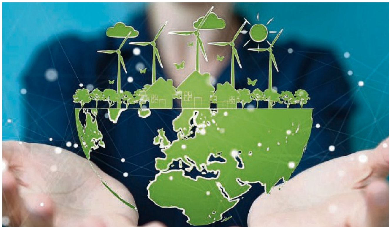
Nachhaltigkeit fängt schon vor der Schule an und betrifft alle Bereiche der Industrie.

Anmeldung jetzt unter www.sfe-osthessen.de oder telefonisch unter der Nummer 06621 / 76 28 2.