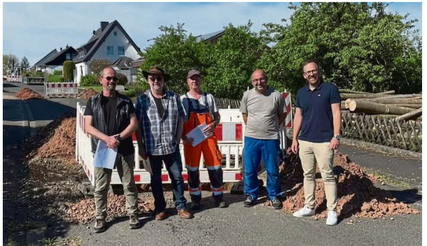
Ortstermin: Vertreter von Gemeinde, Baufirma und Ingenieurbüro auf der Baustelle im Schenklingfelder Ortsteil Wippershain.