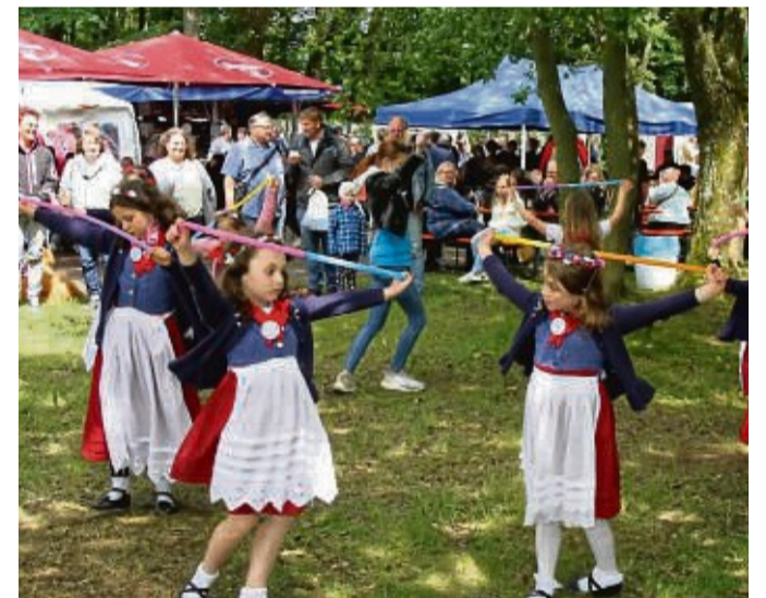
Die Volkstanzmäuse aus Oberaula erfreuten die Gäste mit ihrem Auftritt.