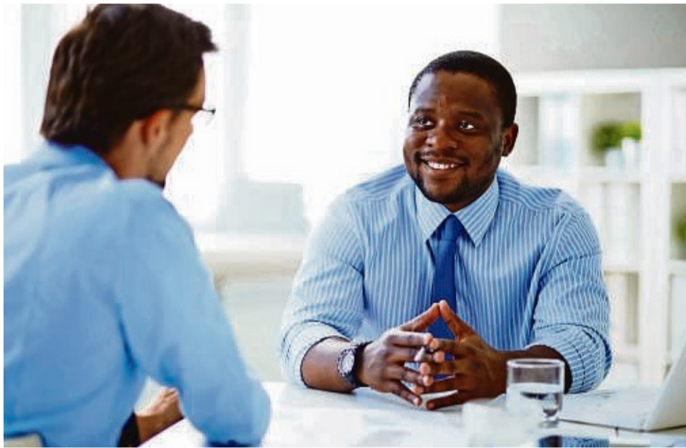
Längst ist nicht mehr nur das Gehalt entscheidend bei der Jobwahl. Viele „weiche“ Faktoren spielen auch eine Rolle.