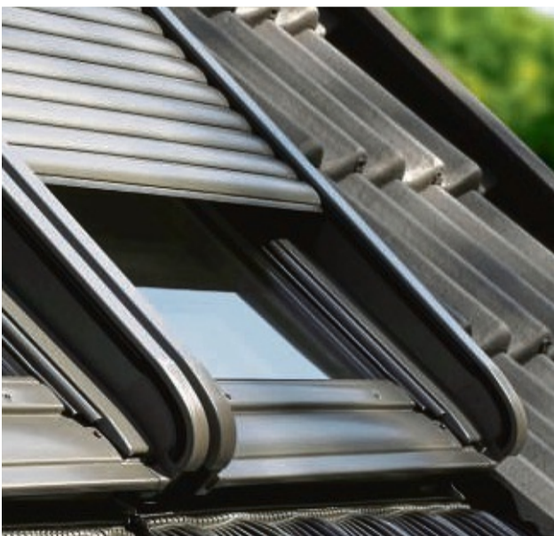
Damit erst gar keine Hitze in den Raum unterm Dach eindringt, ist ein außen liegender Schutz wie ein Rollladen oder eine Markise am besten geeignet.