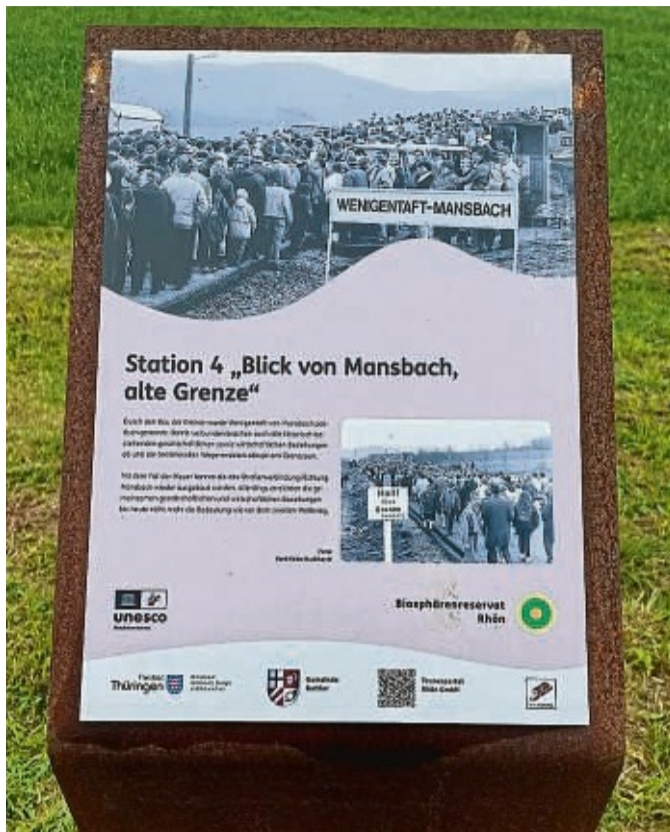
Neun Tafeln zur Geschichte: Station vier dokumentiert die Grenzöffnung zwischen Wenigentaft und Mansbach.