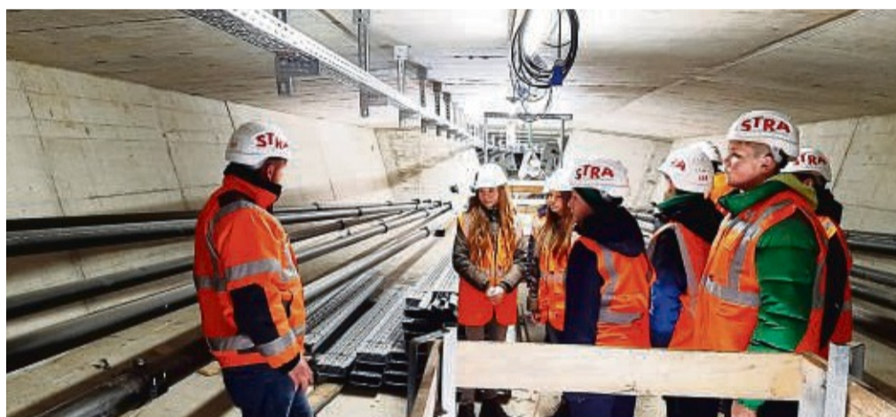
Die GSG-Brückenbauer besuchen einen Brückenbau der A49.

Die Schüler durften dann auf die Baustelle. Mit Helm, Sicherheitskleidung, Stahlkappenschuhen und Weste ausgestattet ging es erst mal über eine Gerüsttreppe auf etwa 18 Meter Höhe auf die Brückenseite, im Fachjargon Überbau genannt.