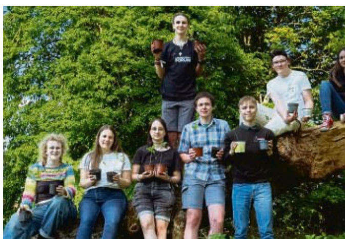
Das Landesjugendforum der Evangelischen Kirche von Kurhessen-Waldeck mit Setzlingen der Eiche.

Später sollen die Abkömmlinge der Friedenseiche in der ganzen Landeskirche verteilt und eingepflanzt werden, um dort weiter als Friedenssymbol dienen, heißt es in einer Mitteilung des Gremiums. red/kai