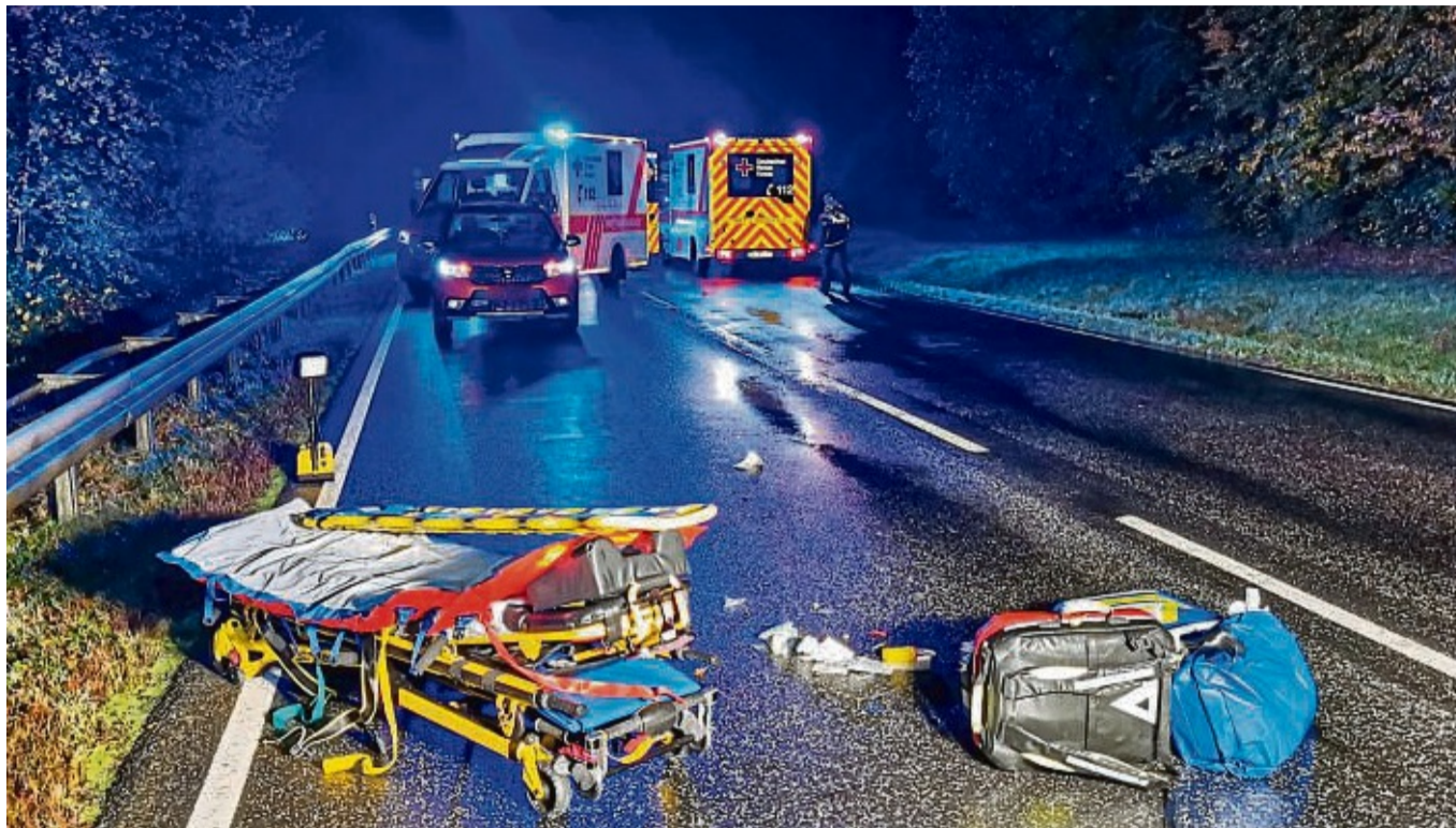
Frontalzusammenstoß: Bei einem schweren Verkehrsunfall, der sich am 24. Oktober 2023 auf der Bundesstraße 62 zwischen Sorga und Friedewald in Höhe der Einmündung Malkomes ereignete, wurden neun Menschen zum Teil schwer verletzt.

Die Verkehrsunfallzahlen mit Beteiligung junger Verkehrsteilnehmer zwischen 18 und 24 Jahren reduzierte sich gegenüber dem Vorjahr um 8,1 Prozent auf 466. Verstarben im Vorjahr noch zwei Personen an den Unfallfolgen, kam in 2023 erfreulicherweise kein Verkehrsteilnehmer in diesem Alter ums Leben. Die Anzahl der Verkehrsunfälle mit Schwerverletzten ist von 22 auf 5 und damit um 77,3 Prozent gesunken. Die Zahl der Leichtverletzten nahm ebenfalls stark ab und sank von 75 auf 54. In der Altersgruppe zwischen 65 und 74 Jahren ist insgesamt ein leichter Anstieg zu verzeichnen. Die Anzahl der Verkehrsunfälle erhöhte sich hier um 1,9 Pro-