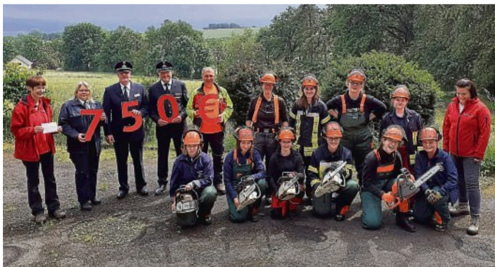
Fit an der Säge: Teilnehmerinnen, Ausbilder, Vorstandsmitglieder und Sponsoren beim Abschluss des zweiten Lehrgangs.