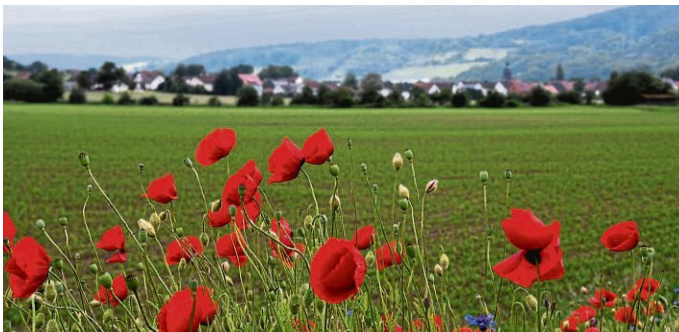
Den Pflanzen tut der viele Regen der vergangenen Wochen und Monate gut – wie auch dem Klatschmohn auf unserem Bild, das bei Mecklar entstanden ist.