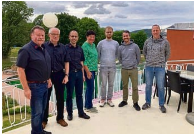
Neu gewähltes Vorstandsteam der IGBCE Heringen.