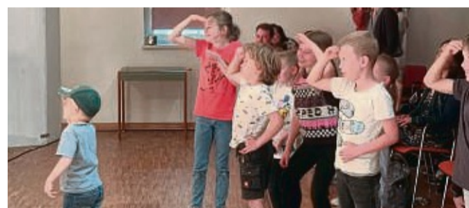
Die Kinder passen auf die Prinzessin auf und sind mit Freude dabei

der Bühne. Im Laufe der Aufführung wurde nach und nach das Geheimnis um Schloss DeMoMuSchoSchu gelüftet: Hinter dieser Wortschöpfung verbargen sich die Komponisten Debussy, Mozart, Mussorsky, Schostakowitsch und Schumann, die alle mit ihrer Musik einen Platz im Schloss gefunden hatten. Die Eltern und Kinder in der gut besuchten Gudetalhalle waren begeistert und bedankten sich mit lautem Applaus.