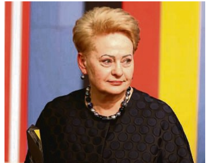
Die Preisträgerin des Point-Alpha-Preises 2024 Dr. Dalia Grybauskaitė.