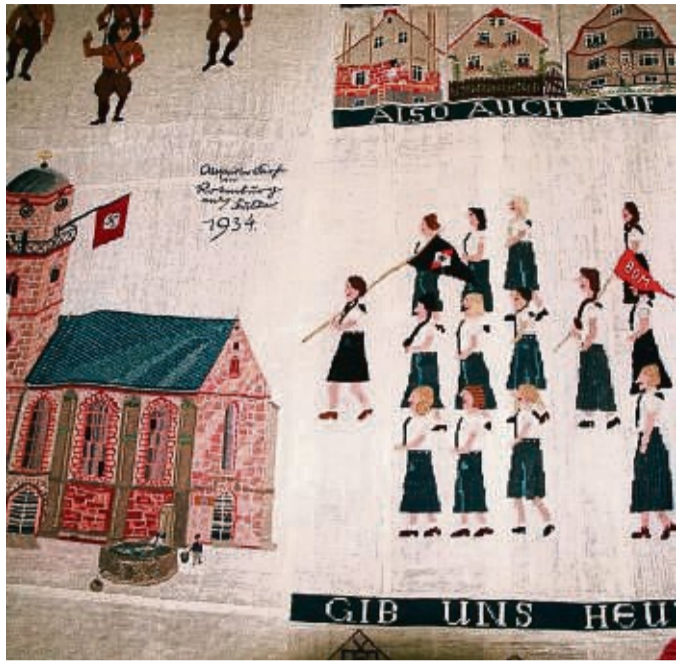
Ein Ausschnitt aus dem Kirchenteppich: Links die Jakobi-Kirche mit Hakenkreuz-Flagge und der damaligen deutschen schwarz-weiß-roten Fahne, rechts eine Gruppe vom Bund Deutscher Mädel.