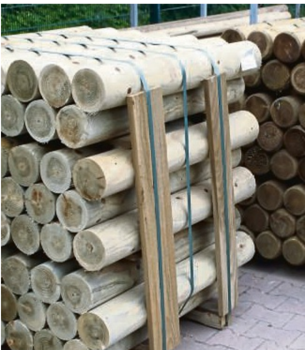
Als natürliches und nachhaltiges Baumaterial liegt Holz im Trend. Eine neue EU-Verordnung sorgt zukünftig für mehr Transparenz über die Herkunft.