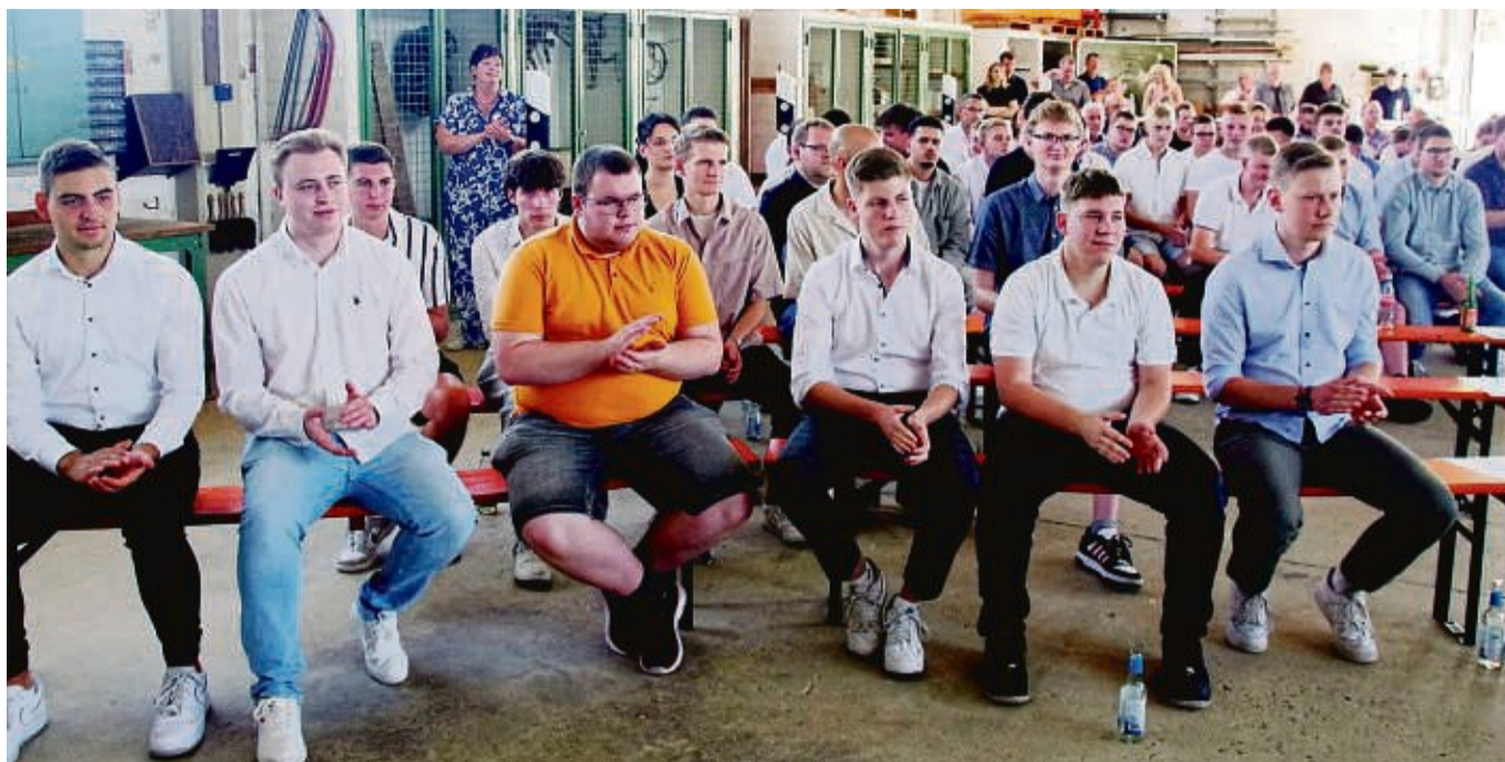
Freigesprochen wurden Auszubildende, die bei Hessen Mobil einen Handwerksberuf als Straßenwärterin oder Straßenwärter, als Fachkraft für Straßen- und Verkehrstechnik, Baustoffprüfer oder Fachinformatiker erlernt haben.