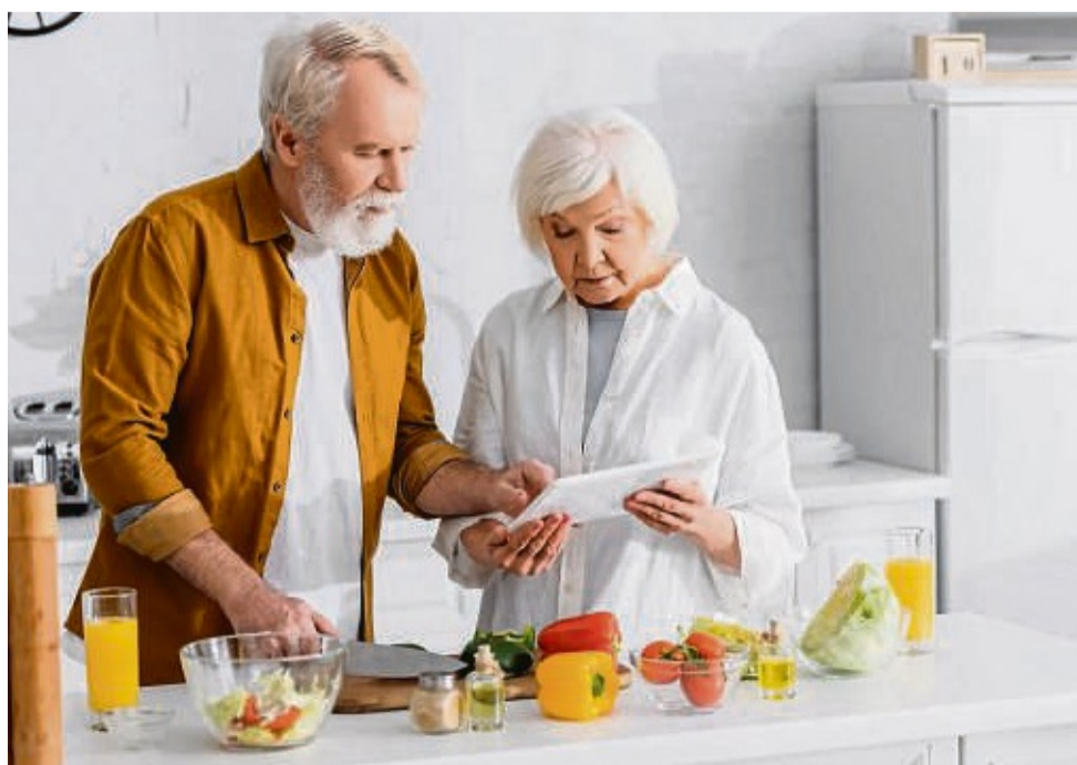
Die eigene Ernährung kann in jedem Alter hinterfragt und angepasst werden – für einen gesünderen Körper und mehr Leistung im Alltag.