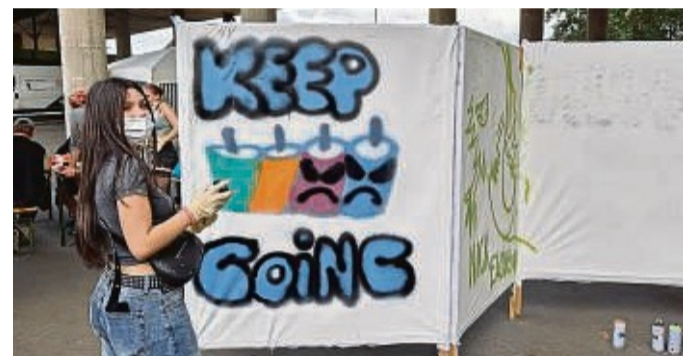
Bei der Arbeit: Mit viel Spaß waren die jungen Künstlerinnen und Künstler mit den Farbdosen kreativ.

Auf einer separaten Demokratie-Wand wurden Statements dazu gesammelt, was für jede und jeden persönlich Demokratie bedeutet. Am Ende des Tages waren alle vorbereiteten Leinwände besprüht und auch in der Unterführung gibt es jetzt wieder neue Graffitis zu bewundern.