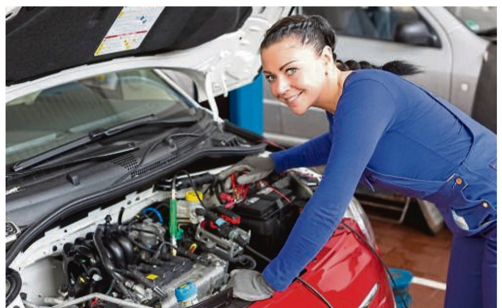
Ein Werkstattcheck vor einer langen Autoreise kann die Pannengefahr senken, was die Urlaubsfreude unnötig trüben würde.

Neben der technischen Verlässlichkeit kommt es auf langen Touren im voll besetzten Auto auch auf den Komfort an. Die Klimaanlage zum Beispiel ist an sonnigen Tagen besonders gefordert, um den Innenraum herabzukühlen. „Für saubere und gesunde Luft sollte bei jedem Innenraumfilterwechsel gleichzeitig eine Klimawartung mitgemacht werden. Min-