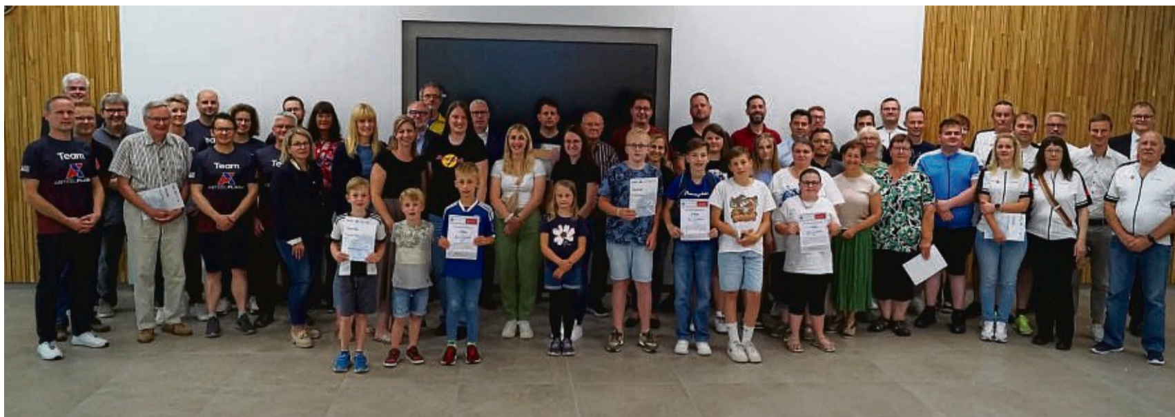
Zahlreiche Radler erschienen am Montag zur Siegerehrung im Schul- und Stadtradeln, nahmen Urkunden und die eine oder andere Stracke entgegen.