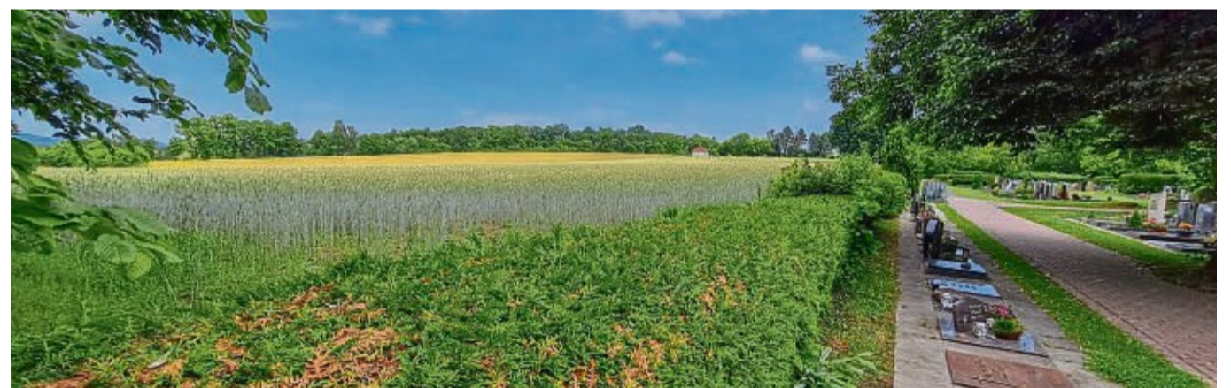
Auf mehreren Flächen am Friedhof in Bebra können die Stadtwerke und Energieversorger EAM nun Photovoltaik-Freiflächenanlagen planen.