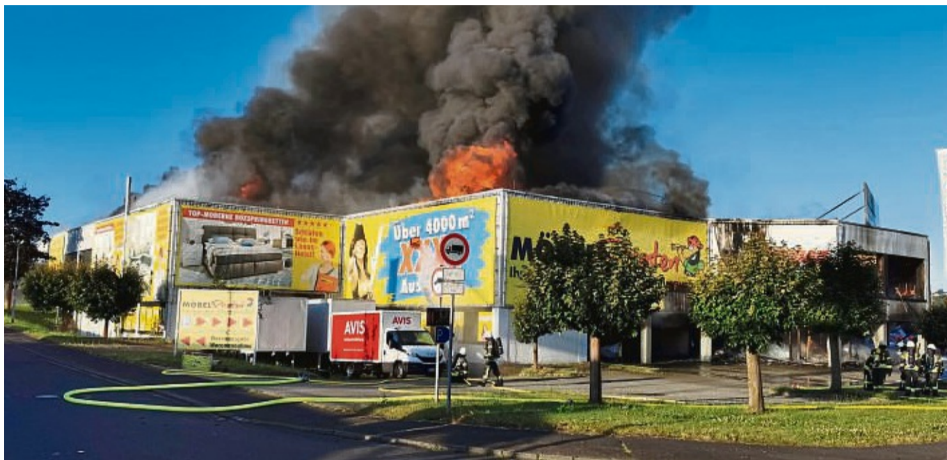
Großbrand in Möbelmarkt: Ein Feuer zerstörte den Discounter im Bad Hersfelder Stadtteil Hohe Luft. Es ist bereits der zweite Großbrand eines Möbelmarkts in Bad Hersfeld in diesem Jahr.