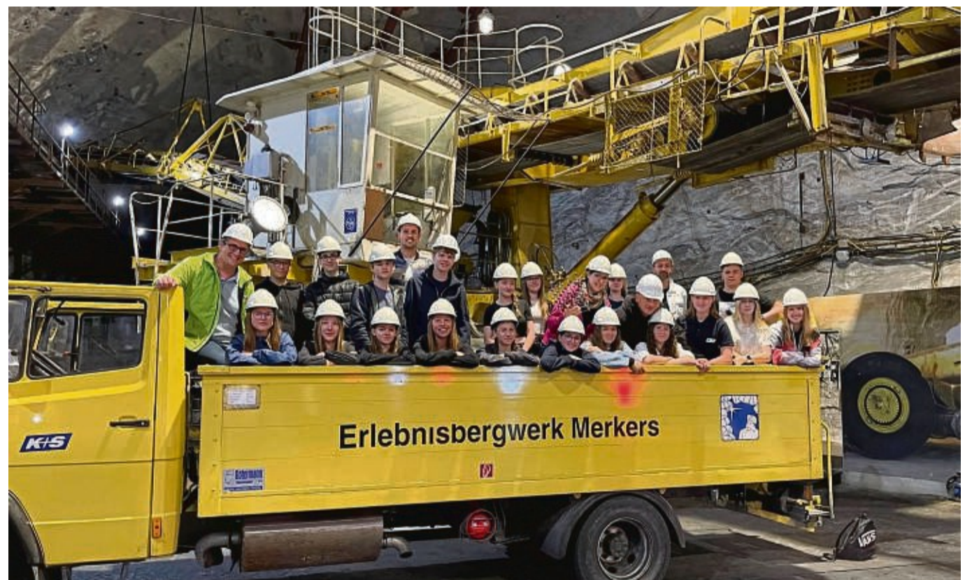
Großbunker als Klassenzimmer: 19 Schülerinnen und Schüler wurden im Erlebnisbergwerk Merkers unterrichtet.