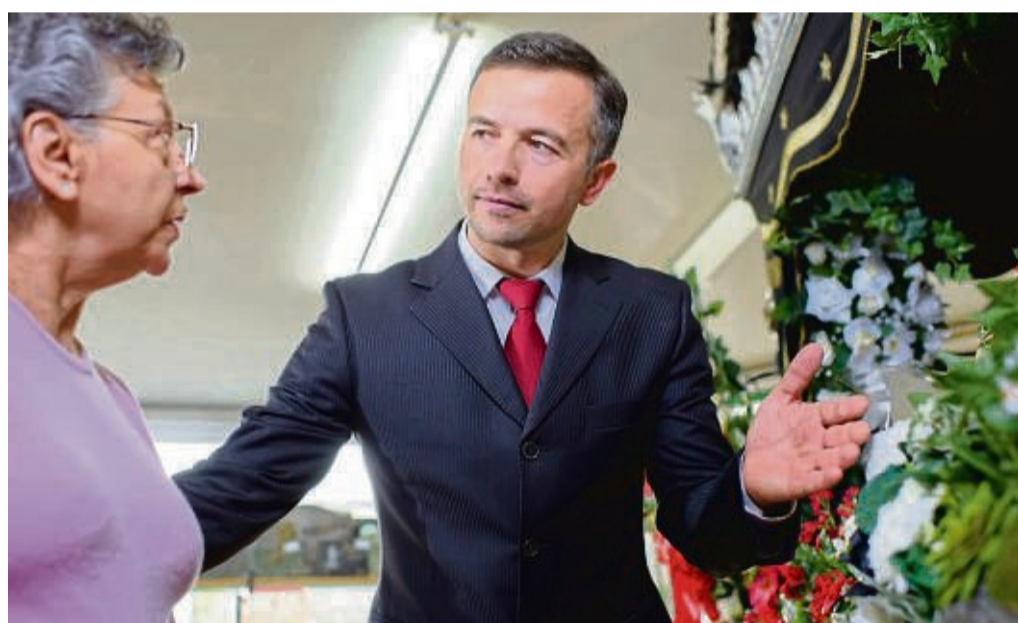
Ein Bestatter erläutert in einem persönlichen Gespräch ausführlich die verschiedenen Möglichkeiten der Bestattungsvorsorge und deren Vorteile.

So wird die eigene Beerdigung selbst organisiert