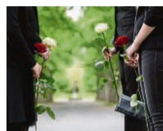
Familie erweist letzte Ehre.