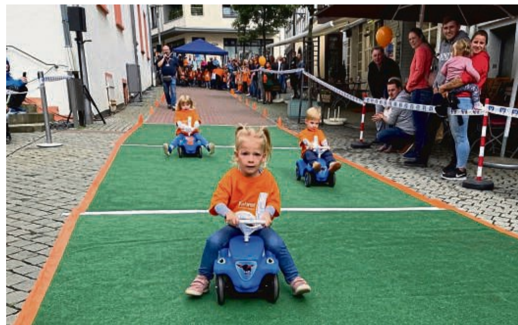
Nachwuchs-Rennfahrer: Der VR-Kindertag steht in diesem Jahr zwar unter dem Motto „Spaß mit Wasser“, das Bobbycar-Rennen am Lullusbrunnen ist aber dennoch fester Bestandteil des Programms.

Die ersten Rennen starten um 11.30 Uhr, für die schnellsten Fahrer gibt es Preise. Wie immer sind alle Aktivitäten kostenfrei. Ein