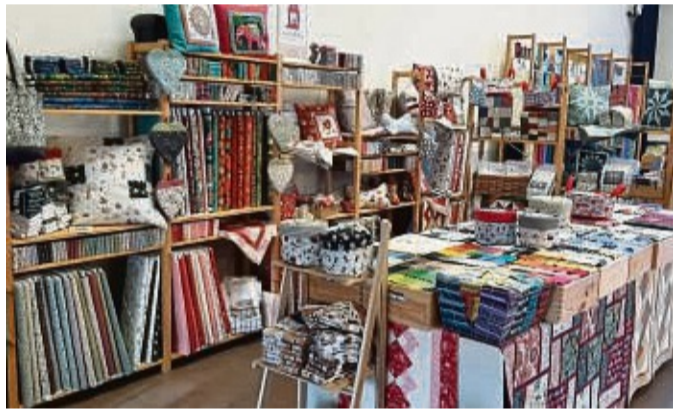
Nähen und vieles mehr: Am 31. August ist in Rotenburg ein Handarbeitstag.

eine längere Bearbeitungszeit, aber ein vorläufiges Resultat spielte der Studioleiter dem gespannten Chor-Ensemble schon mal vor. „Es war seltsam ungewohnt, uns selbst zu hören. Aber insgesamt waren wir sehr stolz auf das, was am Ende dabei herausgekommen ist“, so eine Schülerin im Anschluss. „Wir hoffen, dass der Schulsong nicht nur uns, sondern auch viele andere erfreut.“ zvk