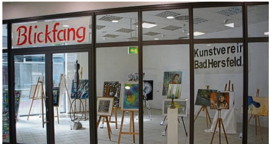
Ein echter Blickfang in bester Lage: In einem leer stehenden Geschäft an der Benno-Schilde-Straße stellt der Kunstverein für einige Zeit Bilder aus.

Der Eigentümer des Gebäudes, Daniel Knauff, hat die Fläche bis Ende August zur Verfügung gestellt. Danach sind die Räumlichkeiten wieder als Geschäftsfläche vermietet.