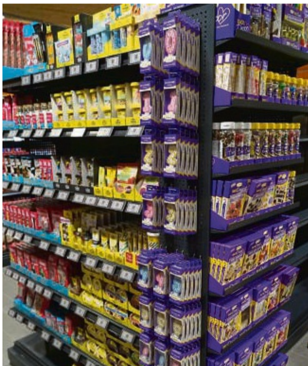
Ein Paradies für Hobbybäcker: Mit den Backwaren von EDEKA bleibt kein Wunsch offen.

Größer, mehr Auswahl und in allen Belangen modern