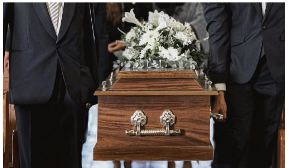
Je nachdem, ob eine Person im In- oder Ausland verstirbt, gibt es unterschiedliche Dinge zu beachten.

Sie benötigen folgende Dokumente für die Überführung eines Sarges: