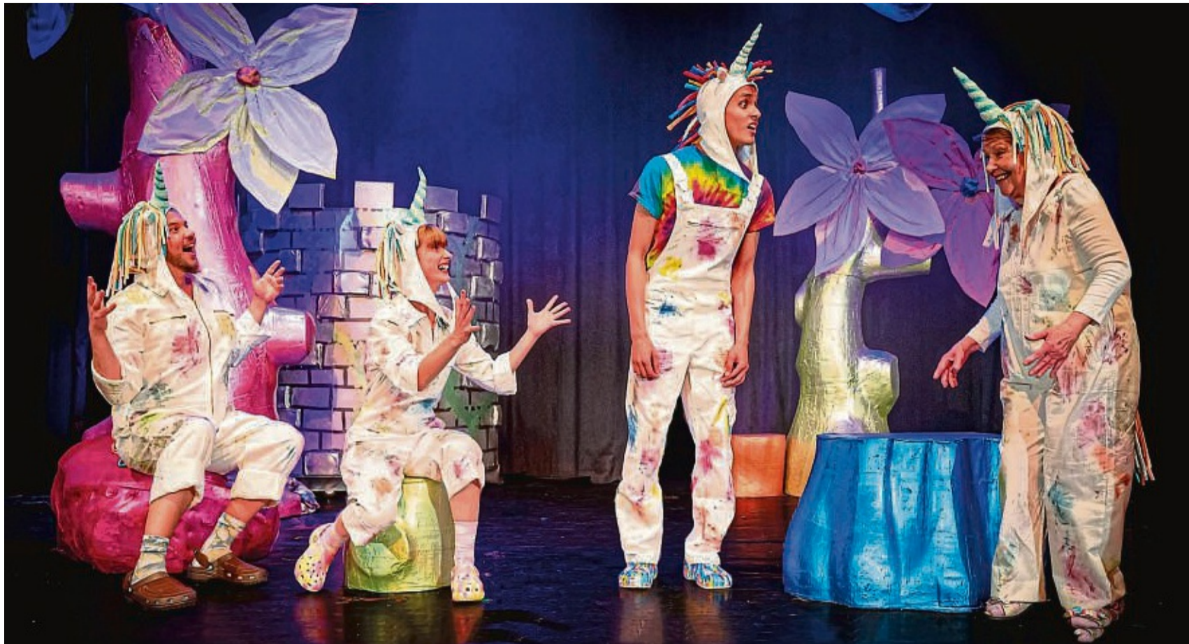
Lampenfieber in Bad Hersfeld: Auch für Kinder ist in diesem Jahr wieder was dabei: das NEINHorn mit seinen Freunden WASBär, NAHund und KönigsDOCHter.