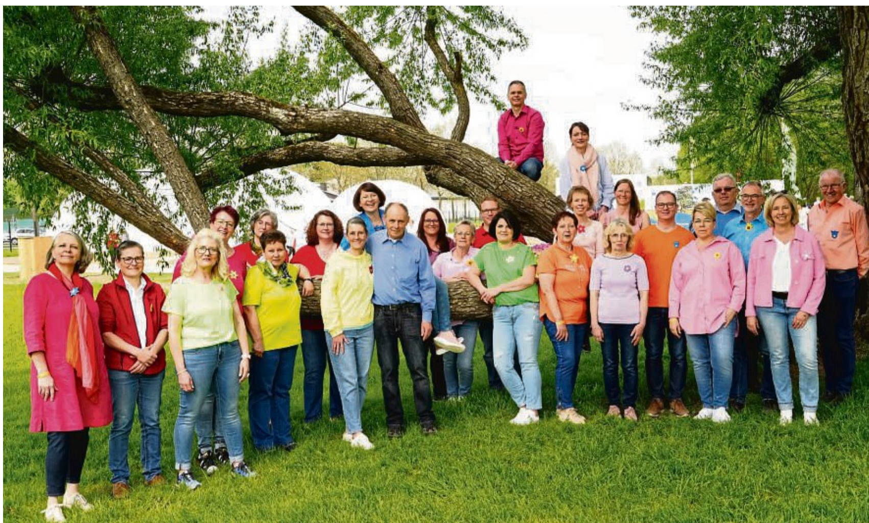
Suchen männliche Unterstützung: Die Sängerinnen und Sänger des Gemischten Chors Landershausen.

Theaterplatz 4+7 | 99817 Eisenach landestheater-eisenach.de