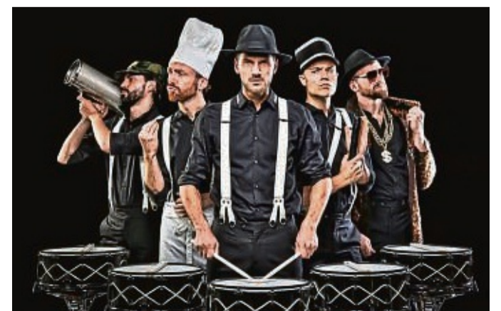
Getrommelte Satire: die fünf „Gangster“ der Schlagzeugmafia präsentieren „Backstreet Noise“.