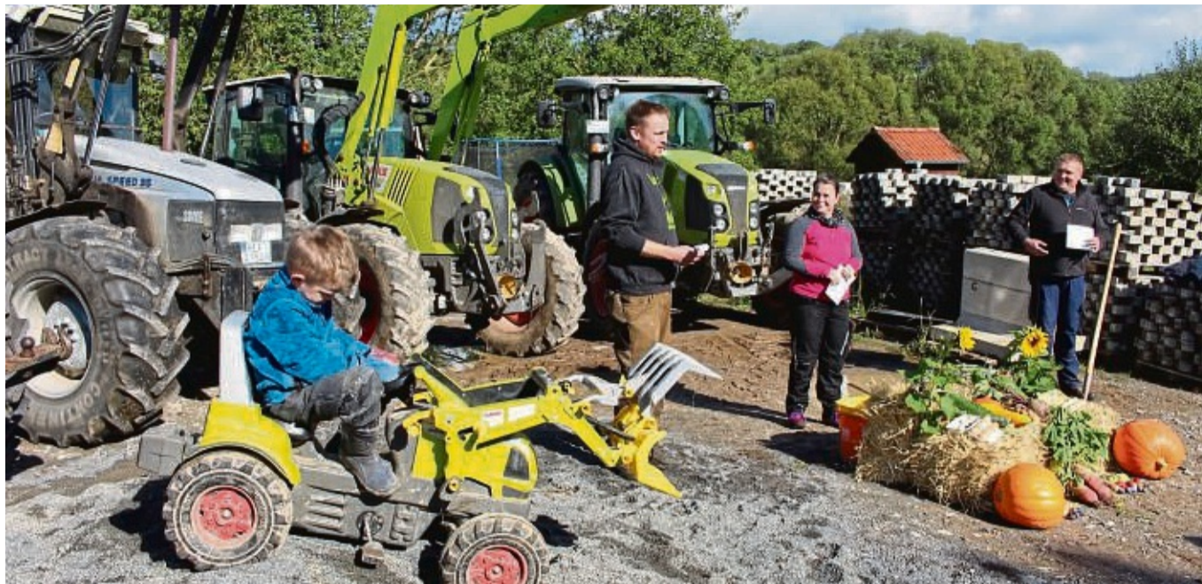
Herausragende Ideen und Projekte gesucht: Im 38. Regionalentscheid des Wettbewerbs „Unser Dorf hat Zukunft“ besucht eine Bewertungskommission die teilnehmenden Orte. Unser Archivbild aus dem Jahr 2022 entstand beim Landesentscheid in Raboldshausen.

Der Wettbewerb „Unser Dorf hat Zukunft“ soll das Engagement der Dorfgemein-