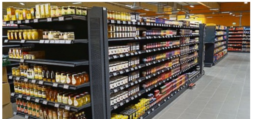
Regionale Produkte und breite Gänge sind Pluspunkte des neuen EDEKA.

Großzügige Frischeabteilungen mit einem appetitlichen Sortiment, breite Gänge und ein Warenangebot von über 25.000 Artikeln sorgen für ein Wohlfühlambiente beim Einkauf. Darunter sind auch regionale Waren wie Honig, Mehl, Eier und Kartoffeln aus Haunetal und Umgebung, über 1400 GUT&GÜNSTIG-/Discount-Produkte, über 1000 Bio-Artikel, vegane, asiatische, russische Produkte