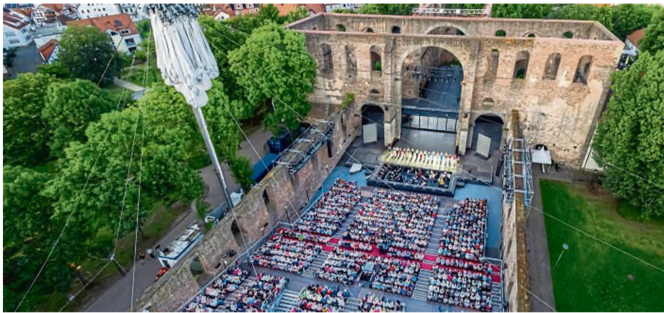
Viel Zuspruch für die 73. Bad Hersfelder Festspiele: Die Gesamtauslastung bei den Stücken in der Stiftsruine (Foto) und im Schloss Eichhof liegt bei mehr als 90 Prozent.