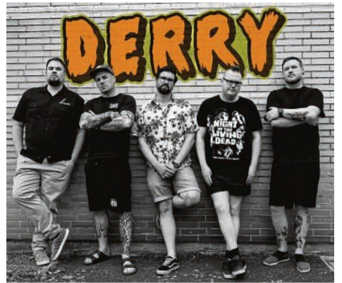
Punk aus Marburg: Die Band „Derry“ ist beim Schwanenteich Open Air in Richelsdorf mit dabei.