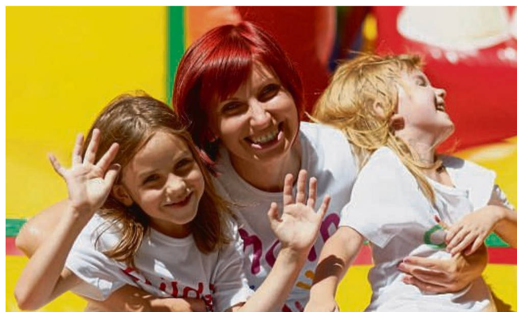
Spaß garantiert: Beim AWO-Tag gibt es unter anderem eine Hüpfburg für die Kinder.

Von 14.30 Uhr bis 18.30 Uhr können sich Besucher ausführlich über die Angebote der AWO vor Ort informieren – unter anderem über Hilfen, die Senioren den Alltag im eigenen Zuhause erleichtern: von der ambulanten Pflege über Essen auf Rädern bis zur Tagespflege und einer kostenlosen Pflegeberatung.