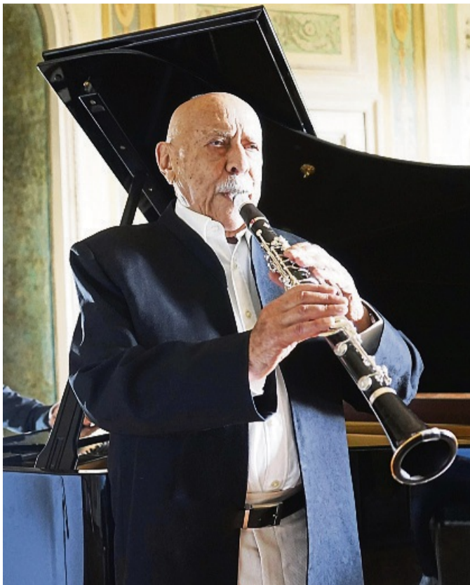
Klarinettenvirtuose Giora Feidman.

der Preisträger mehrerer Klassik-Echos, seine Klarinette in die Hand, um durch die Musik zu kommunizieren, mit den Menschen eine Botschaft zu teilen und sie an seiner inneren Stimme teilhaben zu lassen. Sein Klang ist wandelbar, leidenschaftlich und emotional, aber auch sinnlich und erdverbunden.