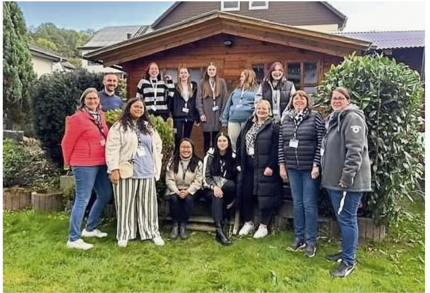
Die neue therapeutische Wohngruppe in Braach mit dem Vorstand der Stiftung Beiserhaus und dem Team der Wohngruppe.

Die therapeutische Wohngruppenarbeit werde durch die komplexen gesellschaftlichen Veränderungen der vergangenen Jahrzehnte immer mehr benötigt. Sie zeichne sich vor allem durch eine intensive Begleitung und Betreuung der Kinder und Jugendlichen aus. Dies wird durch einen höheren Personalschlüssel, multiprofessionellen Teams aus pädagogischen Fachkräften, Psychologen und einem Kinder- und Jugendpsychiater sowie Kooperationen mit den regionalen Kinder- und Jugendpsychiatern ermöglicht, heißt es weiter. Die Arbeit der pädagogischen