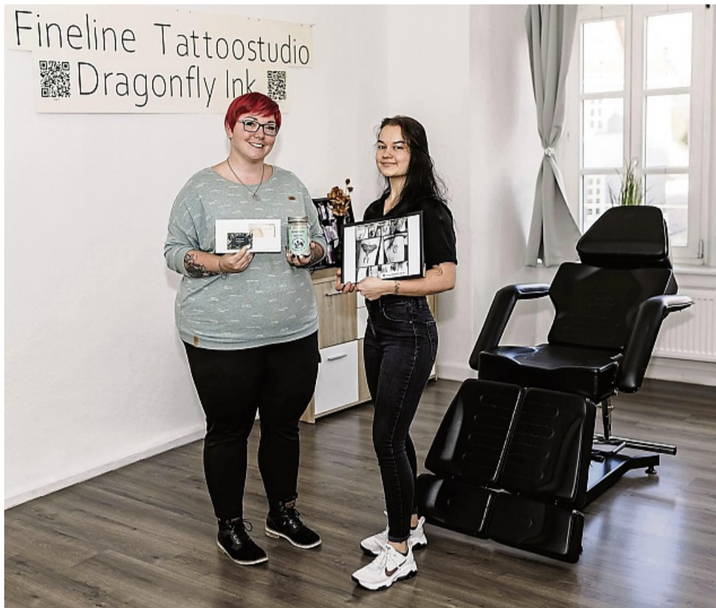
Die Spendenaktion des Tattoostudios „Dragonfly Ink“ war dem Tierschutzverein gewidmet.

Rotenburg – Bei einer Übergabe der Einnahmen aus einer Spendenaktion zugunsten des Rotenburger Tierschutzvereins waren kürzlich 620 Euro zusammengekommen. Die Spendenaktion wurde von den Mitarbeitenden des Fineline-Tattoostudios „Dragonfly Ink“ organisiert, die dem Verein helfen möchten, damit sich die Tierschützer weiter um ausgesetzte, kranke oder vermisste Tiere in Rotenburg kümmern können, heißt es in einer Mit-