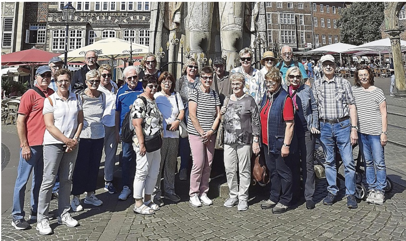
Die 3-Tagesfahrt der ver.di-Senioren Osthessen ging in diesem Jahr nach Bremen.