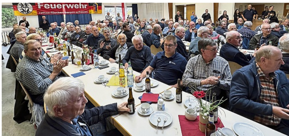
Volles Haus beim Nachmittag der Feuerwehrsenioren in Tann.