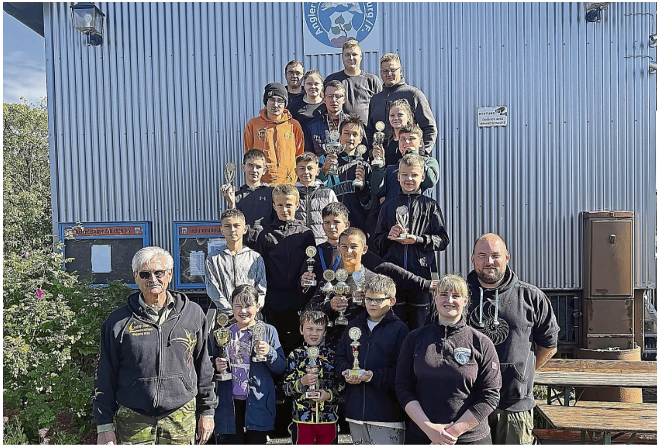
Teilnehmer und Helfer beim Schnupperangeln des Anglervereins Rotenburg.

Dass Angler in erster Linie Naturschützer und nicht nur Fischfänger seien, zeigte der Zweite Vorsitzende anhand