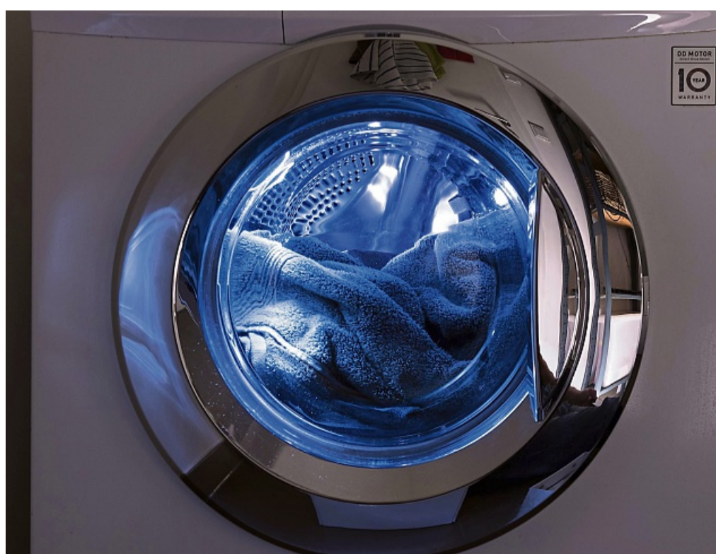
Die Stiftung Warentest hat Frontlader und Toplader in einer umfassenden Untersuchung getestet, um die besten Waschmaschinen in Bezug auf Waschleistung, Handhabung und Umweltfreundlichkeit zu ermitteln.

Insgesamt 218 Tonnen Textilien wurden dafür insgesamt durch die Maschinen gejagt - und 610 Kilo Waschmittel verbraucht. Das Ergebnis: Zwei Toplader sind „gut“, einer ist „befriedigend“, einer „ausrei-