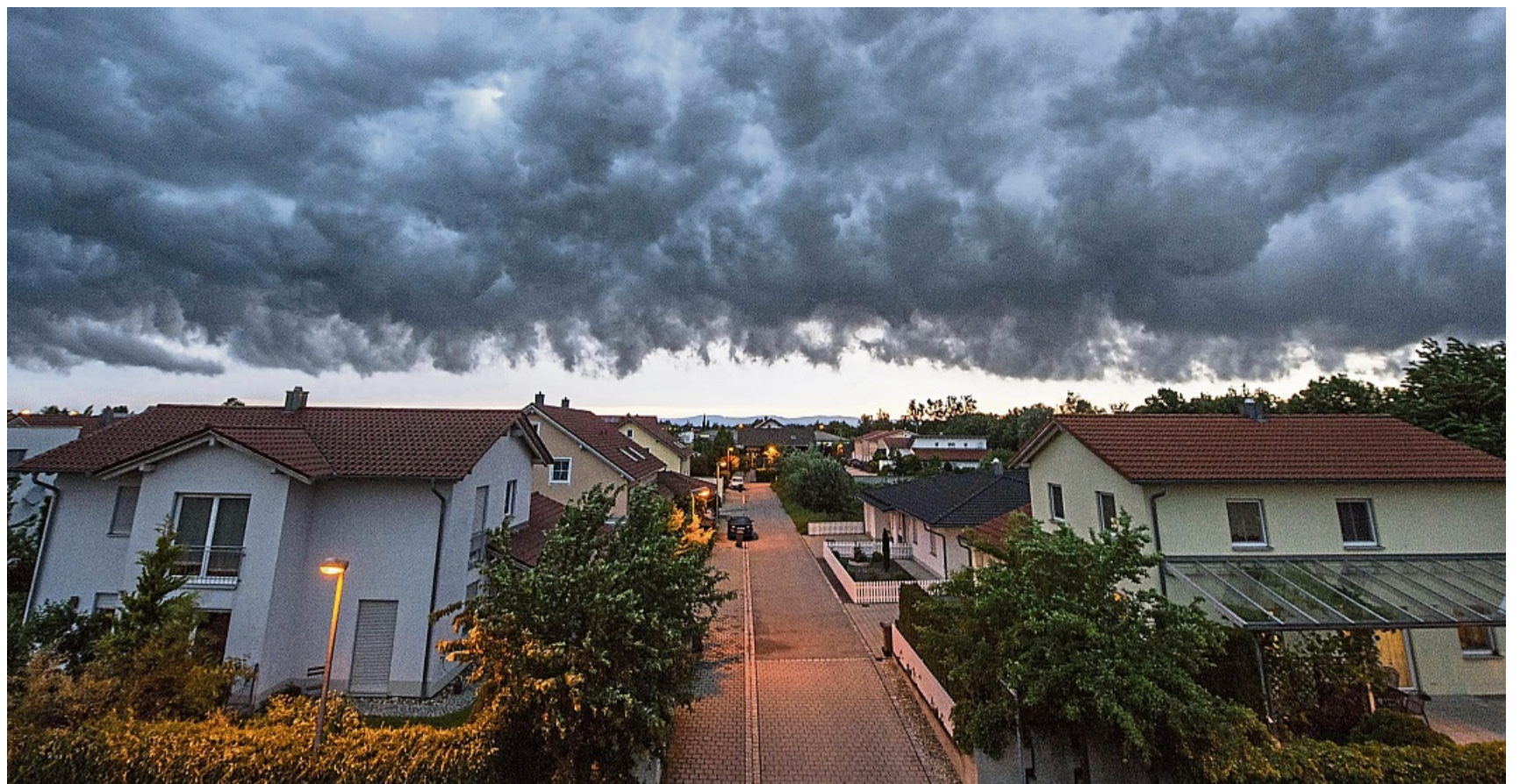
Fenster zu, Blumenkübel rein: Droht ein Sturm, sollten Sie sich und lose Gegenstände in Sicherheit bringen.

Was kann man also tun, sobald ein Sturm angekündigt ist? Zunächst ist es wichtig, alle Türen und Fenster zu schließen. Lose Gegenstände wie Gartenmöbel oder nicht eingefahrene Markisen und andere