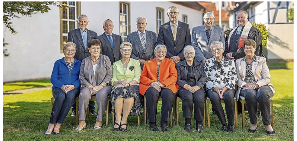
Die Frauen und Männer, die in Lisenhausen eiserne Konfirmation feiern konnten, beim Gruppenfoto.

Diamantene und Eiserne Konfirmation in Lisenhausen