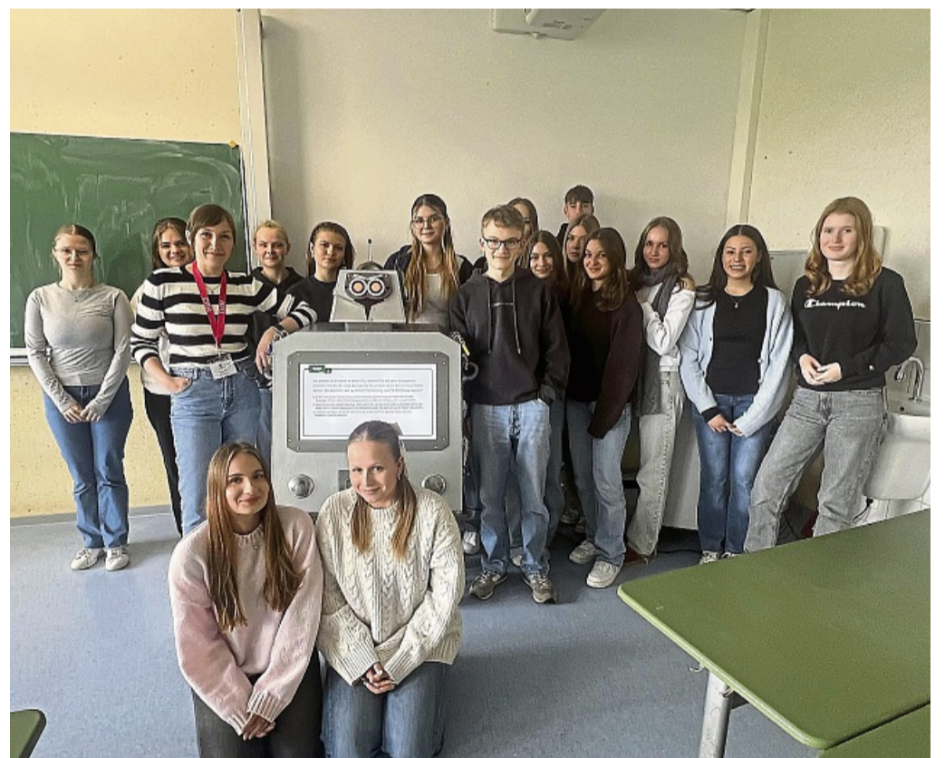
Aktionstag an der Gesamtschule Niederaula: „Tausend Rollen – Dein Job!“

Aktionstag „Tausend Rollen – Dein Job!“ an der Grundschule in Niederaula