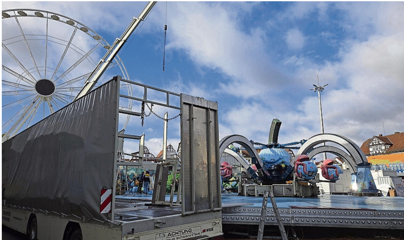
Eine Woche Lolls geht zu Ende: Am Dienstag wurden die Fahrgeschäfte abgebaut.

Besonders im Festzelt war an diesem Abend kein Durchkommen mehr. Auch das Seniorenprogramm der Stadt im Fest-