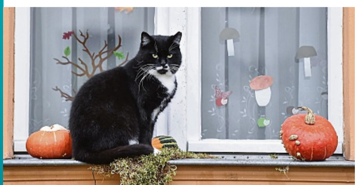
Bei der Halloween-Deko sind Haustierbesitzer lieber zurückhaltend - sonst droht echte Gefahr für ihre Vierbeiner.