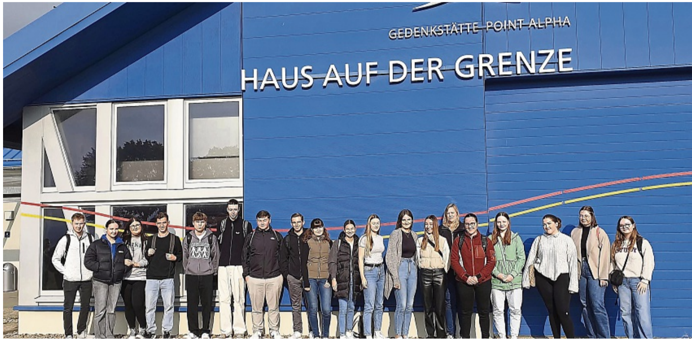
Die jungen Verwaltungsfachangestellten aus dem Landkreis Hersfeld-Rotenburg besuchten die Gedenkstätte Point Alpha.

In diesem Zusammenhang hat das Verwaltungsseminar