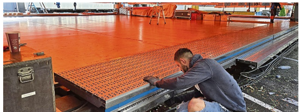
Abbau: Die Mitarbeiter am Autoscooter der Familie Distel waren am Dienstag fleißig.

Die traditionelle Freiverlosung mit tollen Preisen zum Ende des Lullusfestes zog mehrere tausend Zuschauer in seinen Bann. DANIEL GÖBEL