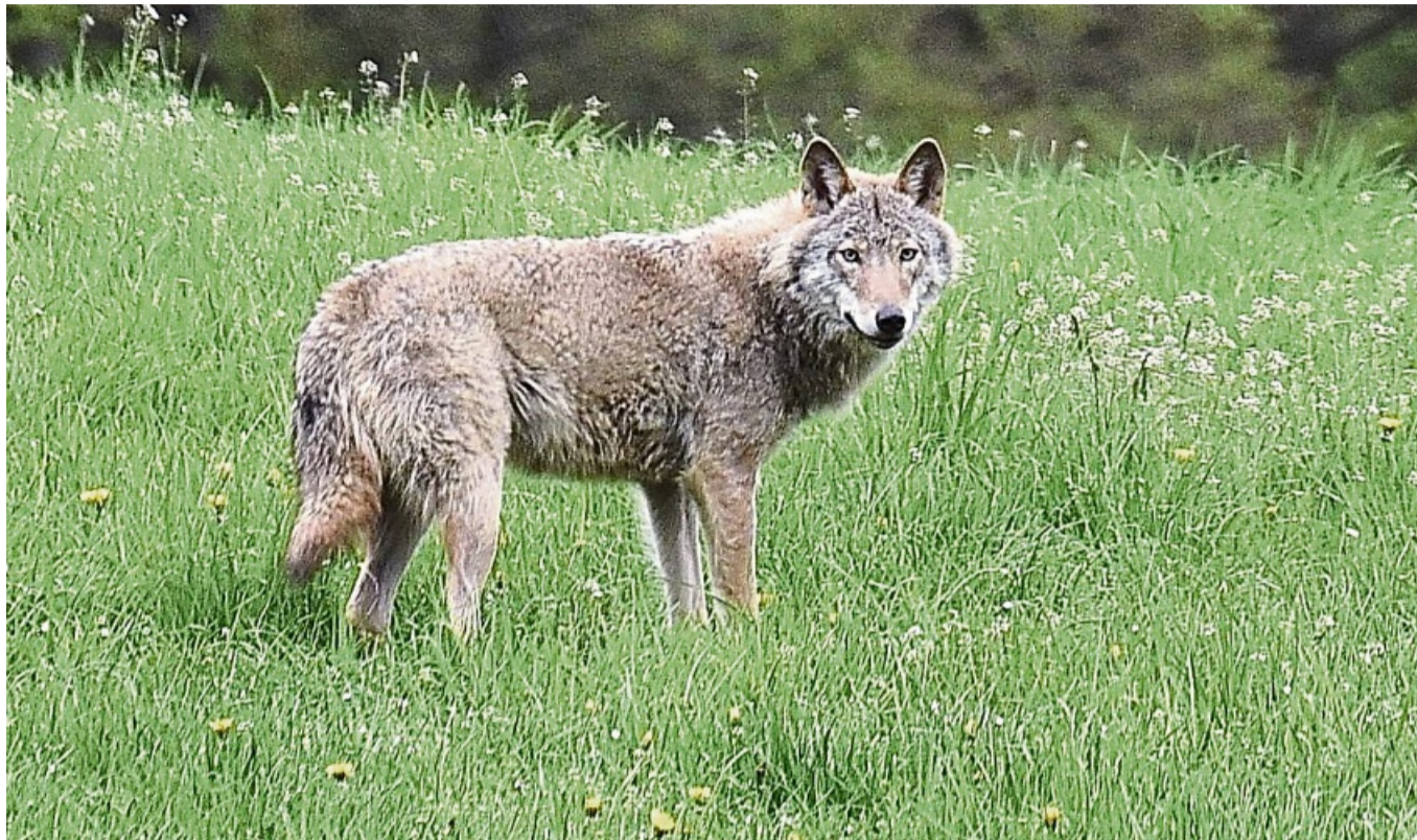
Das Monitoring des Wolfszentrums in Hessen wird von Landwirten und dem Bauernverband Hersfeld-Rotenburg kritisiert.

Laut Schäfer kritisieren auch immer mehr Landwirte aus dem Kreis das Hessische Wolfsmonitoring, das seit Oktober unter der Führung von Hessen-Forst steht, da nicht alle Vorfälle gründlich untersucht würden. Besonders ärgerlich sei einer der drei jüngsten Fälle aus Heringen, bei dem auf eine