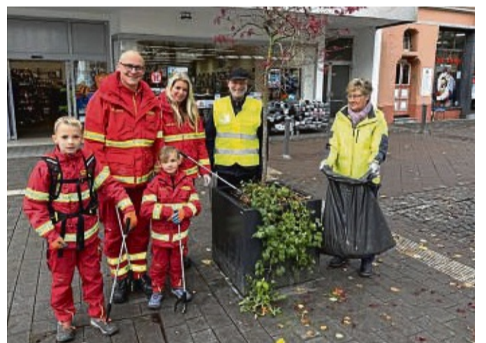
Unterwegs in der Innenstadt: Die Mitglieder der DLRG-Ortsgruppe Bad Hersfeld.

Für die Mitglieder der Bruderschaft Hersfelder Mönche, der DLRG Bad Hersfeld, dem Fußball-Sportverein Hohe Luft und den weiteren Sammlern von jung bis alt führten die Wege dann etwa in den Schilde Park, Richtung Bahnhof, den Stiftsbezirk mit Nordschulpark, den Jahnpark und die Fußgängerzone. Sollte einmal eine Mülltüte zu schwer geworden sein,