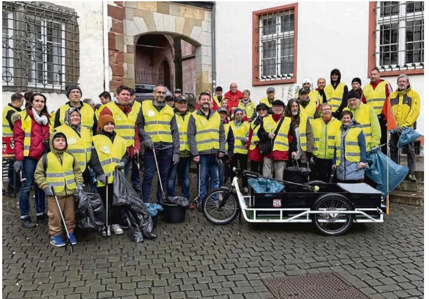
Gruppenbild vor dem Rathaus: Mehr als 50 Helferinnen und Helfer beteiligten sich an der Herbstputz-Aktion in der Bad Hersfelder Kernstadt.

Terminvereinbarungen für eine Beratung durch die Architektin unter Tel. 06624/1 2830 63. Weitere Fragen können mit der Gemeindeverwaltung unter Tel. 06625/92 03 28 geklärt werden. red/sen