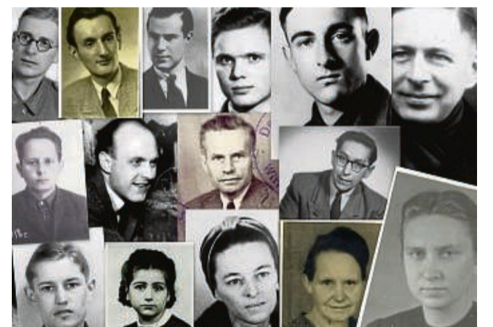
Ausstellung: „... denen mitzuwirken versagt war“: Ostdeutsche Demokraten in der Nachkriegszeit.

Beide Sonderausstellungen, die von der Bundesstiftung Aufarbeitung präsentiert werden, laufen bis zum 30. Januar 2025 und können zu den regulären Öffnungszeiten der Gedenkstätte Point Alpha besichtigt werden. Infos: pointalpha.com red/kai