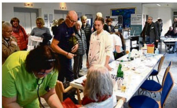
Hochbetrieb an den Informationsständen: Viele Besucher nutzten die Gelegenheit und ließen sich den Blutdruck- oder Blutzuckerwert bestimmen. Zudem gab es Einblicke in die Arbeit des Herzkatheterlabors des HKZ.