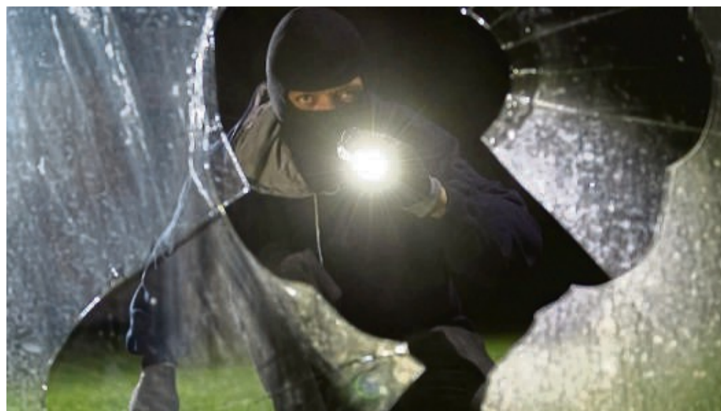
Eine eingeschlagene Fensterscheibe als Eintrittspforte für Einbrecher (gestellte Szene).

Beratungstermine können auch telefonisch vereinbart werden. Die Einbruchschutzberater kommen auch für eine individuelle Schwachstellenanalyse direkt zu den Bürgern nach Hause – kostenfrei.