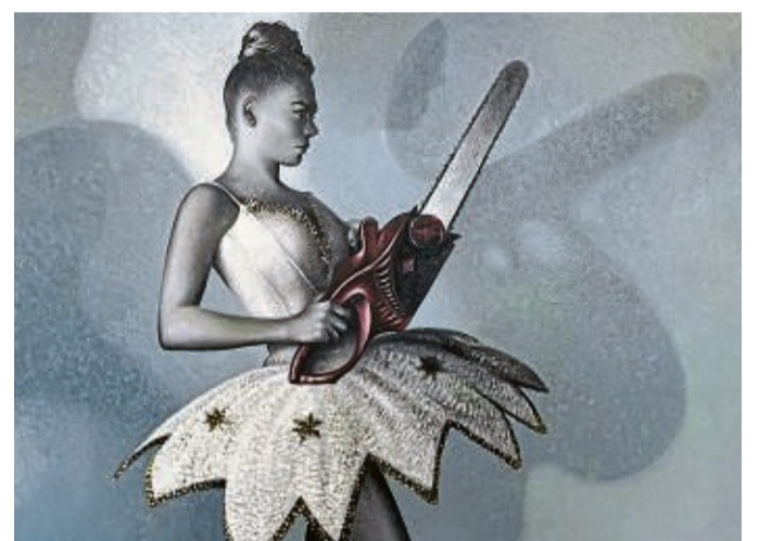
Mit Kleid und Kettensäge: Peter Blums „Ninja“.

In Bewegung sind die Figuren von Hans Borchert, die er mit einfach wirkenden Strichen auf die Leinwand bringt. Puck Steinbreches meditative Landschaften sind ebenso zu sehen wie die Wer-