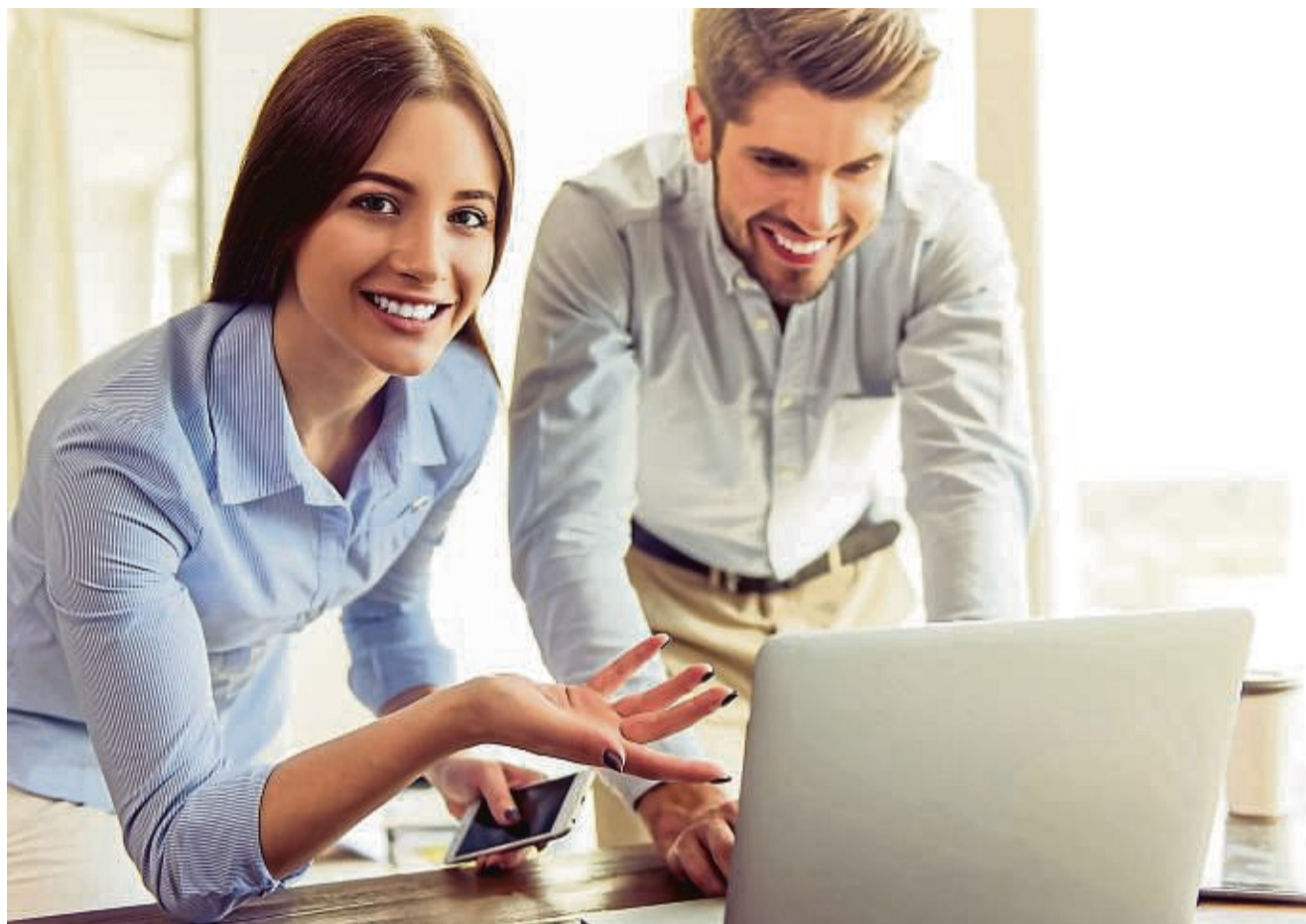
Eine Bewerbungsphase kann häufig anders laufen, als erhofft. Mit einer Initiativbewerbung kann man jedoch unter Umständen durch die gezeigte Eigeninitiative punkten.

Tipps und Infos rund um die Bewerbungsart