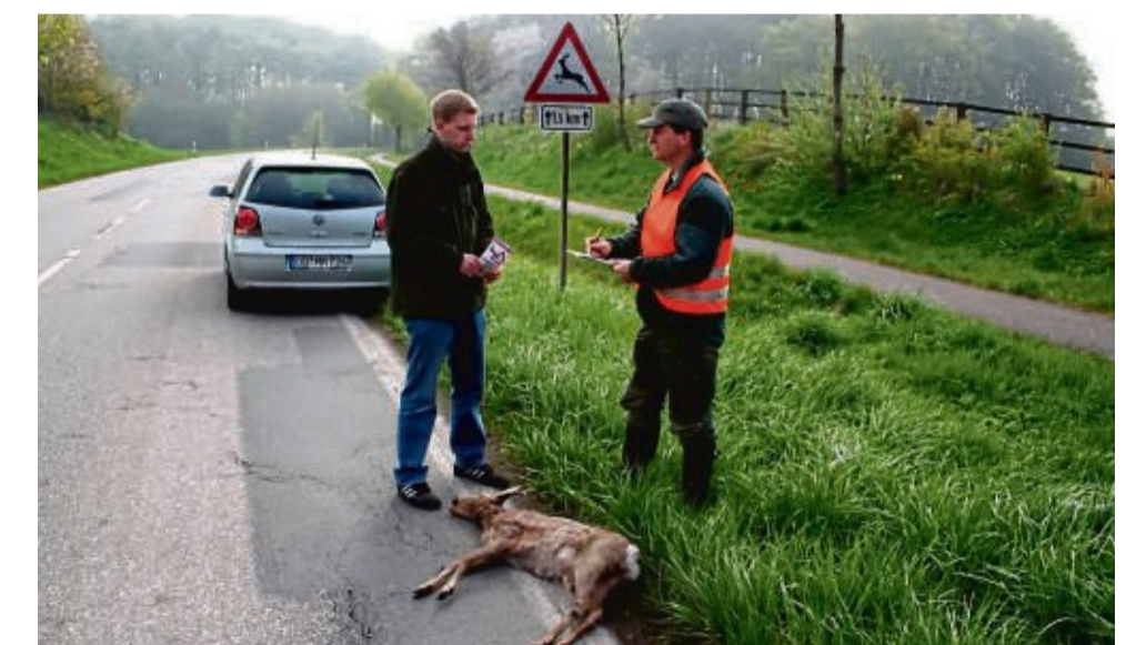
Durchschnittlich alle zweieinhalb Minuten ereignet sich in Deutschland ein Wildunfall. Auf Landstraßen ist die Gefahr besonders groß.

Wer ein Tier vor sich sieht, sollte bremsen, abblenden