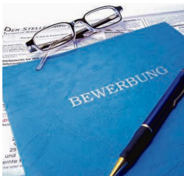
Mit gut vorbereiteten Unterlagen kann bei Arbeitgebern gepunktet werden.