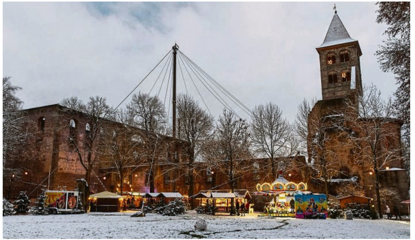
Los geht's: Der Weihnachtsmarkt der Träume im Stiftsbezirk beginnt am Montag, 25. November.

Ein Höhepunkt an diesem Wochenende wird die hr3-Disney-Weihnachtsmarkt-tour sein: Am Samstag, 30. November, kann man in der Zeit von 13 Uhr bis 20 Uhr animierte weihnachtliche Fotos (GIFs) erstellen und mit