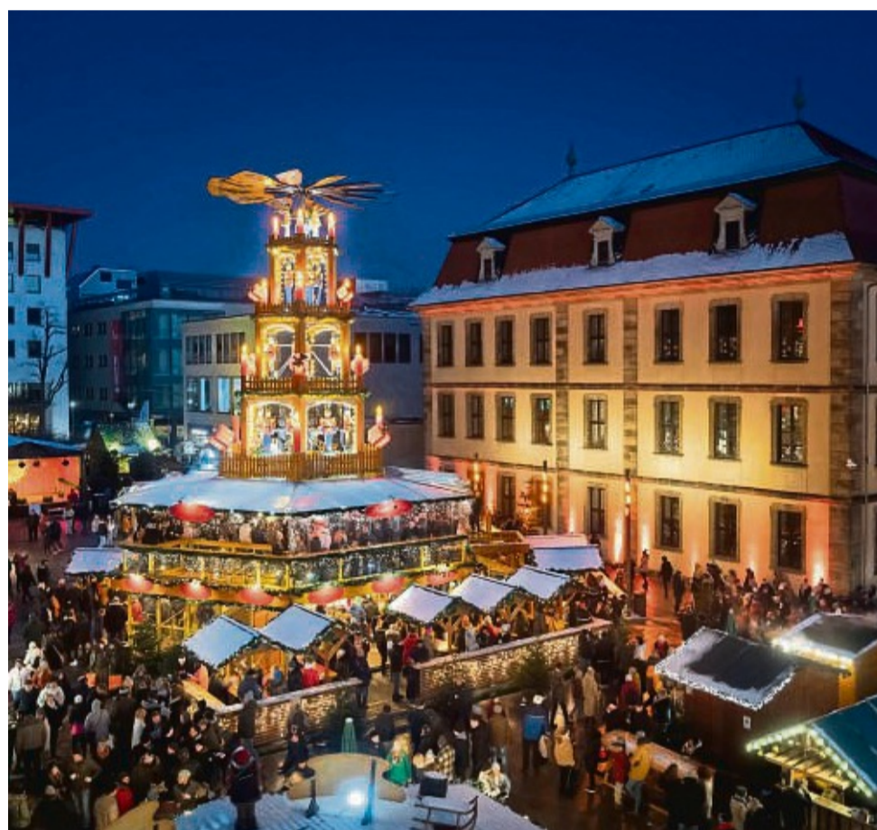
Der Weihnachtsmarkt in Fulda bietet jedes Jahr ein abwechslungsreiches Programm und ein tolles Ambiente.

Mal kurz in eine andere Welt abtauchen: Das mittelalterliche Weihnachtsdorf mit seinen besonderen Duf-