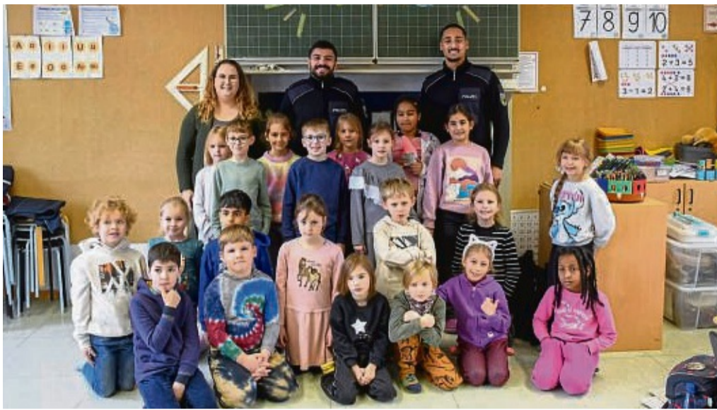
Im Einsatz zum Vorlesetag: die Bundespolizei bei den Zweitklässlern der Albert-Schweitzer-Schule.

Weil das Lesen ein wichtiger Bestandteil im Leben von Menschen sei und das weiterhin so bleiben solle, suchte die Bundespolizei einen Kooperationspartner und wurde in der Albert-Schweitzer-Schule fündig. Auch der Lesestoff war mit dem Kinderbuch „Bundespolizei im Einsatz – Max und Fabi jagen den Piraten“ schnell gefunden, das nun auch in der Schulbücherei ausgeliehen werden kann. Acht Polizeimeisteranwärterinnen und Polizeimeis-