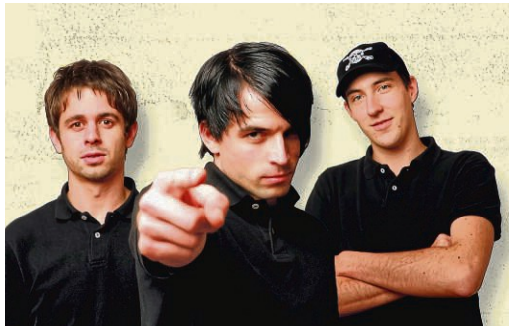
Punk-Rock-Power: Die Band Montreal wurde 2003 in Hamburg gegründet.