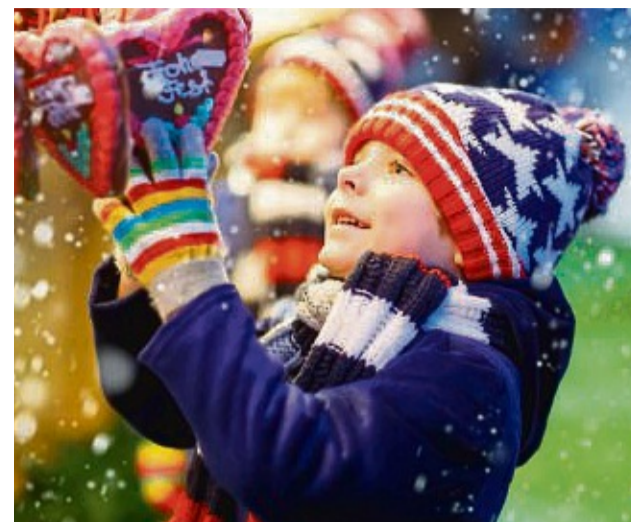
Auch für die Kleinen wird es auf den Advents- und Weihnachtsmärkten vieles geben.

Suchen Sie sich Ihre Favoriten aus und genießen Sie die Vielfalt, die überall geboten wird!