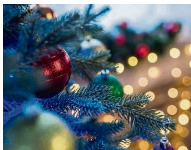
In Heringen wird im Rathaus und auf dem Marktplatz davor gefeiert.