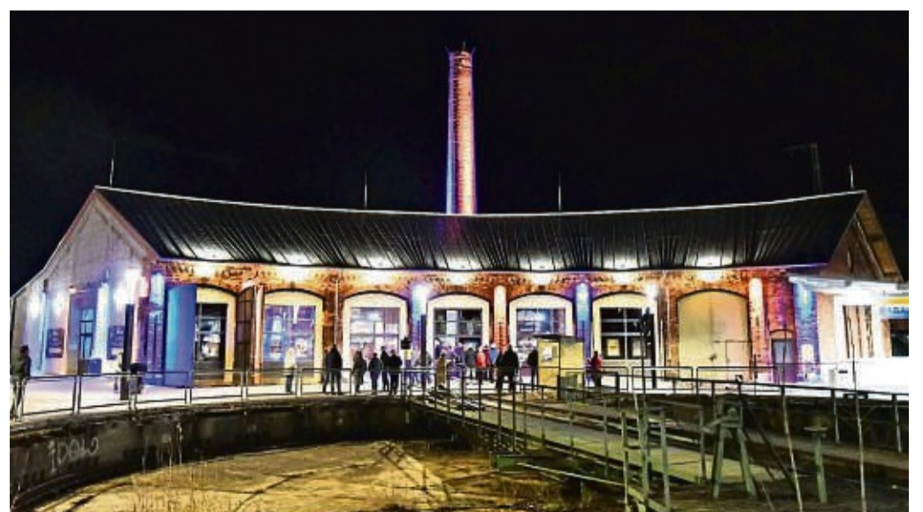
Der Lokschruppen-Vorplatz wird in diesem Jahr Standort für den Adventsmarkt und sich schon in wenigen Tagen in ein Winter-Wunderland verwandeln.

DÜRKOP GmbH, Sitz: Nedderfeld 91, 22529 Hamburg.