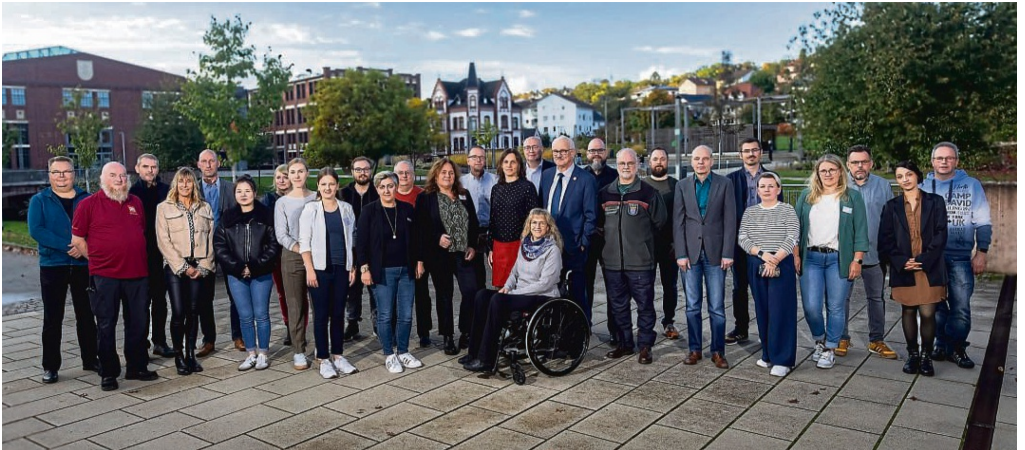
Erfolgreicher Aktionstag: Auch für die Betriebe war der Duo-Day Hersfeld-Rotenburg eine Bereicherung.