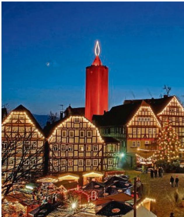
In Schlitz wird es nicht nur durch die riesige Kerze weihnachtlich.

Ein weiteres Highlight ist die Verkaufsausstellung der Kreativen Frauen im Festsaal der Vorderburg am zweiten Adventswochenende.