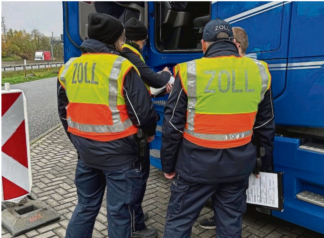
Das Speditionsgewerbe im Fokus: Zöllner bei einer Personenerfassung am LKW.

In zwei Fällen besteht der Verdacht auf eine fehlende Sofortanmeldung zur Sozialversicherung und in drei Fällen liegen Hinweise auf Nichtzahlung des Mindestlohnes vor.