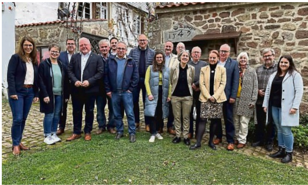
Traf sich zur Klausurtagung: Der Förderausschuss der Leader-Region Knüll.

Die Entscheidung, ob ein Projekt förderwürdig ist oder nicht, trifft der Förderausschuss der Leader-Region Knüll. Der Förderausschuss ist das Entscheidungsgremium für alle Vorhaben, die eine solche Förderung beantragen möchten. Das Gremium setzt sich zusammen aus Wirtschafts- und Sozialpart-