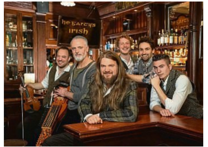
Die Band Versengold spielt eine Mischung aus Pop-Rock und Mittelalter-Folk.

Roskapankki: Die Bonner haben sich nicht nur einem Genre verschrieben, sondern trumpfen mit einer Mischung aus Ska, Punk, Rock, Reggae einer Prise Metal – und was sonst noch für Stimmung sorgt – auf. red/dag/axt