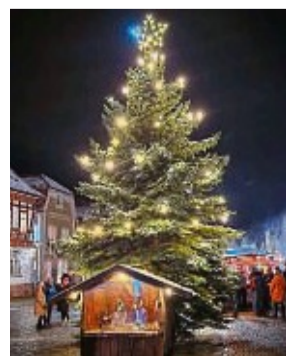
Drei Tage Programm in Vacha.

17 Uhr tritt die Grundschule auf und Weihnachtsbäume werden versteigert. Außerdem ist am Sonntag verkaufsoffen. Samstag und Sonntag hat die Bibliothek und die Burg Wendelstein mit Kaffee & Kuchen geöffnet.