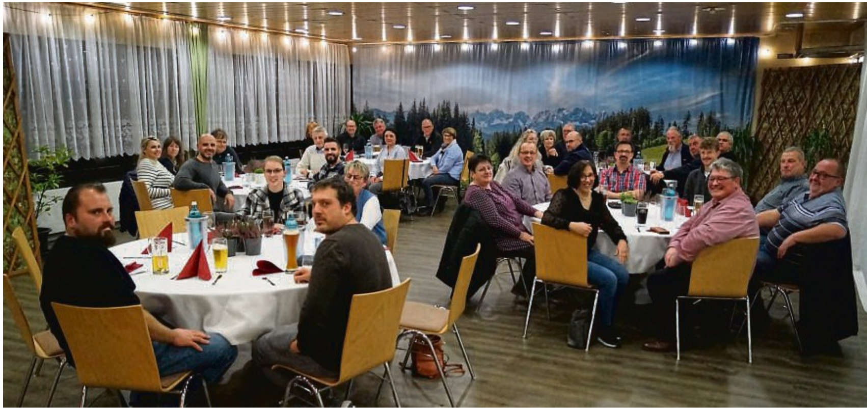
Auf reges Interesse stieß die Mitgliederversammlung des Gewerbevereins Niederaula im Alten Forsthaus.