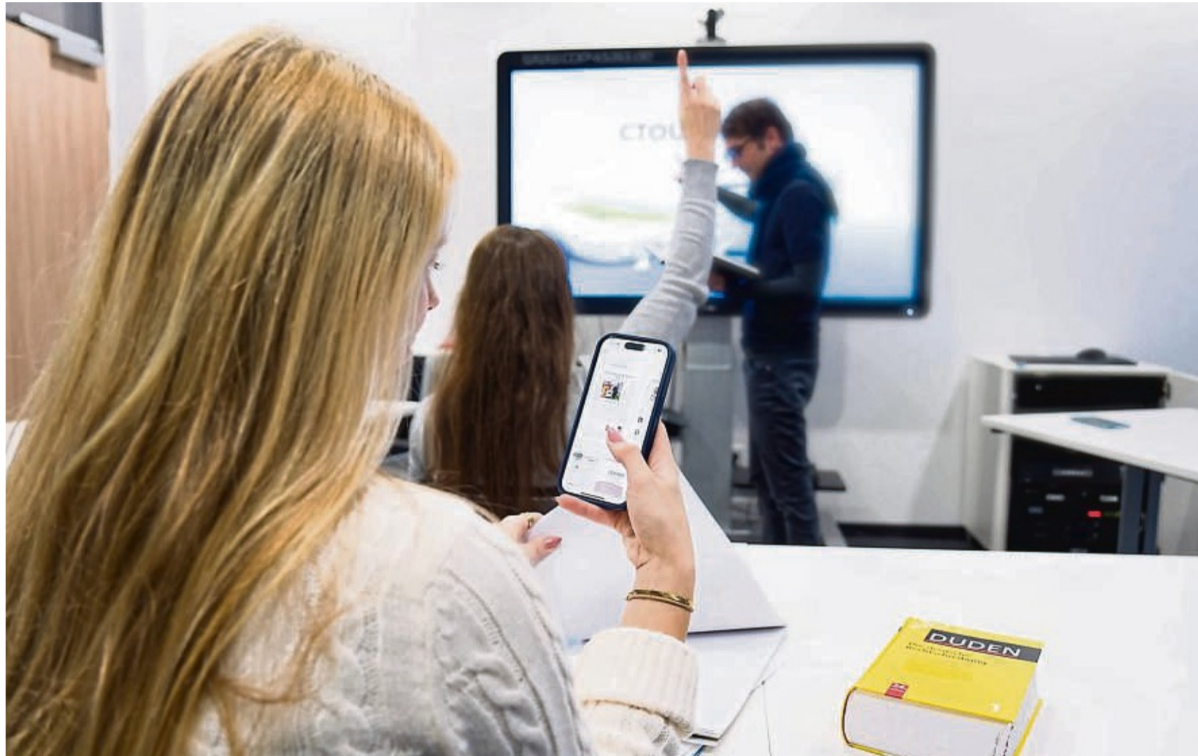
Handys im Unterricht könnten bald verboten sein: Hessens Kultusminister Armin Schwarz (CDU) drängt auf einheitliche Regelungen.