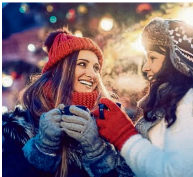
Es weihnachtet sehr!

Advents- und Weihnachtsmärkte locken mit tollen Programmen