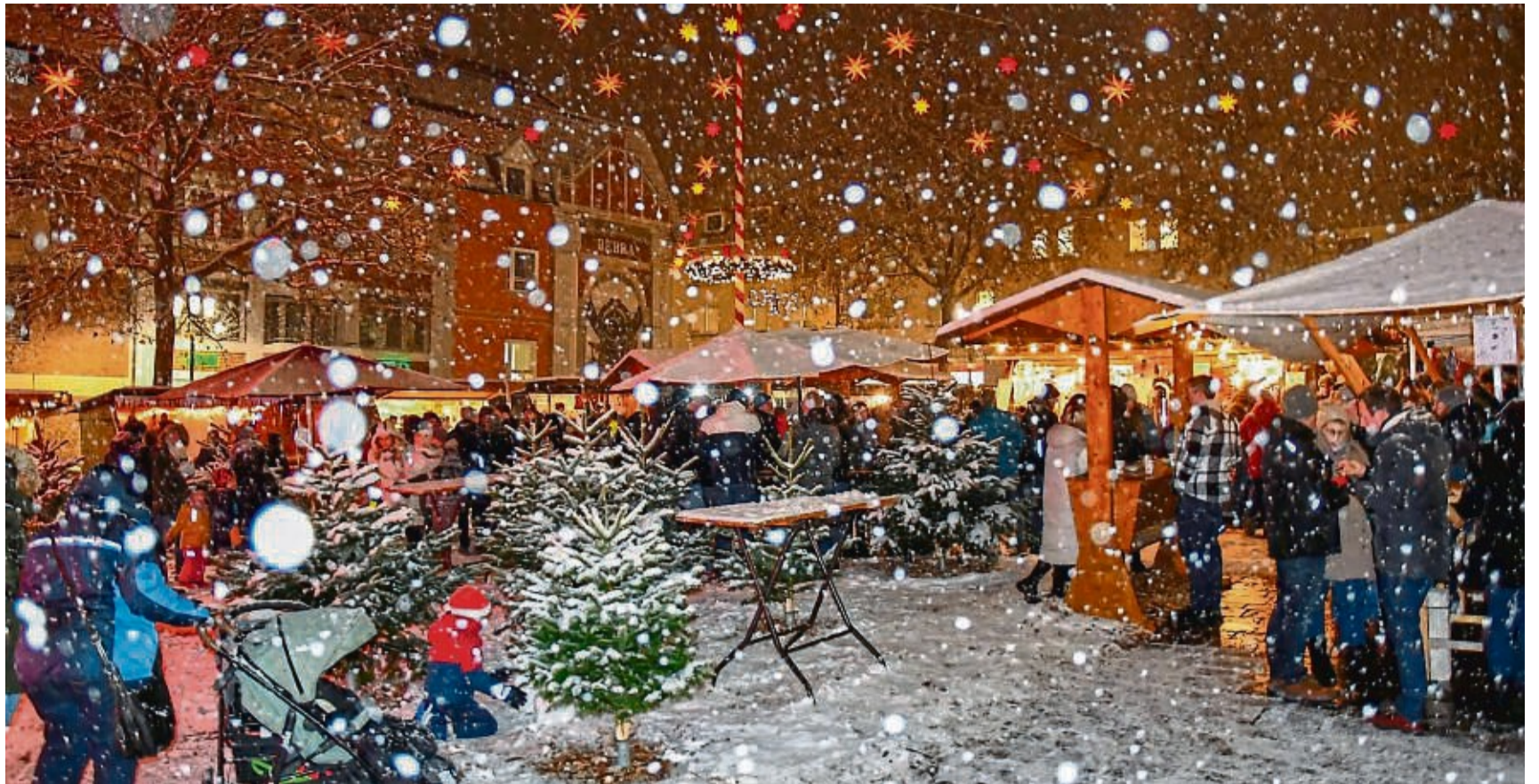
Der Adventsmarkt in Bebra findet vom 28. November bis 1. Dezember einmalig auf den Lokschruppen-Vorplatz statt und wird nicht, wie in den Vorjahren auf dem Rathausmarkt (Bild) zu finden sein. Der Platz wird gerade umgebaut und so muss das weihnachtliche Event ausweichen.