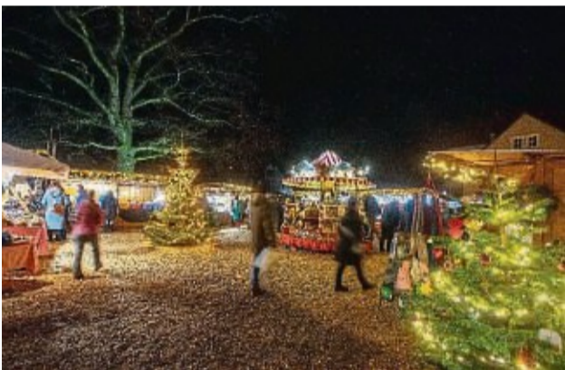
Festlich und traditionsreich wird es an zwei Adventswochenenden in Lauterbach.