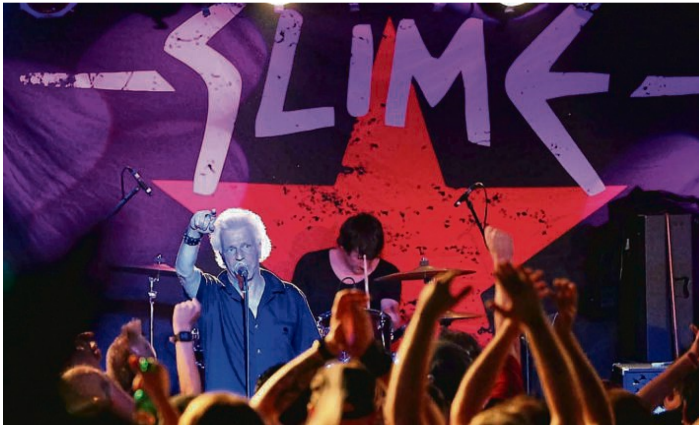
Slime: Die legendäre, 1979 gegründete Punk-Band aus Hamburg spielt im kommenden Jahr auf dem Haunerock-Festival.

Haunerock-Festival 2025: Organisatoren geben komplettes Programm bekannt