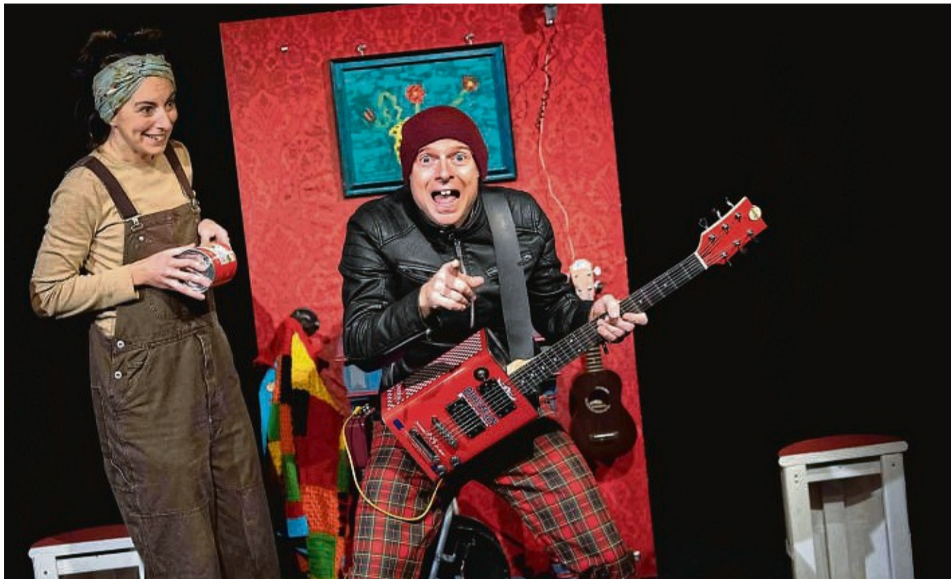
Das Theater Mittendrin aus Fulda spielt zwischen Humor und Witzeleien das Stück „Stadtmaus und Feldmaus“.

Für die Kindergärten bieten wir am Dienstag, 25. März, das Stück „Frau Mangolds kleiner Garten“, für die ganz Kleinen an. Eine amüsante Geschichte was es mit dem „Grünen Daumen“ auf sich hat, mit launiger Musik, Spannung und federleicht. Das Theater Laku Paka aus Kaufungen zeigt die poetische Geschichte um 11 Uhr. Das Theater Mittendrin aus