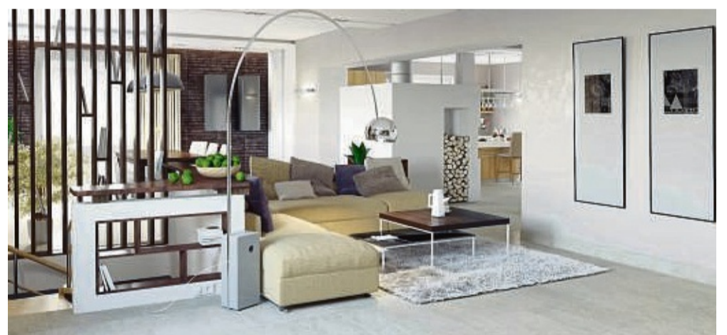
Ein Wohnzimmer mit Keramikfliesen wirkt zeitlos und stilvoll.

Matt, glänzend, strukturiert oder glatt – keramische Fliesen können passend zum persönlichen Wohnstil ganz unterschiedliche Wirkungen entfalten.