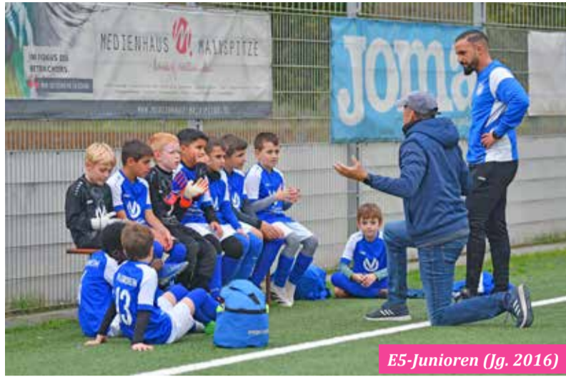
E5-Junioren (Jg. 2016)

VfB Ginsheim/Jugendabteilung – Neun Siege, zwei Remis, drei Niederlagen – die VfB-. Die Ergebnisse vom 30.10.–03.11.: A-Junioren Gruppenliga: U19/A1 SV Fürth – U19/A1 1:2. A-Junioren Kreisliga: U18/A2 – U19/A1 SKV Mörfelden 1:5. B-Junioren Gruppenliga: U17/B1 TV – U17/B1 Groß-Umstadt 1:1. B-Junioren Kreisliga: U19/A1 TV Hassloch – U18/A2 3:3. C-Junioren Verbandsliga: U15/C1 Karbener SV – U15/C1 6:1. C-Junioren Kreisliga: U14/C2 – U15/C1 JSG Stockstadt/Biebesheim 5:1. D-Junioren Kreisliga 2: U13/D1 – U13/D1 Italia Nauheim 3:2.