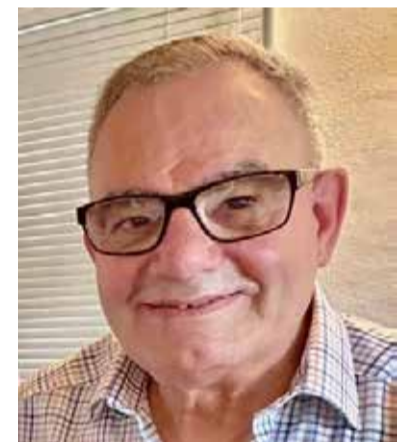
zwei Söhne und zuletzt zwei Enkel.