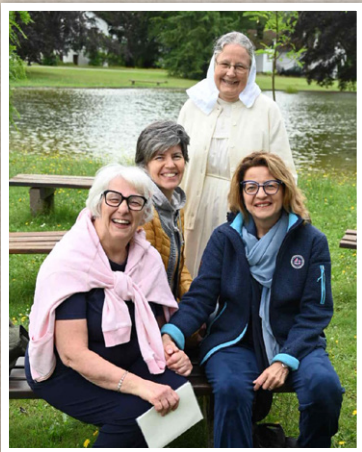
Freunde aus Italien