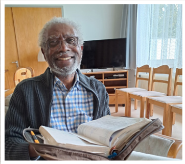
Besuch aus Kamerun