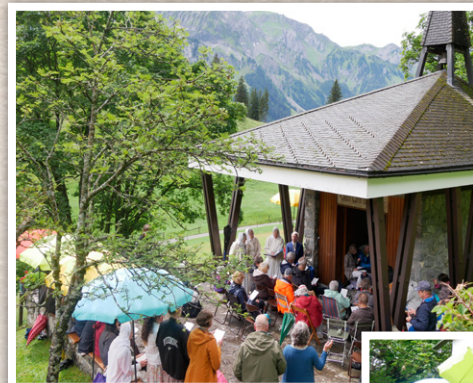
60. Jubiläum Ehre-Gottes-Kapelle