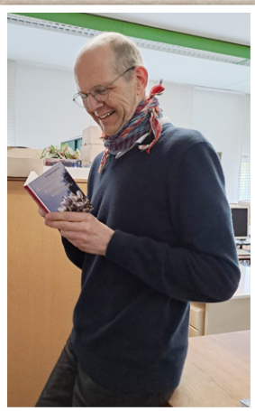
Fachberater und begeisterter Schriftenleser

durch gemeinsamen Einsatz endlich ausreichende Beleuchtung bekommen.