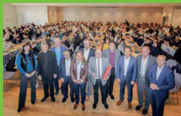
Insgesamt 523 Erstsemestern beginnen zum Wintersemester 2024/25 ein duales Bachelor-Studium bei StudiumPlus, 308 von ihnen am Standort Wetzlar.