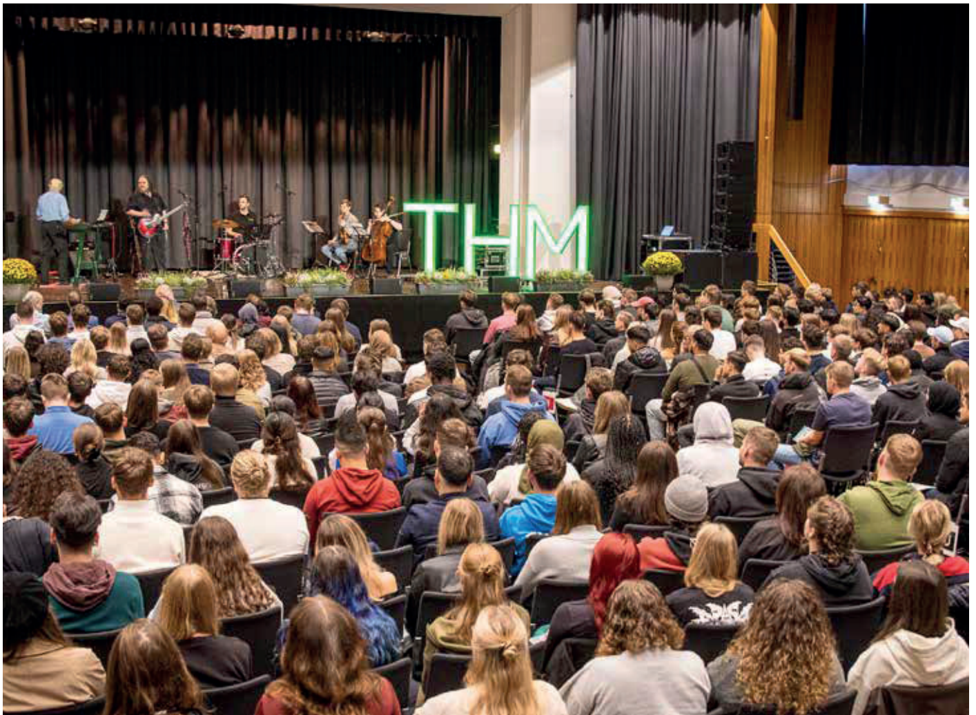
Die THM-Band „Applied Sounds“ setzt in der vollen Gießener Kongresshalle den Auftakt zur Begrüßung der Erstsemester.