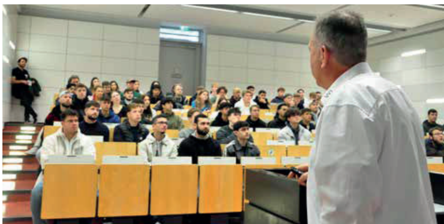
Die Lehrenden begrüßen ihre neuen Studierenden am Campus Friedberg mit kurzen Vorträgen.

Bevor für die Neuen der Studienalltag begann, wurden sie von Fachschaften und AstA mit der Hochschule und den