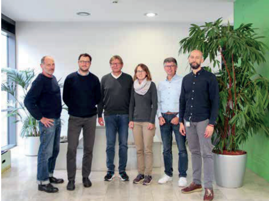
Das Team ECO 2 des Facility Management sieht die Energiewerte der THM als vielversprechend an.

Die THM strebt seit Jahren an, ein CO 2 -neutraler und ressourcenschonender Arbeitgeber zu werden. Der jährliche Energie- und Ressourcenbericht bildet dafür eine wichtige Datengrundlage und dient als Basis für Energiespar- und Umweltschutzmaßnahmen. Er umfasst sowohl die 44 eigenen als auch die 19 angemieteten Gebäude in Gießen und Friedberg. Mit diesen Maßnahmen unterstützt die THM das Ziel der Hessischen Landesregierung, bis 2030 klimaneutral zu arbeiten.