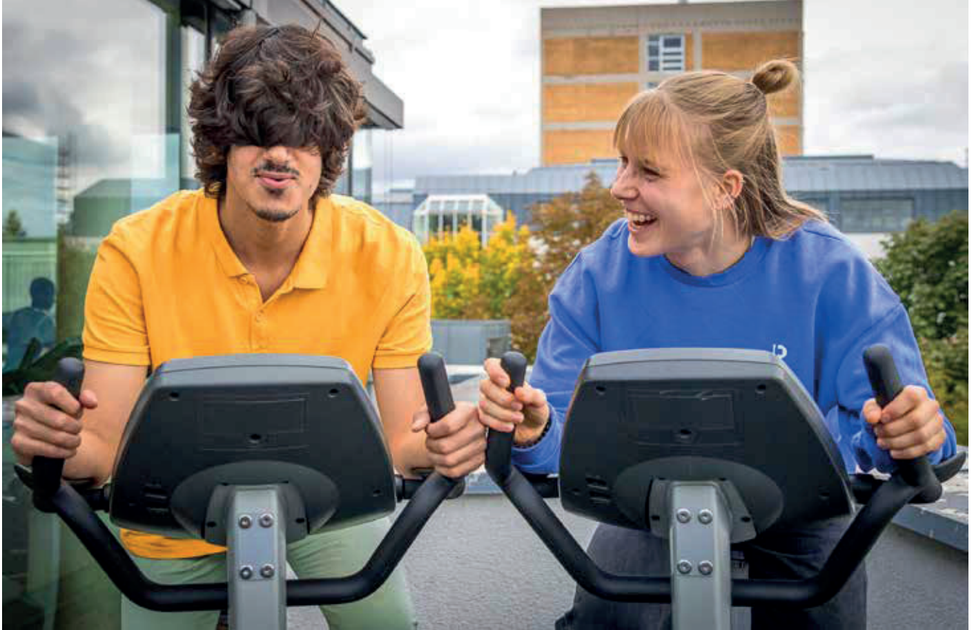
Im Fitnessstudio der THM sollen Menschen mit und ohne Beeinträchtigung gleichermaßen Freude am Sport haben.