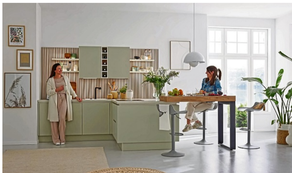
Helle Farben, klare Linien und viel Licht sind typische Merkmale des Scandic Style.

1. Farben und Materialien In einer Küche im Scandic Style dominieren meist helle Farben, zum Beispiel Weiß, sanftes Grau und Pastelltöne. Diese Farbgebung wird ergänzt durch natürliche Materialien wie Holz, das häufig für Arbeitsplatten, Schränke und als Bodenbe-