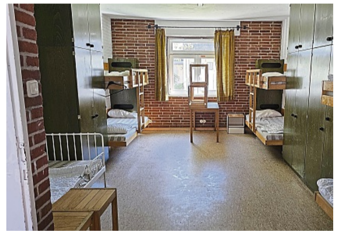
Blick durchs Fenster: Die Schlafräume sehen heute noch so aus, als wären sie gerade erst verlassen worden.

„Aufgrund der Lage des Grundstücks im gesetzlich vorgegebenen Gewässerschutzstreifen nach Landesnaturschutzgesetz und Landeswassergesetz bestehen hinsichtlich der Bebaubarkeit des Grundstücks gewisse Restriktionen“, teilt Mandy Cronaue, stellvertretende Fachbereichsleiterin Stadtplanung, Städtebauförderung der Stadt Fehmarn, auf Nachfrage mit. Diesbezüglich fänden aktuell Ab-