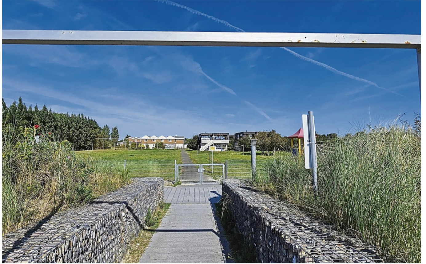
Schön gelegen: Wer vom Strand kommt, blickt direkt auf das Gelände der einstigen Ferienstätte des Landkreises Hersfeld-Rotenburg.

Fehmarn/Hersfeld-Rotenburg – Auf dem Gelände der ehemaligen Ferienstätte des Landkreises Hersfeld-Rotenburg in Meeschendorf, am Südstrand von Burg, ist weiterhin nichts los. Es pfeift nur der Wind um die maroden Gebäude. Das Gelände verwahrlost seit Ende des Jahres 2019 zusehends. Immer mehr verwandelt sich dieses einstige Urlaubsparadies vieler Menschen aus der Region in einen tristen Schandfleck. An die vielen Sommerurlauber längst vergangener Tage aus dem Landkreis erinnern nur noch die mit