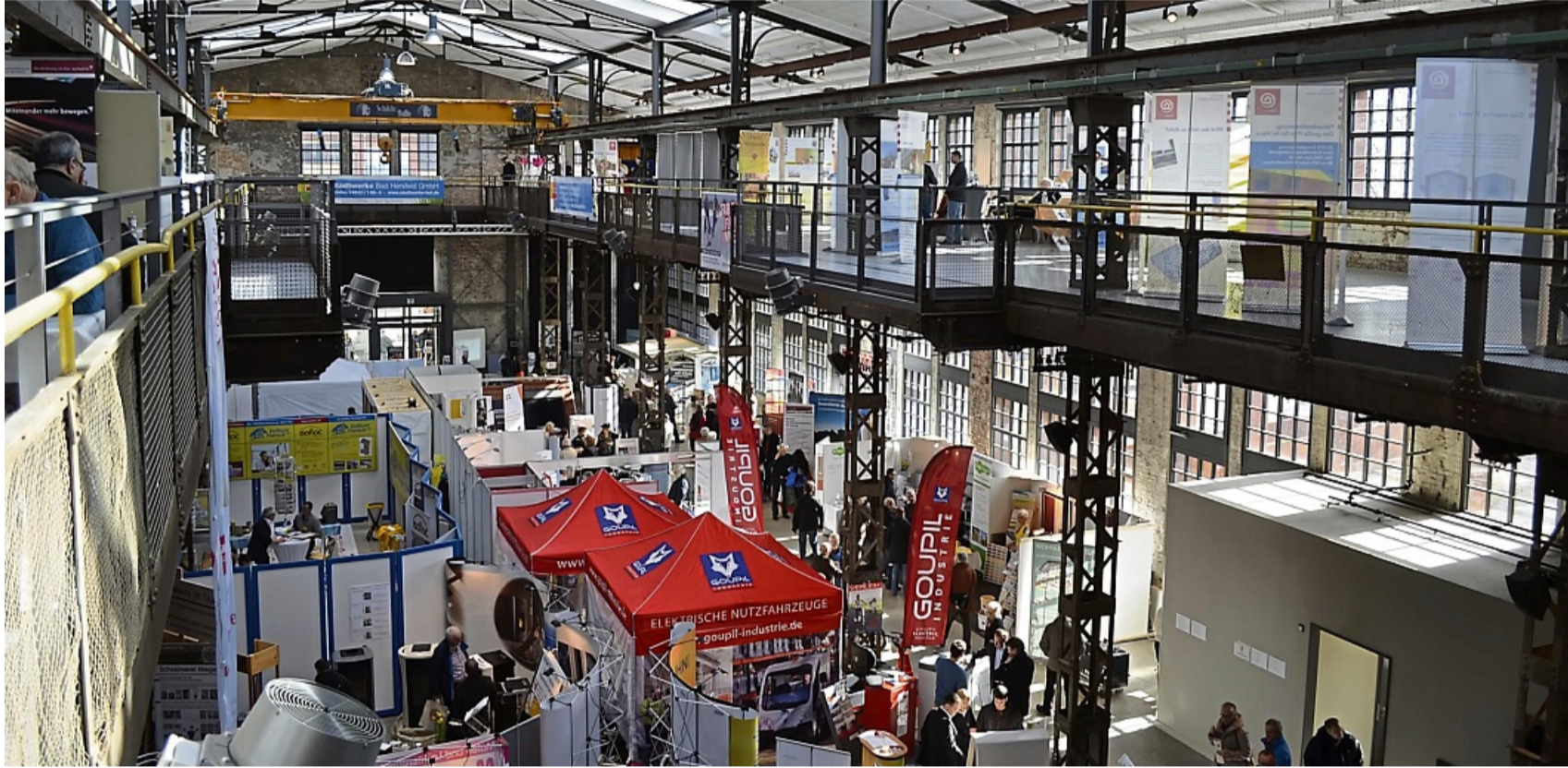
Energietage Bad Hersfeld: Die Messe findet im März 2025 in der Schilde-Halle in Bad Hersfeld statt.

6. Energie- und Klimatage im März in der Schilde-Halle