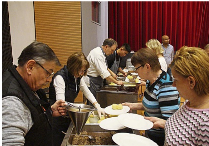
Viele Helfer fassten bei der Essensausgabe bei der Feier „Das besondere Weihnachten“ in der Stadthalle mit an.