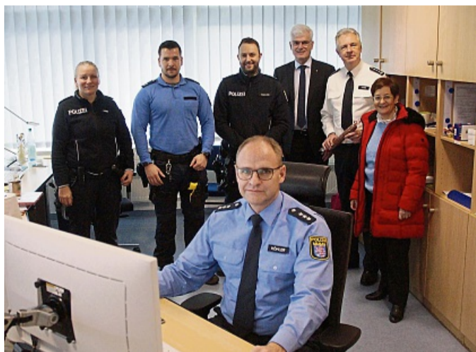
Sorgte an den Feiertagen für Sicherheit: Das Team der Polizeistation Bad Hersfeld.

RÄUMUNGS-VERKAUF WEGEN GESCHÄFTS-AUFGABE