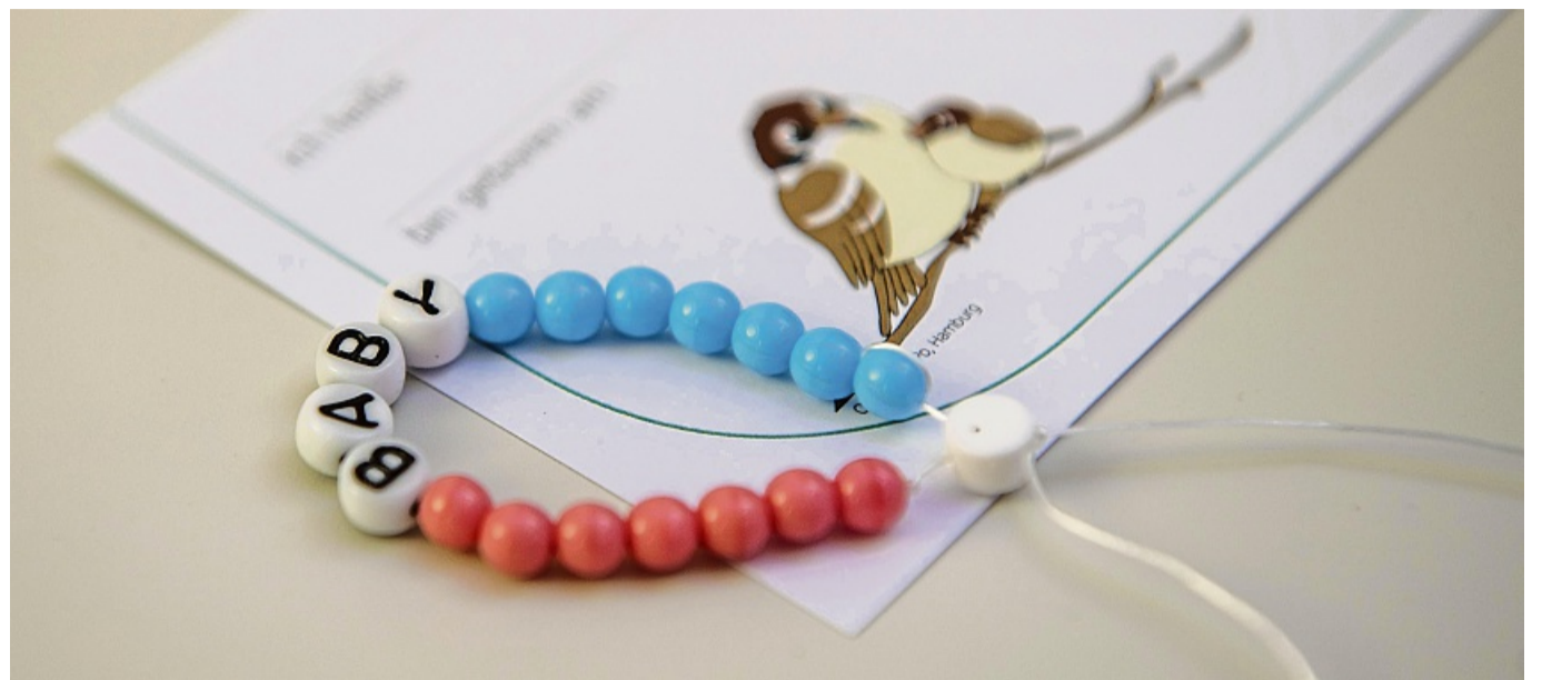
Offt gar nicht so einfach: Die Frage, welchen Namen das Kind für den Rest seines Lebens tragen soll, treibt viele werdende Eltern um.

Ein Vorname kann noch so schön sein, wenn er in der