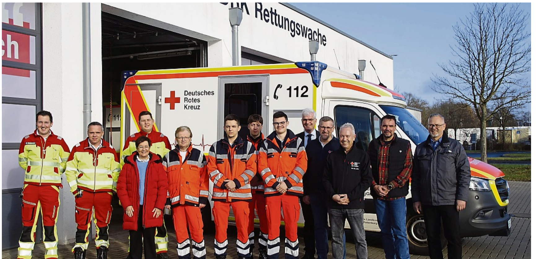
Auch an Heiligabend bereit zum Ausrücken: Die Besetzung der Rettungswache des Roten Kreuzes am Bad Hersfelder Europakreisel.

An einer der nächsten Stationen, der DRK-Rettungswache am Europakreisel, sind grade alle Fahrzeuge im Depot, zu diesem Zeitpunkt jedenfalls