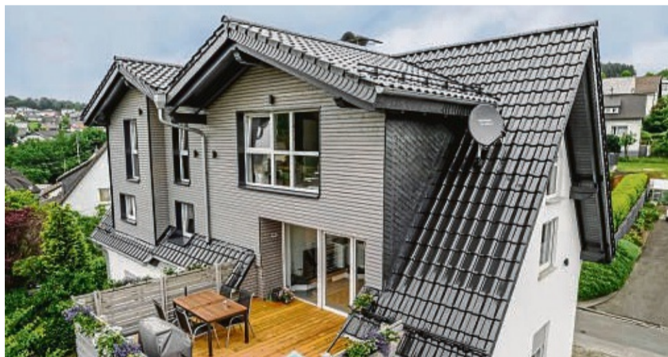
Das Eigenheim ist für viele Menschen Lebensmittelpunkt und wertvollster Besitz. Es sollte daher für die zunehmende Zahl von Unwetterereignissen gut gerüstet sein.

Es lohnt sich aber, den bestehenden Versicherungsschutz unter die Lupe zu nehmen und zu prüfen, ob er dem aktuellen Risikoprofil des Hauses und den eigenen Sicherungsansprüchen noch genügt.