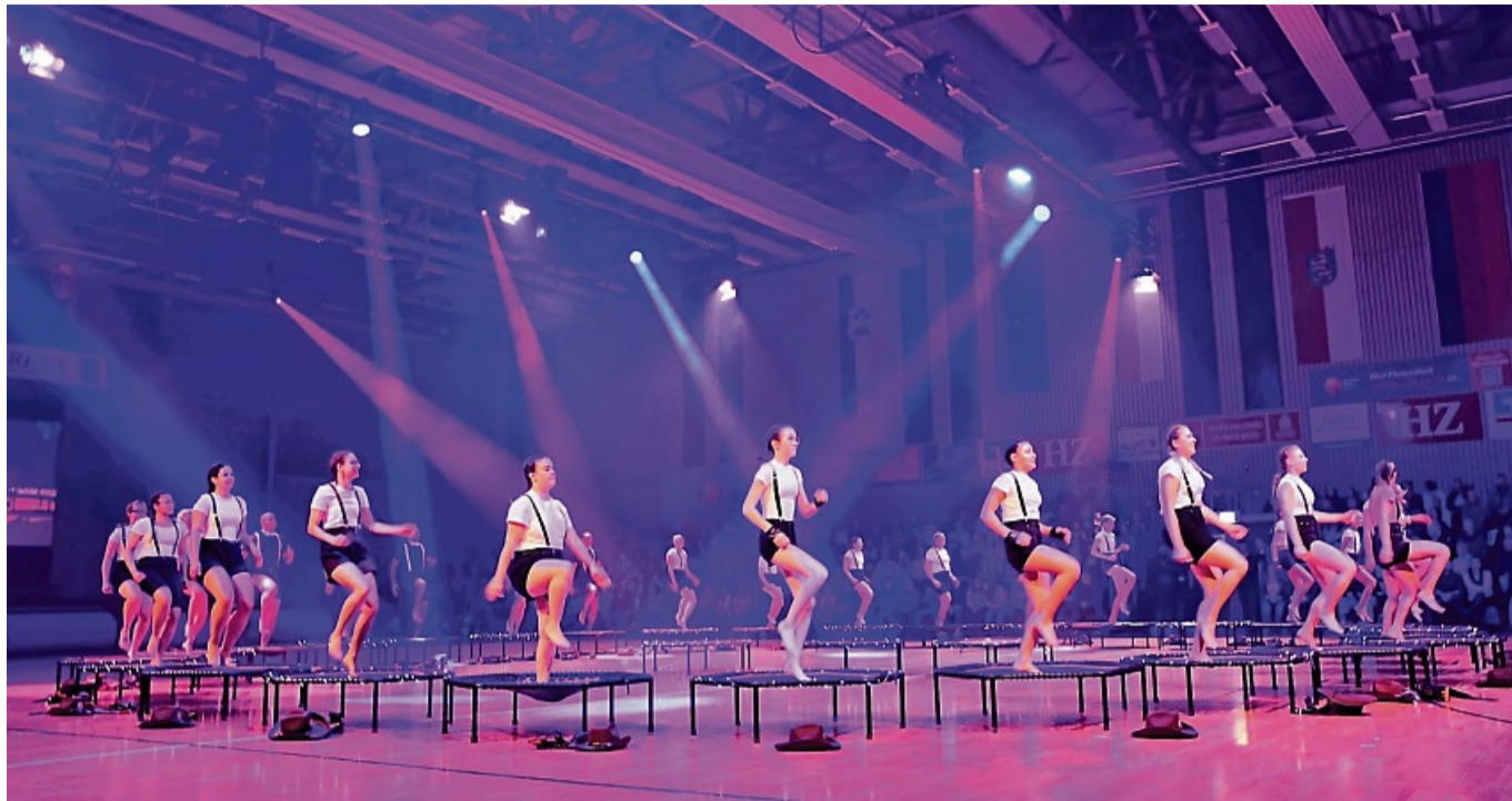
Die „Jumping Fitness C.C. Sports/TV Hersfeld“ standen mit ihrer energiegeladenen Vorführung auf den Trampolinen.