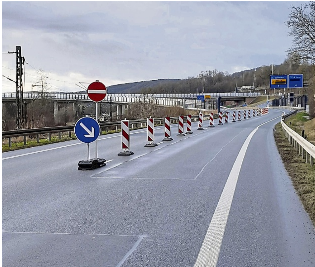
Soll Autofahren den richtigen Weg deutlicher zeigen: Auf einer Länge von 100 Metern wurde jetzt die Fahrbahnmarkierung vor der A44-Auffahrt am Trimberrgtunnel verlängert. Täglich gab es auf der Strecke Meldungen über Geisterfahrer.

Zu Beginn des Jahres hatten sich die zuständige Autobahnpolizei, Autobahnmeisterei und Hessen Mobil vor Ort getroffen. „Ziel war es, die Situation vor Ort wegen etwaiger Falschfahrer zu verbessern, noch stärker abzusichern und