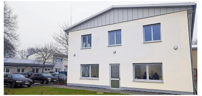
Das Berufsbildungsgebäude in Bebra ist innen und außen in hellen Farben gehalten.