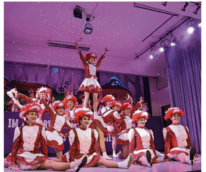
Akrobatik beim Karneval in Sorga.

Den Abschluss in Sorga bildet der Kinderfasching am Sonntag, 2. März. Karten – für die Erwachsenen und Jugendliche ab 14 Jahren – gibt es hier an der Tageskasse für 6 Euro. Einlass ist ab 14 Uhr. An allen Veranstaltungen wird das Team von TMP-Sounds vor, während und nach dem Programm für Stimmung sorgen. red/dag