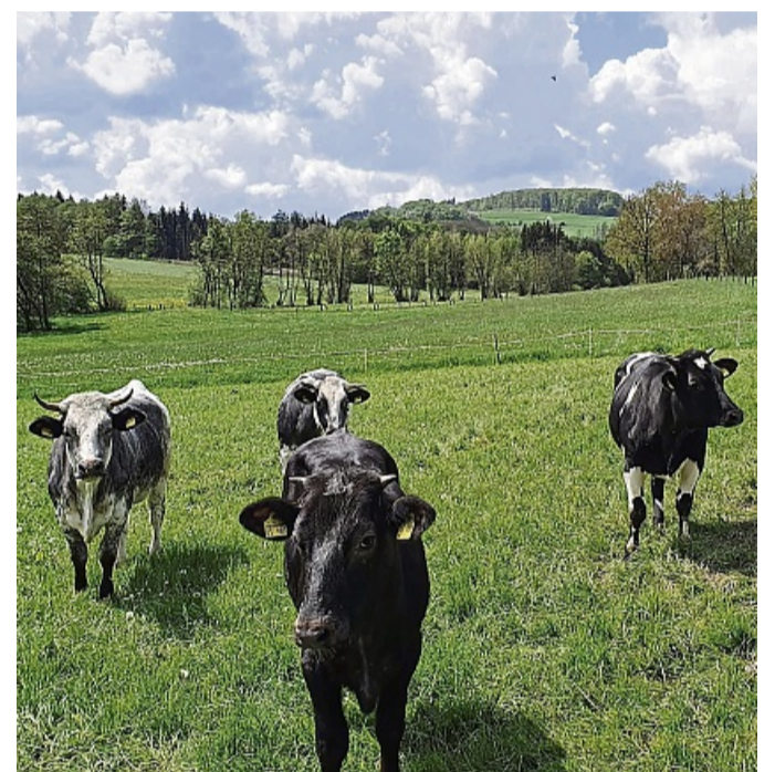
Der Verein zur Regionalentwicklung im Knüllgebiet lädt zu einem Austausch zum Thema Weidehaltung im Knüll ein.