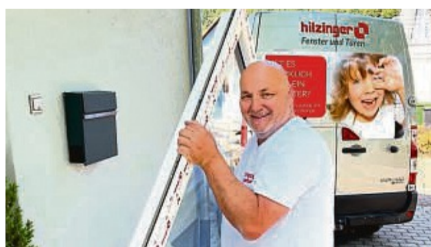
Fenster sanieren mit hilzinger.

Die Firma hilzinger setzt auch 2025 ihre Vortragsreihe zum Thema Fenstersanierung fort und lädt interessierte Haus- und Wohnungseigentümer am Samstag, 1. Februar, zu einem Online Live-Vortrag „Fenster und Türen“ um 11 Uhr ein. Für den Fensterläden verständlich werden das Bauteil Fenster und die Fenstersanierung unter die Lupe genommen.