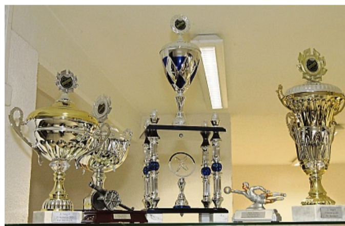
Der Reserve-Cup: Der TSV Ransbach sammelt bei diesem Turnier Spenden für die „Kleinen Helden“.

In enger Kooperation mit Palliativmedizinern und Pflegediensten bietet der Verein psychosoziale Begleitung in ganz Osthessen an. Aufgrund der immer wieder an sie herangetra-