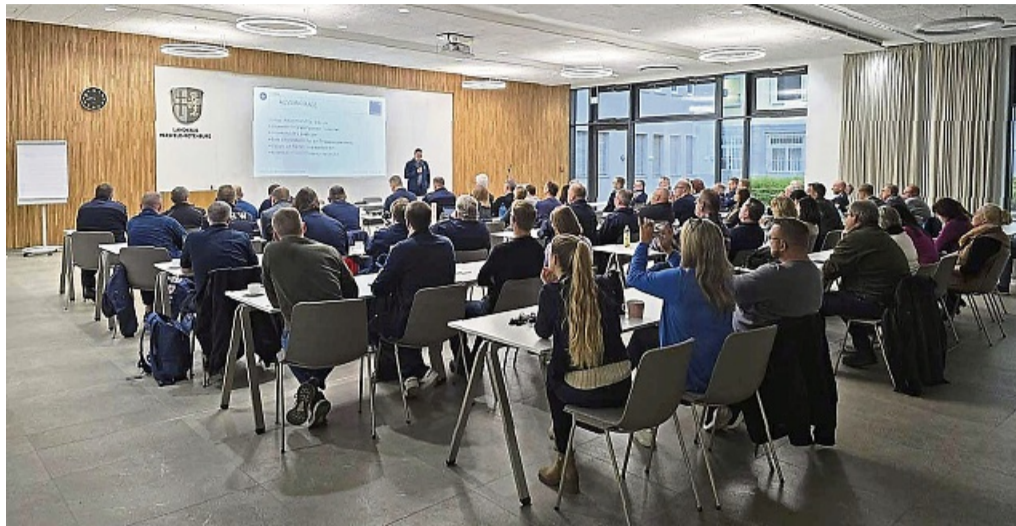
Im Kreistagssitzungssaal des Landratsamts erhielten rund 100 Teilnehmende eine detaillierte Einführung in die Ausgangslage der Krisenübung zum Szenario einer Hitzewelle.

Bad Hersfeld – Eine umfangreiche Übung zur Krisenbewältigung fand kürzlich laut Pressemitteilung im Landratsamt Hersfeld-Rotenburg statt. Das Szenario: Eine langanhaltende Hitzewelle mit zunehmender Trockenheit und ihren vielschichtigen Problemen, wie Knappheit von Trinkwasser oder Waldbrände stellte die rund 100 Beteiligten aus Verwaltung, Feuerwehr und Bevölkerungsschutz während der Übung vor eine große Aufgabe. Ziel war es, den Umgang mit Krisen in der Kreisverwaltung zu testen und weiter zu optimieren. Geübt wurde im Zweischicht-System. Das spiegelte die dynamischen Anforderungen eines mehrtägigen Krisenereignisses wider.