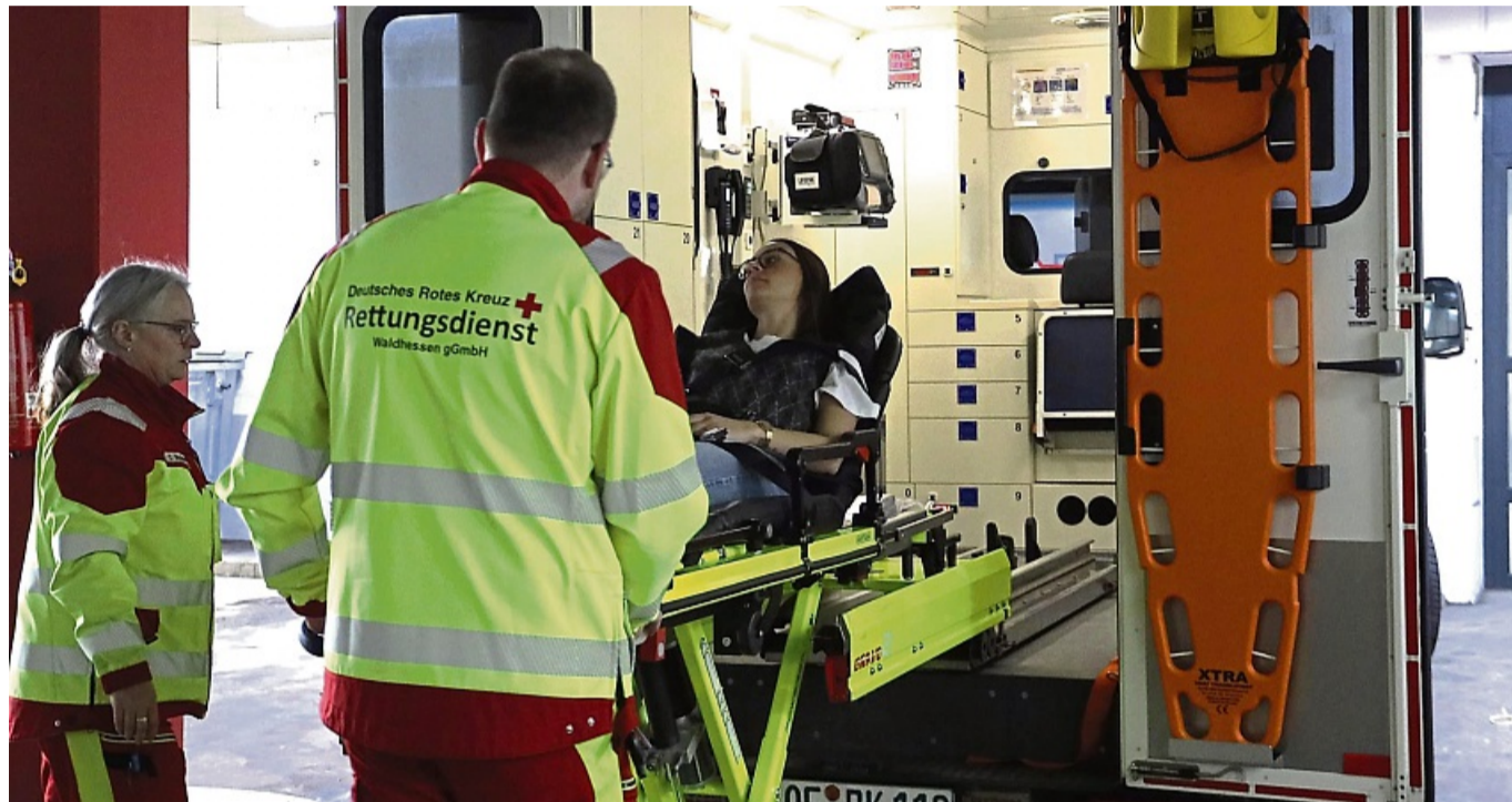
Auch am Klinikum Bad Hersfeld stieg die Zahl der Notaufnahmen im Laufe der letzten Jahre an.