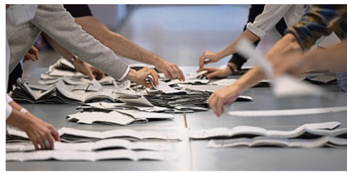
Der Kreiswahlausschuss hat über die Zulassung der Kandidaten im Wahlkreis zur Bundestagswahl entschieden.