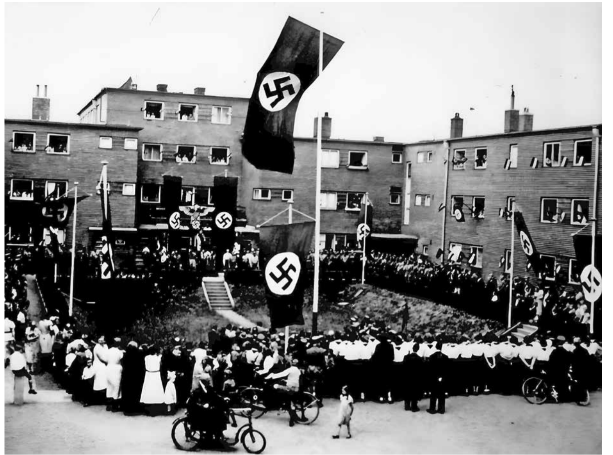
Einweihung der NSDAP-Geschäftsstelle „Am Alten Gerauer Weg“ am 6. Juni 1934.