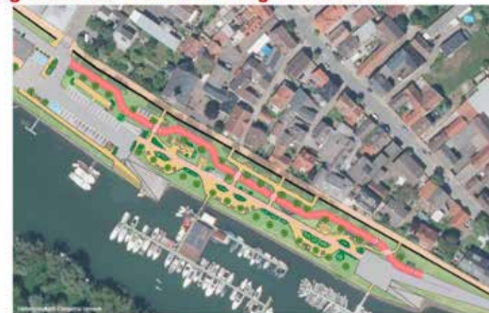
Diese Vorzugsvariante wurde von der Hochschule Darmstadt bei der Bürgerversammlung im November 2024 vorgestellt.

den Spaziergängern bevorzugt wird. Zur Ausbremsung der Rennradfahrer sollte zeitnah der Damm oberhalb des Bausens als Spielstraße ausgewiesen werden. Damit könnte der vier Meter breite Radweg im Bereich der Grünzone vermieden werden. Schnell umsetzbar sind die Senkrechtparkplätze unterhalb der Kirche. Dadurch werden weitere elf Abstellmöglichkeiten geschaffen. „Wir hoffen, dass das Altrheinufer als naturnaher Bereich weiterentwickelt wird. Wir sehen es kritisch – nicht