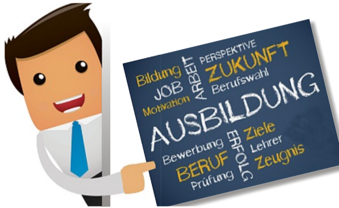
Hubi von azubi.komm.