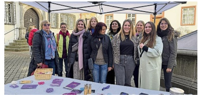
Am Infostand vor dem Lullusbrunnen informierten sich viele Frauen über die Frauenberatungsstelle in Bad Hersfeld.

Einen Tag nach dem Equal Pay Day haben Frauen und einige Männer in der Bad Hersfelder Innenstadt für den Vollzug der Gleichberechtigung demonstriert. Mehr Fotos unter hersfelder-zeitung.de