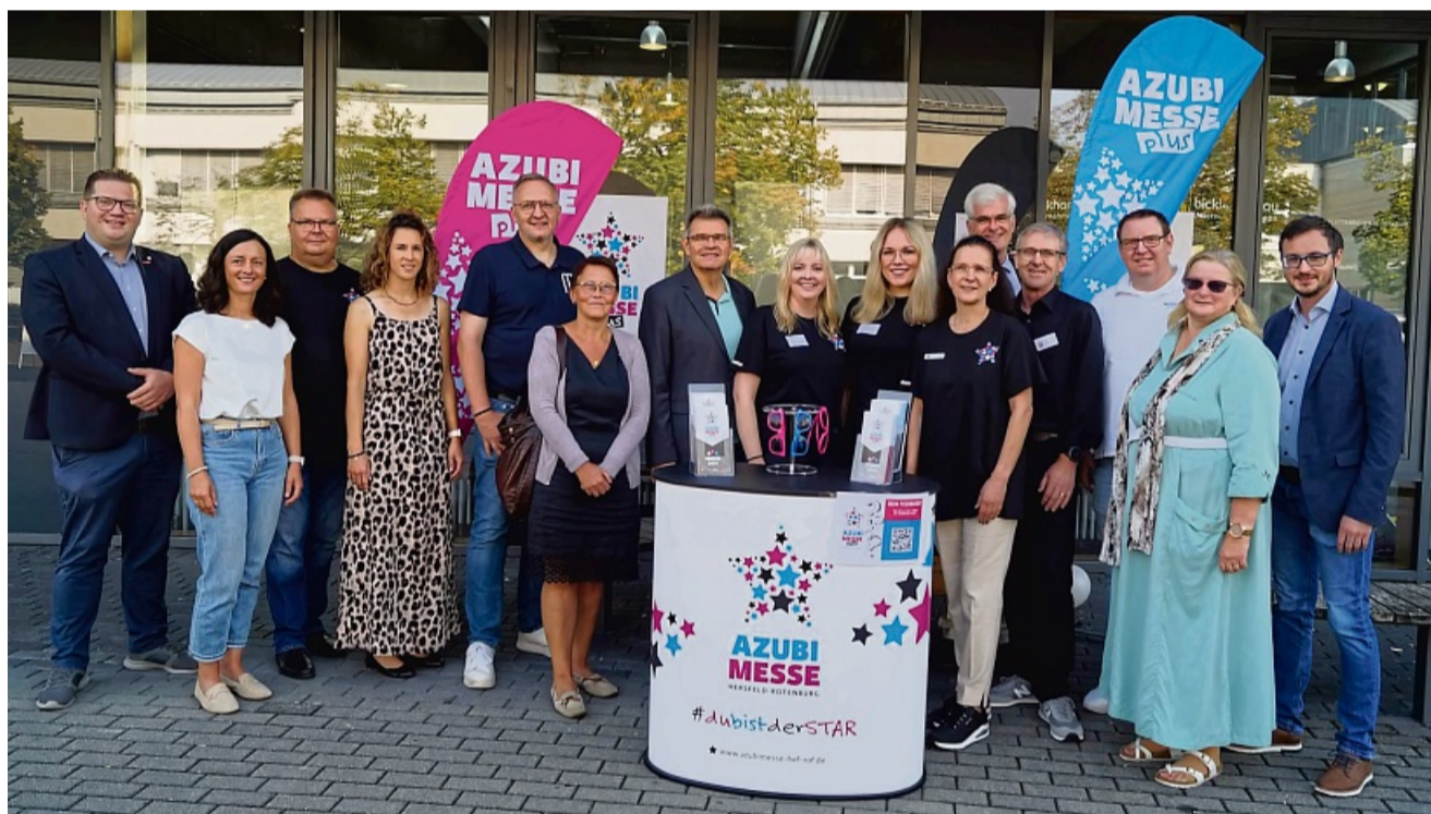
Die Kooperationspartner und Organisatoren von 2024 freuen sich auch 2025 auf eine gut besuchte Messe.