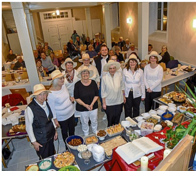
Weltweit verbunden: Wie vielerorts im Landkreis wurde auch im Kirchspiel Alheim-Braach – hier in Niederellenbach – der Weltgebetstag der Frauen gefeiert.