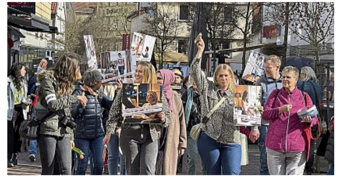
Die Frauen zogen als Demonstrationszug durch die Bad Hersfelder Innenstadt.