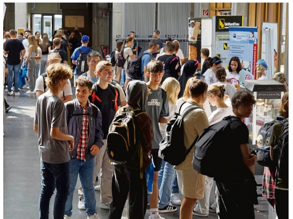
Um die Zeit möglichst ideal zu nutzen, sollten sich die Besucher schon vorab überlegen, welche Stände besucht und welche Fragen gestellt werden.