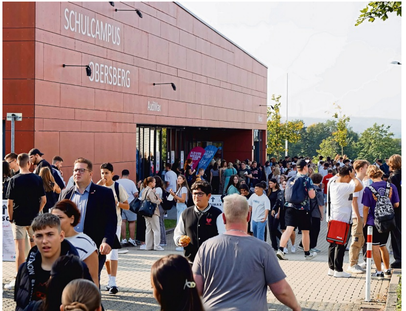
Die AzubiMesse Plus 2025 Hersfeld-Rotenburg stößt regelmäßig auf großes Interesse.

Auch in diesem Jahr hat sich das Orga-Team wieder einige Besonderheiten einfallen lassen. Am Donnerstag wird während der gesamten Dauer der Messe im