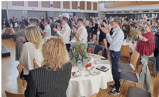
Viel Applaus zum Abschied: Die Besucher des letzten Kaffeeklatsches spendeten am Ende stehend Beifall.