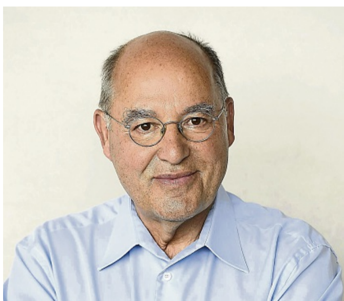
Ein Politprofi: Gregor Gysi tritt in der Bad Hersfelder Stadthalle auf.