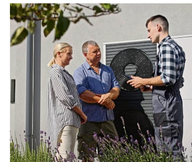
Rund 70 Prozent der Wohngebäude in Deutschland eignen sich ohne größere Umbauten für eine Wärmepumpe.

Eine Wärmepumpe lässt sich also auch ohne Fußbodenheizung oder neue Fenster wirtschaftlich betreiben. Vor allem Eigenheim, die ab den 1990er-Jah-