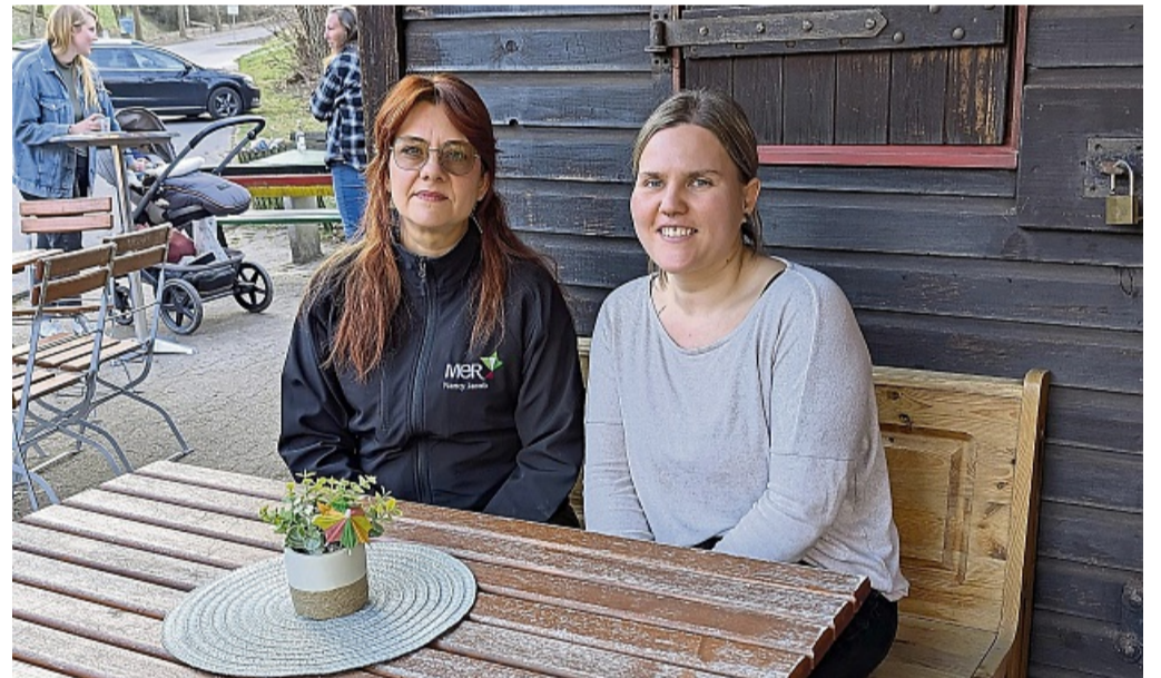
Ein Osterfest mit Flohmarkt wird am 17. April am Spielplatz Wildgehege stattfinden, im dazugehörigen Café werden die Besucher versorgt.