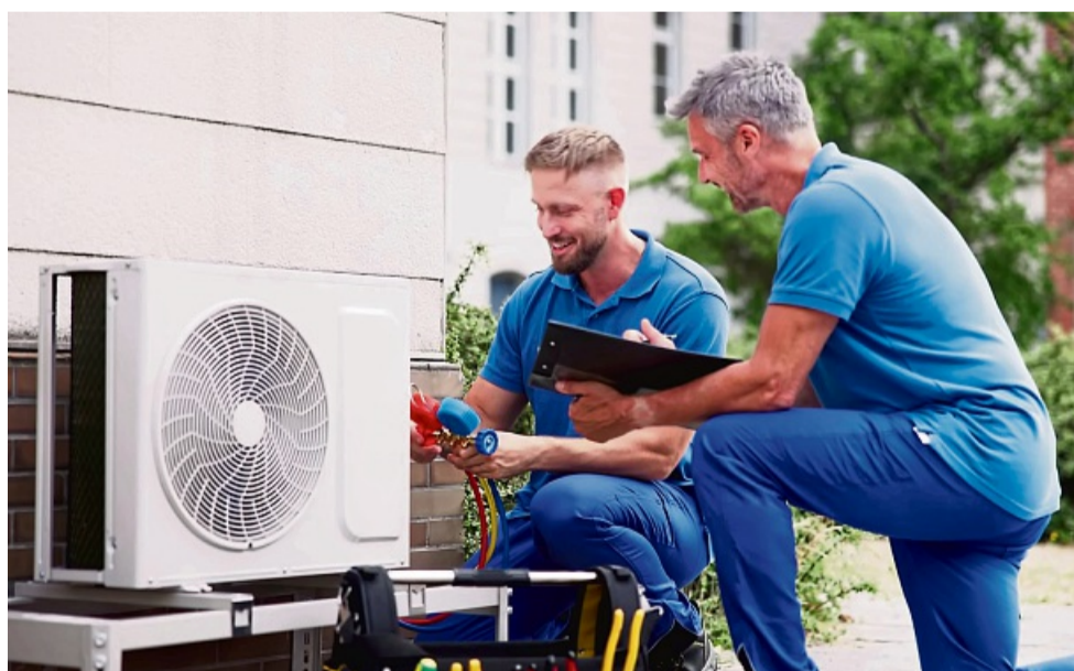
Beim Umstieg auf eine Wärmepumpe profitieren Hausbesitzer aktuell von attraktiven Förderbedingungen.