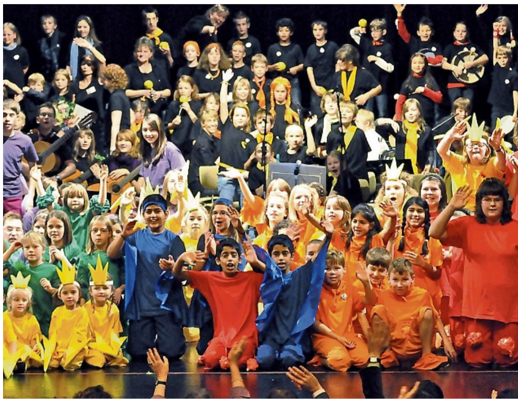
Jollydent-Projekt Farbula: Das musikalische Theaterprojekt hat über 230 Kinder aus unterschiedlichen sozialen, kulturellen und geografischen Hintergründen sowie mit und ohne Behinderung zusammengeführt.