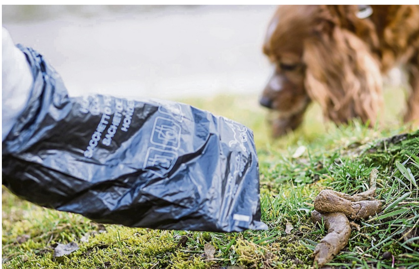
Hundehaufen auf Wiesen und Gehwegen sorgen auch im Kreis Hersfeld-Rotenburg immer wieder für Ärger.