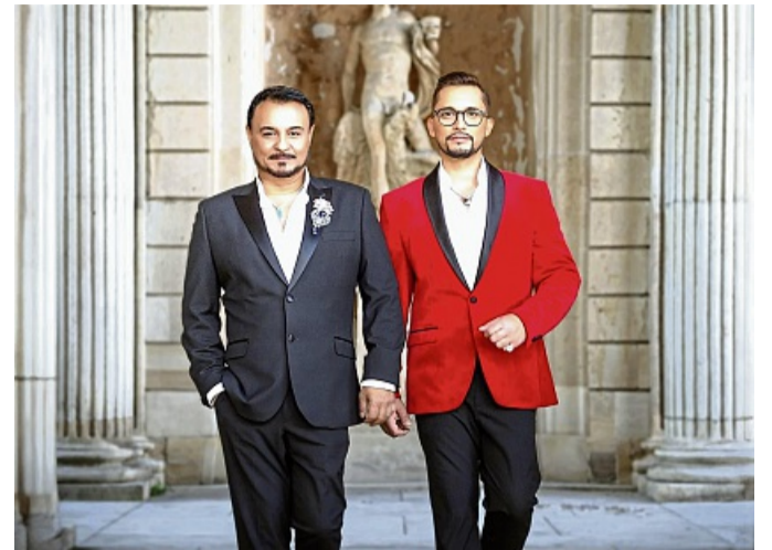
Die „Tenöre4you“ sind im März in der Kirche im Niederaulaer Ortsteil Hattenbach zu Gast.

Weitere Informationen gibt es unter der Telefonnummer 02 21/39 76 03 77. red/cdg