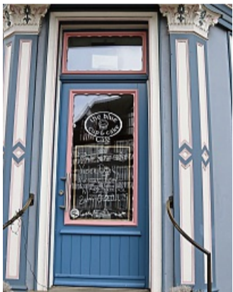
Hat seit Anfang März geschlossen: das Blue-Cup-&-Cake-Café in der Rotenburger Innenstadt.

Trotz mehrfacher Versuche unserer Zeitung war die Inhaberin nach Schließung des Cafés nicht zu erreichen. zvk