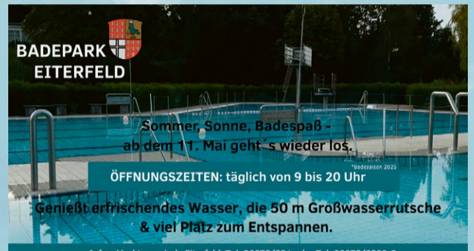
Infos: Marktgemeinde Eiterfeld, Tel. 06672/231 oder Tel. 06672/9299-0