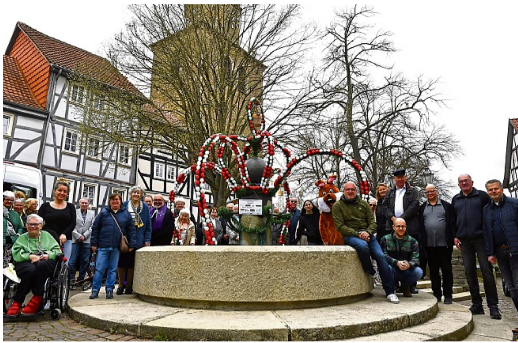
Macht was her auf dem Lindenplatz vor der Auferstehungskirche: der geschmückte und frisch eingeweihte Osterbrunnen.