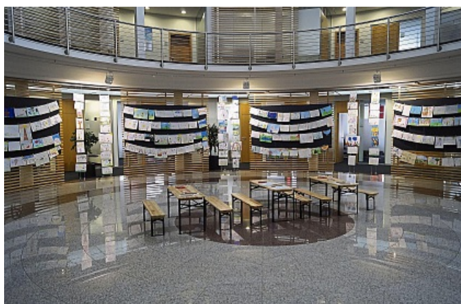
Zahlreiche KNAX-Klub-Mitglieder folgten dem Aufruf und sendeten ihre Bilder und mehr ein.