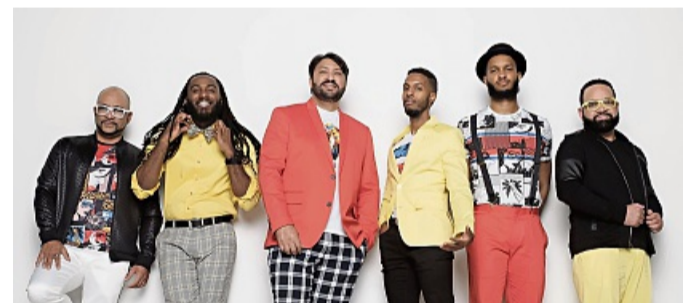
Aus Florida nach Heringen: Die A-Capella-Vocal-Band Undivided tritt am 29. April in der Stadtkirche auf.

Heringen – Die A-Capella-Vocal-Band Undivided aus Florida tritt am Dienstag, 29. April, in der Stadtkirche nach Heringen auf. Das Konzert beginnt um 20 Uhr. In USA hat die Band laut Pressemitteilung viele Fans und Freunde. Jetzt kommen die sechs Männer mit ihren A-Capella-Songs und ihrer fröhlichen Message nach Europa mit dem Ziel, die Herzen der Konzertbesucher zu erobern. Undivided blickt auf eine zwölfjährige musikalische Karriere mit fünf Alben (zwei in Englisch und drei in Spanisch), eine Latin-Grammy-Nominierung, zwei Auszeichnungen mit dem Cara-Award, eine Auszeichnung mit dem Arpa-Award für das beste Vocal-Album in 2011 und Tausenden von Plattenverkäufen weltweit zurück.