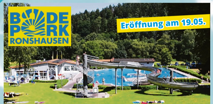
BadePark Ronshausen, Am Sportplatz, 36217 Ronshausen