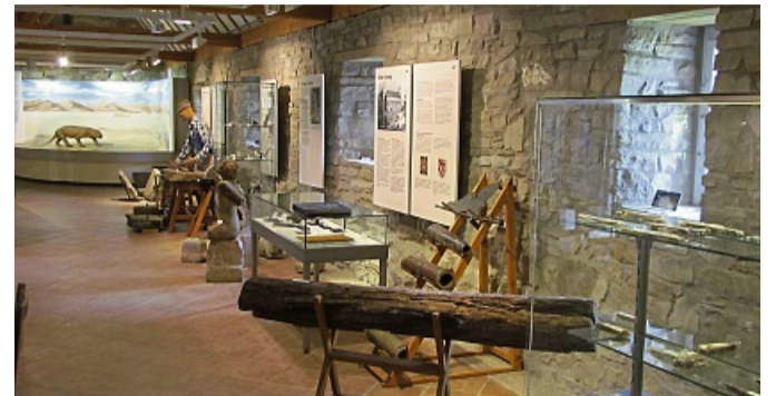
Teilansicht im Sandsteinmuseum mit Saurier-Diorama.