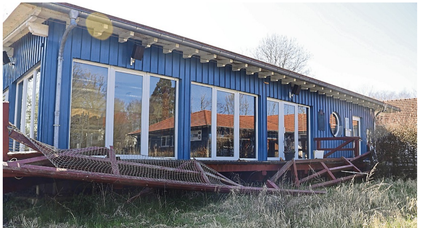
Am Bootshaus in Bad Hersfeld wurde das Geländer durch Unbekannte zerstört.

Hotelier Achim Kniese übernahm 2011 die Pacht des Bootshauses und eröffnete es unter dem Namen „Pier 1“ neu. Kniese plante bis zu 20 Mitarbeiterinnen und Mitarbeiter für die Hochsaison ein. Vom Club- und Kneipencharakter wollte man etwas abkommen und es wur-