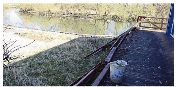
Die komplette Terrasse am Bootshaus soll laut Inhaber neu gemacht werden.

Doch lange soll das Bootshaus nicht mehr leerstehen. Wie Sami Erdinc, dem das Gelände inklusive Immobilie seit rund acht Jahren gehört, verriet, gebe es einen neuen Pachtinteressenten aus der näheren Umgebung, der bereits im Sommer dort wieder ein Restaurant eröffnen wolle. Doch so lange noch keine Verträge unterschrieben sind, könne er noch nichts Weiteres sagen. cdg