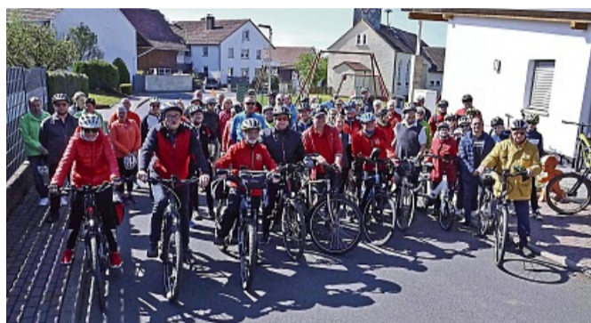
Anradeln in der Kuppenrhön: Das Peloton beim Start zur 23-Kilometer Rundtour durch die Kuppenrhön vor der Kirche am Hugenottenplatz in Gethsemane.

In Schenksolz erwarteten die Gastgeber von der „Gezemicher“ Dorfgemeinschaft das Peloton mit Getränken. Weiter