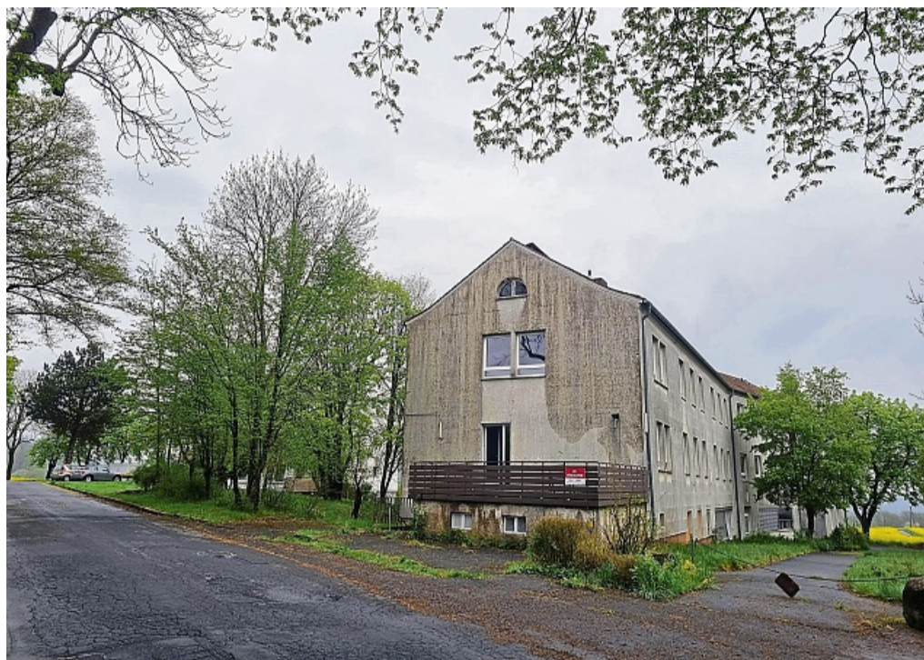
Steht seit einigen Jahren leer: Das ehemalige Jugendwohnheim am Wehneberg der Stiftung Hessisches Waisenhaus zu Kassel 1690. Jetzt darf dort die Feuerwehr üben.

Die Feuerwehr ist laut Ruppel immer auf der Suche nach geeigneten Objekten zum Trainieren, die natürlich gar nicht so einfach zu finden seien. Im