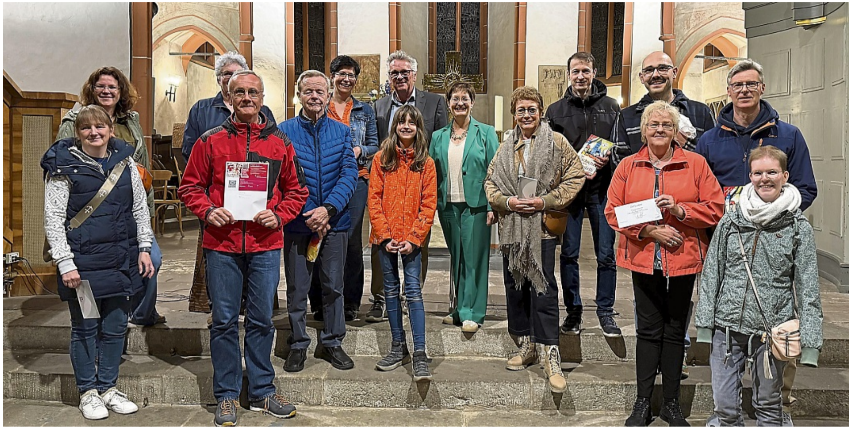
Bei der nächtlichen Abschlussveranstaltung: Die Gewinnerinnen und Gewinner der Museums- und Erlebnisnacht.

Großer Beliebtheit erfreuten sich die verschiedenen Stadtführungen. In der Dunkelheit