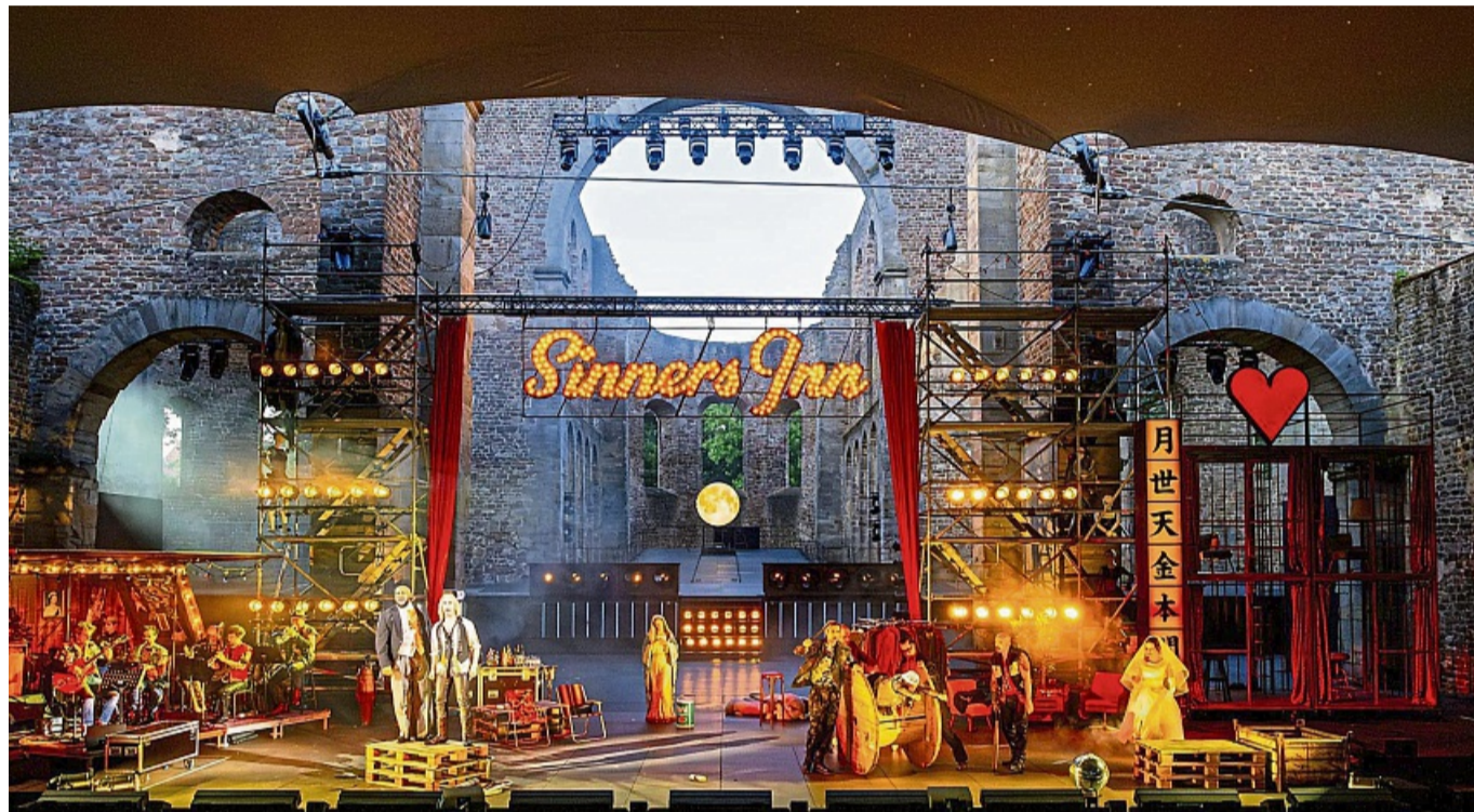
Die künftige Festspiel-Intendantin Elke Hesse plant tiefgreifende Veränderungen bei den Bad Hersfelder Festspielen. Unser Foto zeigt das „Die Dreigroschenoper“ aus dem vergangenen Jahr. FOTO: STEFFEN SENNEWALD