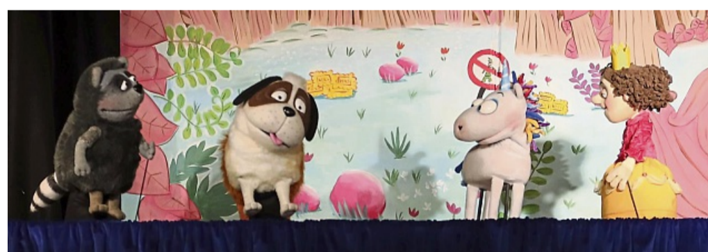
Die Eröffnung der Kleinen Festspiele mit „Das Neinhorn und die Schlangeweile“.

Bad Hersfeld – Mehr als 1000 Zuschauerinnen und Zuschauer – überwiegend Kinder und Jugendliche – haben die diesjährigen Kleinen Festspiele besucht. Vier verschiedene Theaterstücke mit teilweise zwei Vorstellungen und ein Musicalabend haben die Gäste jeden Alters ins Buchcafé gelockt. Bereits zum 22. Mal ist die Kinder- und Jugendtheater-Woche vom Fachbereich Generationen der Stadtverwaltung organisiert worden.