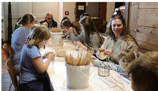
Eifrige Bastler: Im Stadtmuseum wurden von den Besuchern Körbe geflochten.