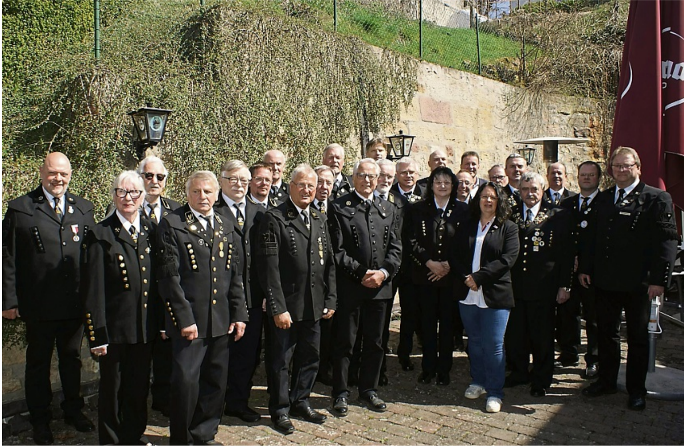
Tagten in Neuhof: Die Teilnehmer der Landesdelegiertenversammlung des Hessischen Landesverbandes der Bergmanns-, Hütten- und Knappenvereine.

Deshalb habe der geschäftsführende Vorstand namhafte Persönlichkeiten für den neu-