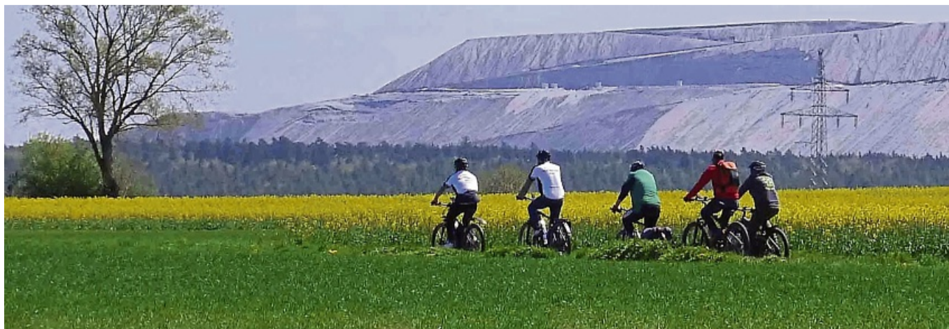
Radeln im Rapsfeld: Im Hintergrund präsentiert sich der Monte Kali.

In Friedewald gab es die erste Pause für das teils elektromotorisierte und teils traditionell strampelnde Peloton, das sich schnell weit auseinandergezogen hatte. Mittendrin als wohl