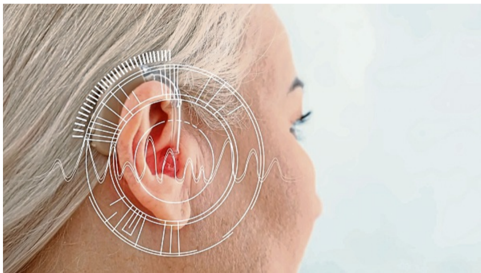
Schluss mit schlecht verständlichen Dialogen: Moderne Technik sorgt für einen guten Ton und bringt so den Spaß am Fernsehen zurück.

Die Gründe dafür, dass viele Menschen ihren TV nicht mehr verstehen, sind vielschichtig. Neben eigenen Einschränkungen der Hörfähigkeit spielt dabei die Technik eine wesentliche Rolle. Denn das moderne TV-Design wird immer flacher. Dadurch ist auch der Platz für leistungsstarke Lautsprecher immer knapper bemessen – die akustische Qualität leidet. Hinzu kommt, dass der Ton bei Spielfilmen für große