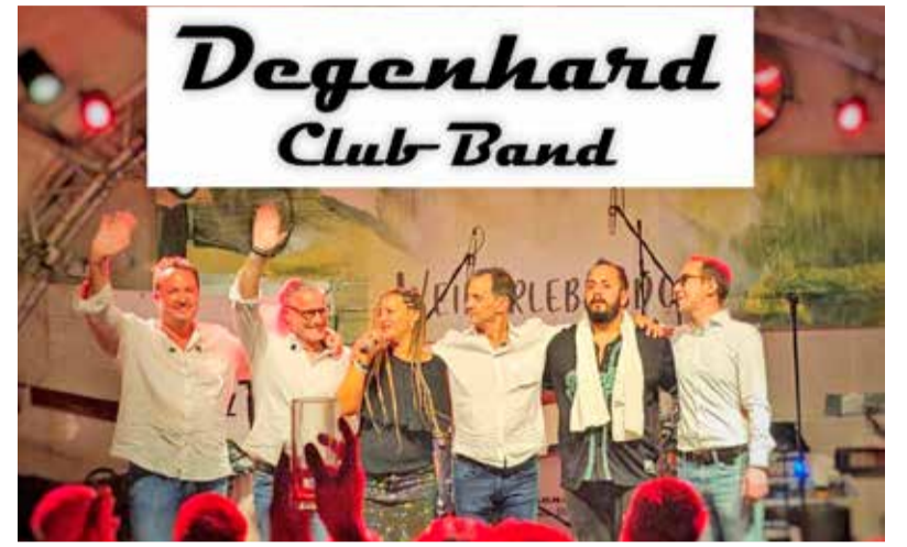
Degenhard Club Band