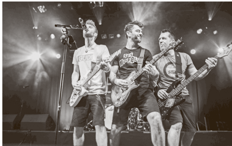
Alex im Westerland – Die Toten Hosen/Die Ärzte Tribute

An Pfingsten (05. bis 09. Juni) laden die Gustavsburger Vereine zum Burgfest auf der Ochsenwiese ein. Ein großer Rummelplatz, ein kreativer Künstlermarkt und ausgelassene Partystimmung machen das beliebte Heimatfest aus. Der Sport- und Kulturbund Gustavsburg – kurz: SKB – setzt dabei auf facettenreiche Livemusik. Ihr Wunsch: „Ein friedliches, sicheres Burgfest, bestes Wetter, viele glückliche Gesichter – und das Gefühl, dass sich die viele Arbeit gelohnt hat.“ Mehr über weitere Bands des Burgfests 2025 erfahrt ihr in der nächsten Ausgabe von Neues aus der Mainspitze.