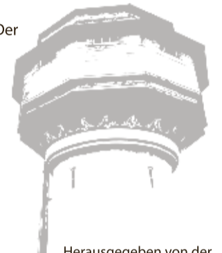
Herausgegeben von der Gemeinde Bischofsheim