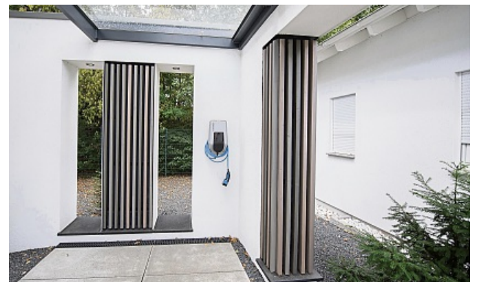
E-Mobilität im Eigenheim: Die Ladeinfrastruktur lässt sich am besten gleich beim Bau integrieren.

Wer ein neues Einfamilienhaus plant, sollte auch an eine mögliche Ladestation für ein E-Auto denken. Dazu rät der Verband Privater Bauherren (VPB). Denn eine Nachrüstung ist zwar grundsätzlich möglich – aber in der Regel deutlich teurer. Wer also bereits beim Bau einen geeigneten Elektroanschluss in Garage oder Carport verlegen lässt, ist später flexibler – unabhängig davon, wann ein Elektroauto angeschafft wird. Eine Photovoltaikanlage auf dem Dach ist dabei eine nahegelegene Ergänzung: Sie kann helfen, das E-Auto mit selbst erzeugtem Strom zu laden. „Wer die Anlage (inklusive Auto) bidirektional auslegt, kann mit der Autobatterie auch sein Haus mit Strom versorgen. Und in Zukunft womöglich helfen, sektorübergreifend ein Stromnetz zu stabilisieren, in dem eine Vielzahl von Autobatterien auch als nennenswerter Stromspeicher fungieren“, so der Verband. Wichtig bei der Auswahl des Modells sei daher vor allem auch die Zukunftsoffenheit. Auch wenn Förderprogramme für private Ladestationen mittlerweile weniger geworden sind, gibt es vereinzelt noch Unterstützungsangebote, die man im Blick behalten sollte, rät der VPB. Hilfestellung bei der Planung der Ladestation bieten unabhängige Bauherrenberaterinnen und -berater.