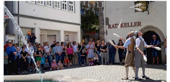
Zum verkaufsoffenen Sonntag wird es chaotisch-witziges Theater in der Innenstadt geben.

Bad Hersfeld feiert die Festspiele & die Geschäfte machen mit