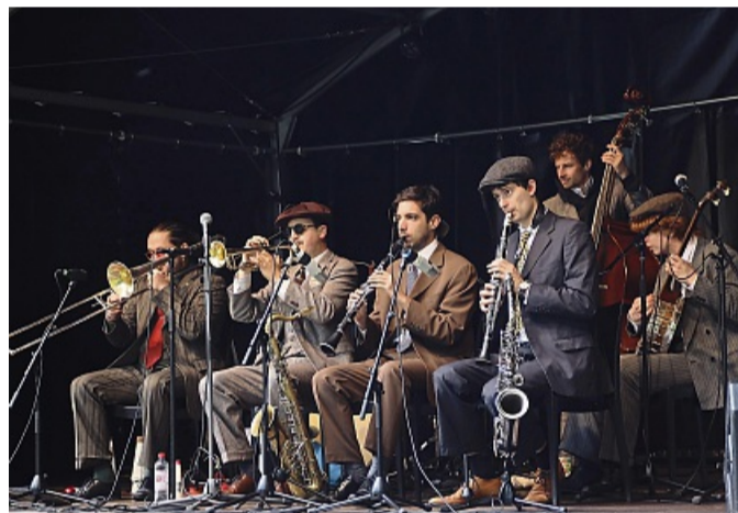
Dixie und Swing: „The Fried Seven“ traten im Style der Golden Twenties auf.