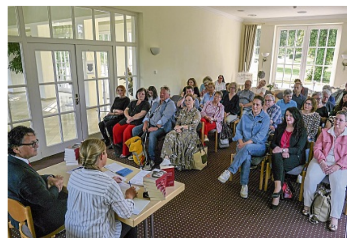
Rund 30 Gäste nahmen an der Infoveranstaltung im Konzertsaal des Kurhauses teil.