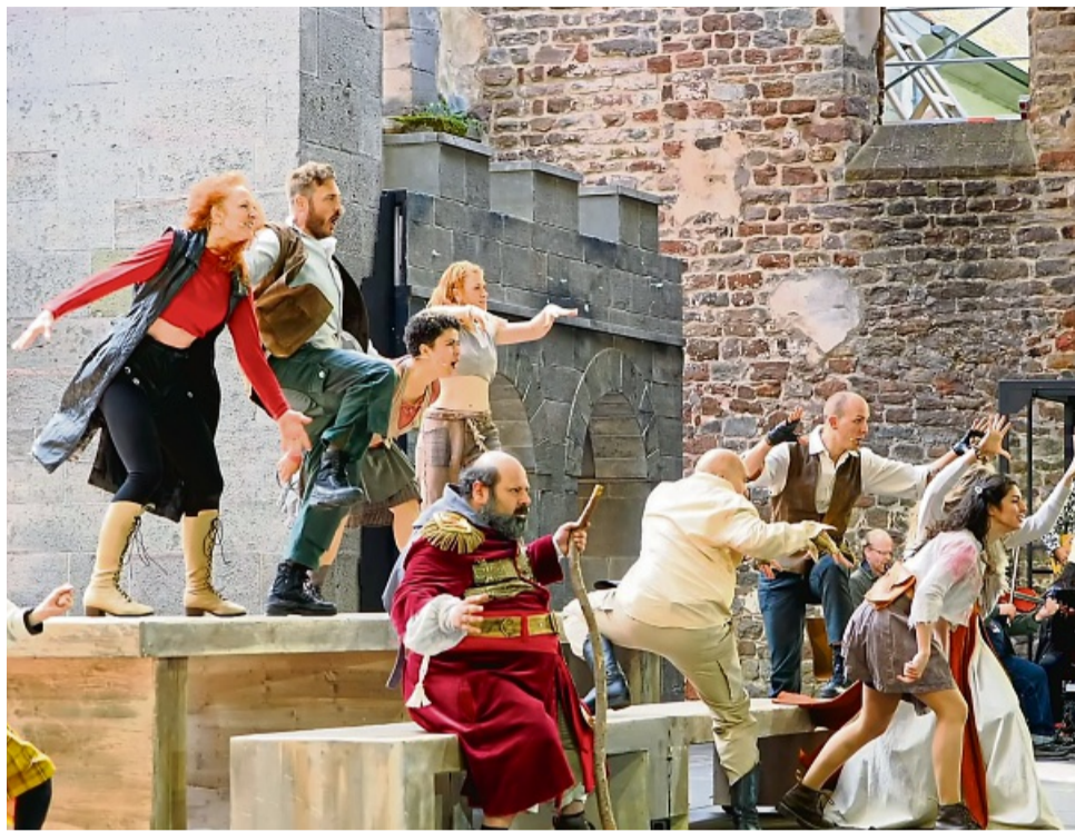
„Ronja Räubertochter“ ist das Kinderstück in diesem Jahr.

Nach nahezu ausverkauften Vorstellungen von „Wie im Himmel“ in der Regie von Joern Hinkel und der Europäischen Uraufführung der neuen Fassung von „A Chorus Line“ durch die Choreografin und Regisseurin Melissa King unter der Musikalischen Leitung von Christoph Wohlleben im Sommer 2024, werden bei-