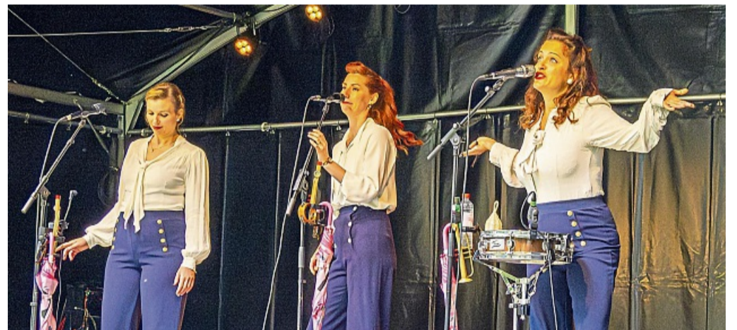
Frivol und wohlgezogen: Das Mainzer Vocal-Swing-Trio „Die Katzen“ begeisterte mit musikalischen Erziehungsregeln von einst.