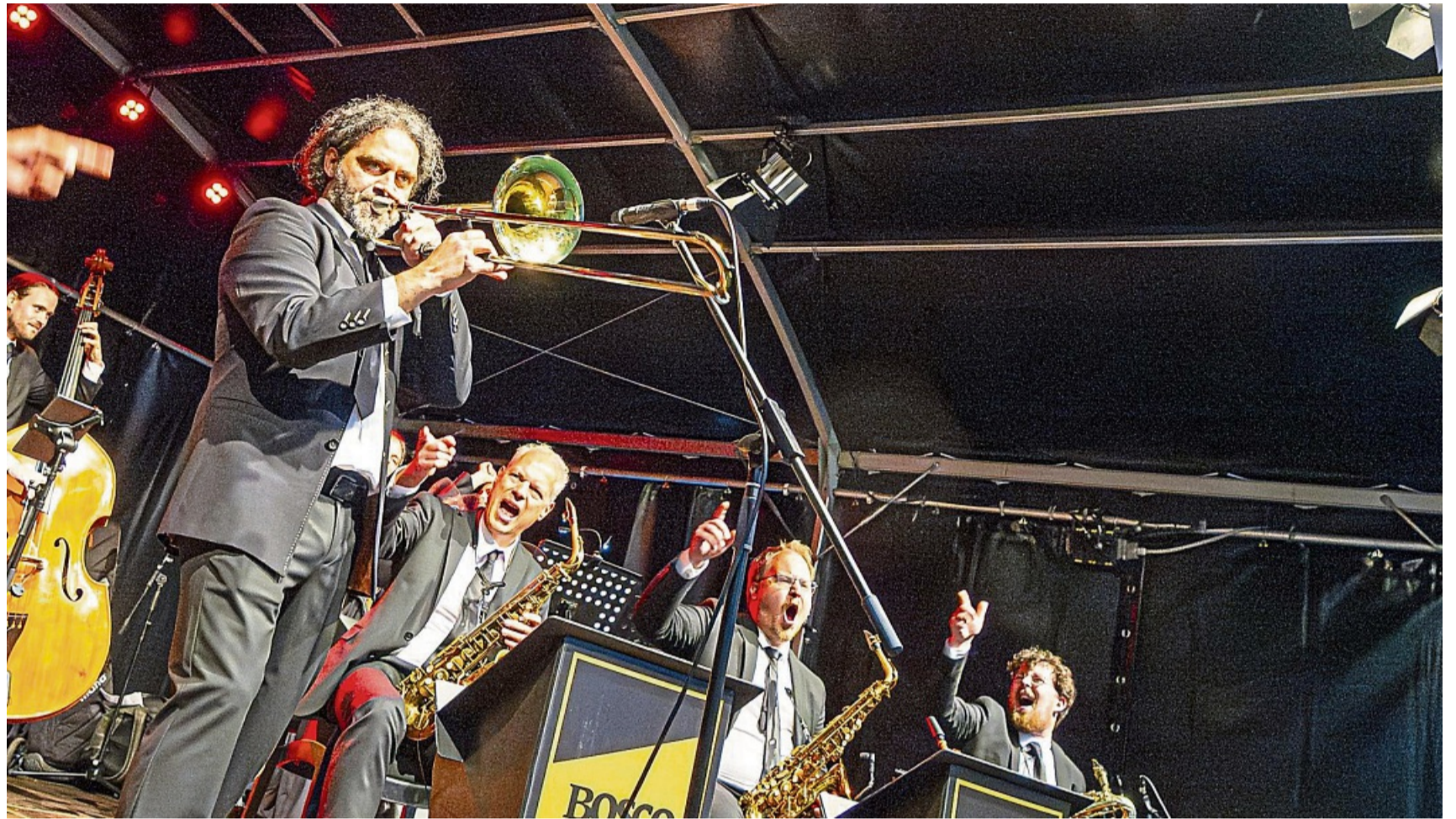
Mitreibende Show: „Bosco“ begeisterte das Publikum am Samstagabend.

„Das Swing & Wine-Festival verzeichnete in diesem Jahr Besucherzahlen auf einem ähnlichen Niveau wie im vergange-