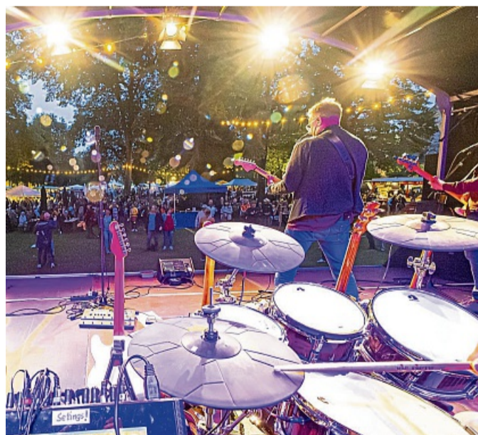
Partystimmung: Die Musik der „Little River Eagles“ brachte das Publikum am späten Freitagabend zum Tanzen.