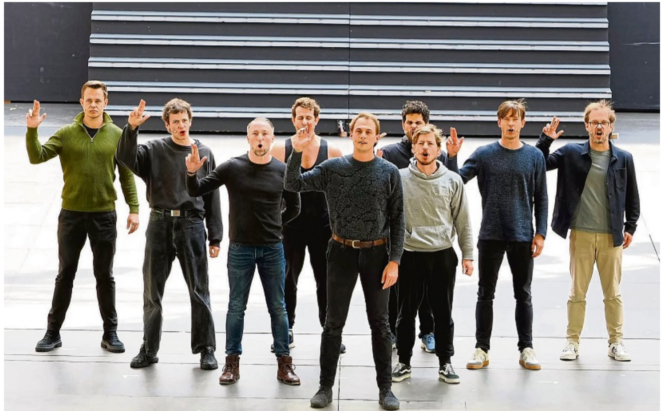
Die Räuber aus dem gleichnamigen Stück präsentierten sich ohne Kostüme bei der HZ-Festspielmatinee mit einer ikonischen Szene schonmal für einen ersten Auftritt vor Publikum.