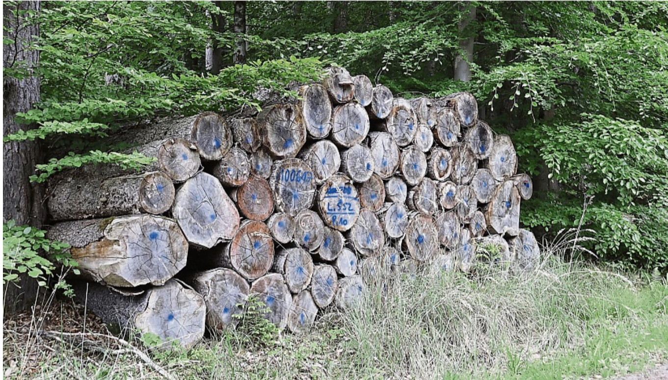
Stichprobenartiger Einsatz: GPS-Tracker werden im Holz versteckt und bei Bewegung aktiviert.