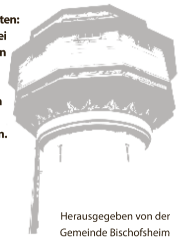
Herausgegeben von der Gemeinde Bischofsheim

Die Bücherei bleibt in den Sommerferien vom 4.8. bis zum 18.8.2025 geschlossen.