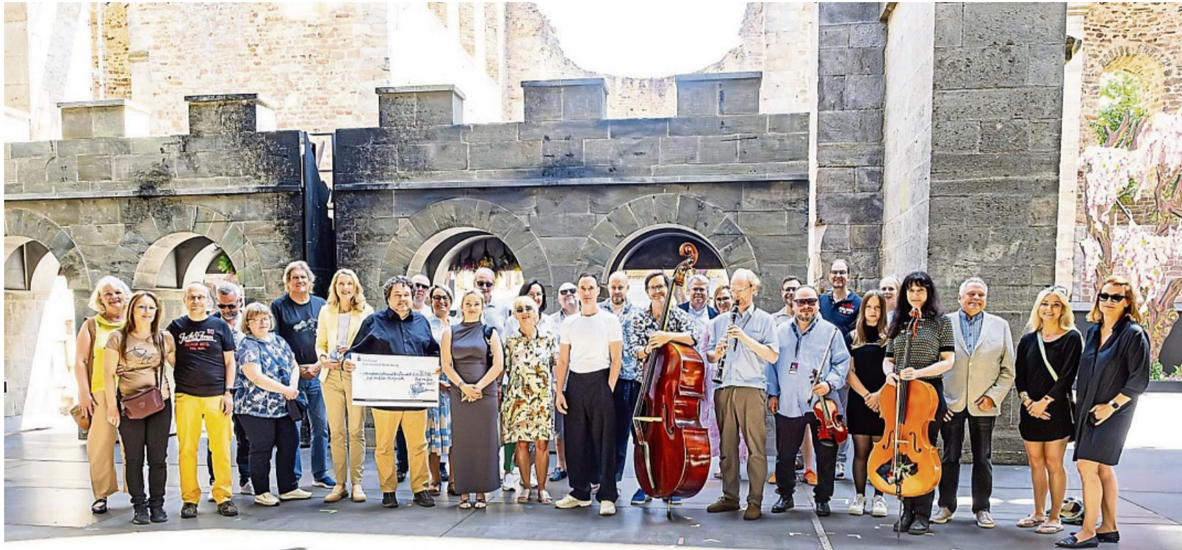
Die „Freunde der Bad Hersfelder Festspiele“ überreichen einen Scheck für das Familienstück.