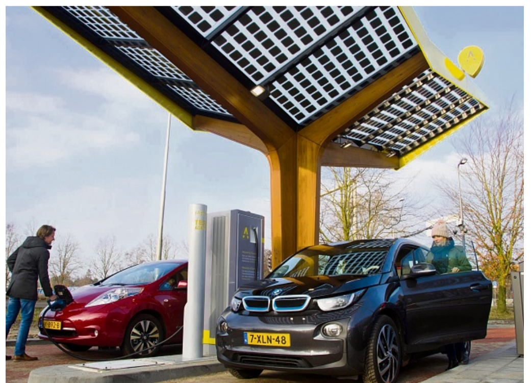
Ist eine Urlaubsreise mit dem E-Auto empfehlenswert? Eindeutig ja. Das gilt zumindest für Autourlauber innerhalb Europas.