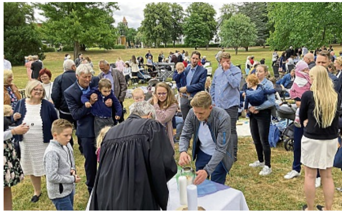
Unter freiem Himmel: Die evangelischen Kirchengemeinden laden zum zweiten Tauffest in den Bad Hersfelder Kurpark ein.

Das Fest beginnt mit einem kurzen Familiengottesdienst. An mehreren Taufstationen werden Pfarrerinnen und Pfarrer taufen. Gerne kann im Anschluss im Kurpark gepicknickt werden. Für Verpflegung ist gesorgt. „Wir ändern lediglich das Format, nicht den In-