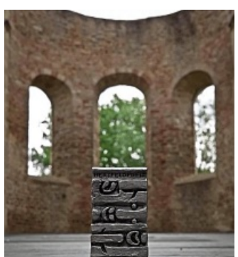
So sieht er aus: Der begehrte Hersfeldpreis für die beste schauspielerische Leistung im Ruinentheater.