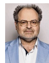
Markus Majowski Komödiant

Markus Majowski ist Komödiant, Charakterdarsteller, Autor, Regisseur und Musiker. Einem breiten Publikum wird er 2003 durch die Sat1-Comedy-Serie „Die dreisten Drei“ bekannt.