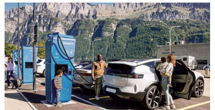
Die Europäische Verbraucherzentrale empfiehlt , sich vorab über das E-Auto-Laden im Ausland zu informieren.

Grundsätzlich ist es eine gute Idee, sich schon rechtzeitig vor einer Urlaubsreise mit dem Elektroauto mit dem Thema Routenplanung und Ladeinfrastruktur entlang der geplanten Strecke und auch am Urlaubsziel zu beschäftigen. Um Ladeslots bereits im Voraus zu planen und die dazugehörigen Pausen optimal auf die eigenen Vorlieben und Bedürfnisse (ein Restaurantbesuch, ein Bummel durch die Altstadt, ein Nickerchen an einem schattigen Flussufer) abzustimmen, sind Online-Routenplaner eine große Hilfe – neben den in den meisten Navigationssystemen von E-Autos integrierten Ladeplanern. Internetseiten wie goingelectric.de , chargemap.com oder abetterrouteplanner.com sind eine gute Möglichkeit, sich schon einmal