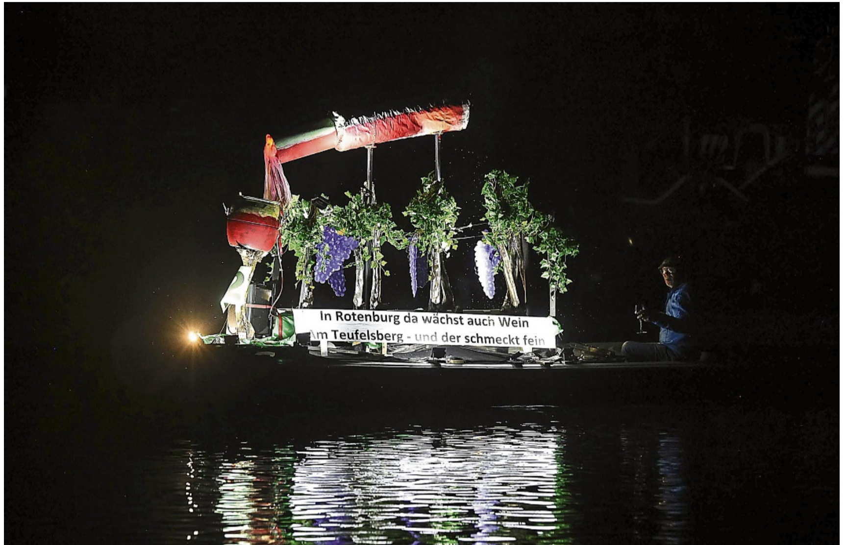
Mit viel Kreativität auf dem Wasser: Beim Bootskorso am Sonntag sorgten 24 bunt geschmückte Boote für ein farbenfrohes Spektakel auf der Fulda – ein neuer Rekord beim Strandfest.

Moritz Rimbach, einer der vier Festwirte, hebt vor allem den Ansturm auf das Schloss-