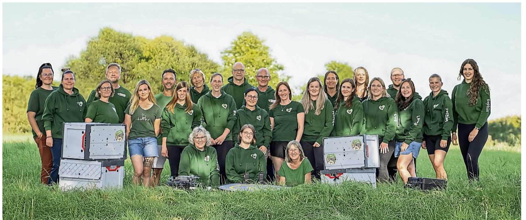
Die Mitglieder der Rehkitzrettung Hersfeld-Rotenburg e.V. sind ehrenamtlich für das Tierwohl im Einsatz.

„Der gut ausgebildete Fluchinstinkt entwickelt sich bei den Rehkitzen erst nach drei bis vier Wochen“, sagt Kesten. Vorher würden sich die Tiere bei Lärm oder anbahnender Gefahr einfach tief ins Gras drücken und regungslos verharren. Und selbst, wenn man davorstehe, sei es oft schwierig, sie gut zu erkennen. Denn wir reden hier von zierlichen, 30