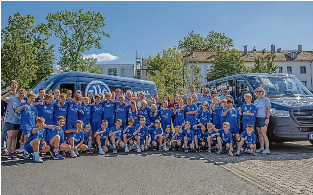
Freude bei der Handball-Jugend: Dank einer großzügigen Spende der Heinz Trox-Stiftung ist die Mobilität der Jugendmannschaften des TV Hersfeld für weitere fünf Jahre gesichert.

Die Handballabteilung des TV Hersfeld gehört zu den größten und aktivsten Sportgemeinschaften der Region und setzt seit vielen Jahren auf eine nachhaltige Nachwuchsförderung. Ziel ist es, Kinder und Jugendliche für den Handballsport zu begeistern, sie sportlich weiterzuentwickeln und ihnen eine langfristige Perspektive innerhalb des Vereins zu bieten. red/kai