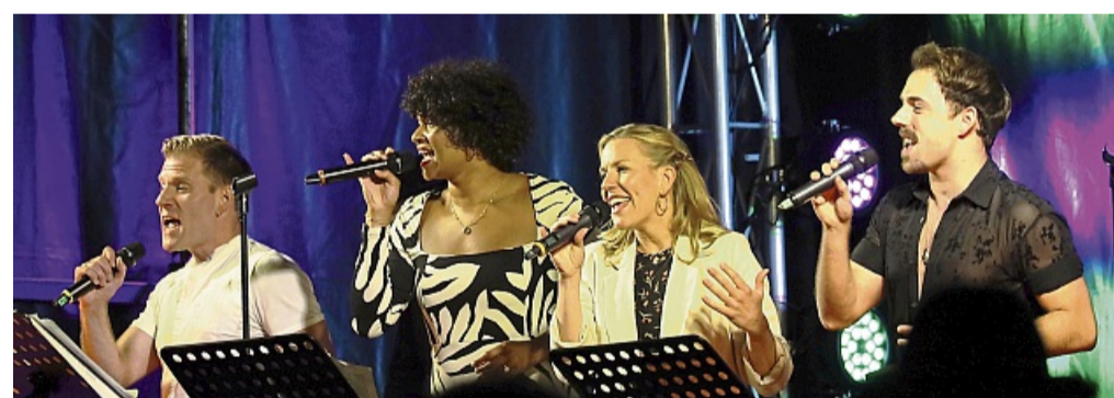
Stars der Bad Hersfelder Festspiele waren bereits in der Vergangenheit im Landkreis auf Konzerttour – beispielsweise im Philippsthaler Schlosspark.

sie wieder im Philippsthaler Schlosspark, im Kloster Cornberg und in der Wasserburg ruine in Friedewald zu Gast. „Diese Reihe gibt es schon seit dem