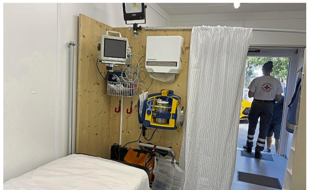
Für den medizinischen Notfall ausgestattet: Die Sanitätsstation bei den Festspielen.

Der Dienst beginnt für die Ehrenamtlichen je eine Stunde vor Aufführungsbeginn. Dann gilt es, sich bei der Inspizienz der Aufführung zu melden. „Dann sprechen wir uns ab: Gibt es Regen, Unwetter oder Hitze, gibt es besondere Anforderungen für die Sicherheit, wenn etwa Politiker unter den Gästen sind, wie sieht es mit verdeckter Kriminalpolizei