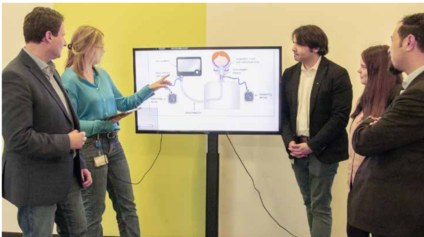
Ein Expertenteam aus THM, JLU und Thora Tech will die Beatmung von Patientinnen und Patienten optimieren.