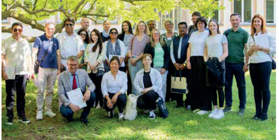
Gäste von Hochschulen aus acht Ländern sind anlässlich der International Staff Days an der THM zusammengekommen.

Zum Programm zählten Campusrundgänge in Gießen und Friedberg, bei denen die Gruppe das Labor für Baustoffkunde, Bauteilprüfung und Massivbau, das Motorsport-Labor, die Lernfabrik, das OpenA5 und das Virtual Reality-Labor (VR-Lab) besichtigte. Die International Staff Days boten den Gästen vielfältige Gelegenheiten zum Networking und zum Wissens- und Erfahrungsaustausch. Die Hochschulmitglieder tauschten sich auch