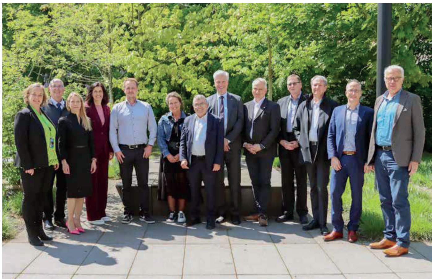
Zur Maisitzung sind der Hochschulrat und das Präsidium der Technischen Hochschule Mittelhessen (THM) zusammengekommen, um fünf neue Mitglieder im Hochschulrat zu begrüßen.