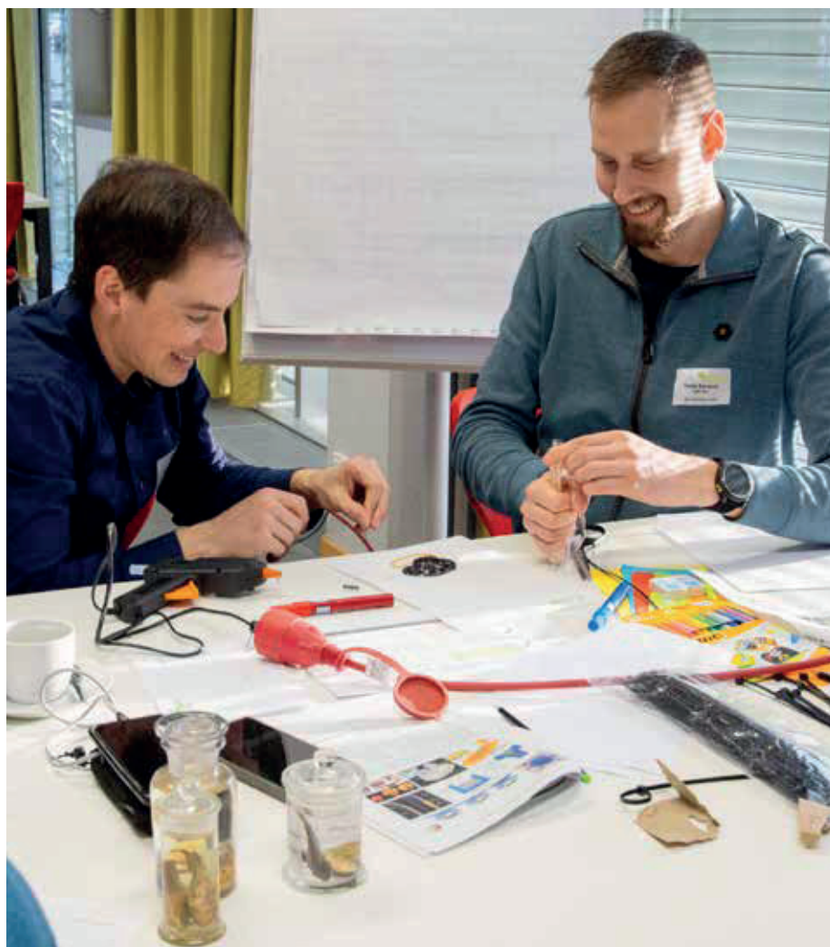
In dem Workshop haben die Wissenschaftlerinnen und Wissenschaftler gemeinsam bionische Produkte entworfen und Modelle gebaut.

Bildung und Forschung (BMBF) geförderte Verbundprojekt der Senckenberg Gesellschaft für Naturforschung in Frankfurt, dem Leibniz-Institut für Verbundwerkstoffe in Kaiserslautern und THM will einen sogenannten Bionik-Marktplatz