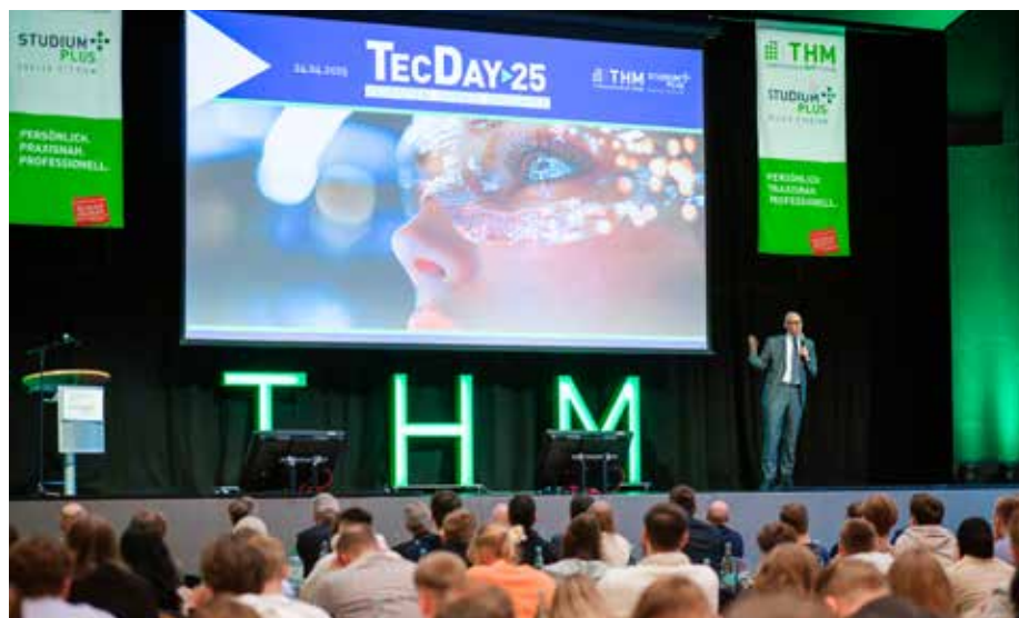
Quantencomputing war Thema des TecDay von StudiumPlus.

Ein Meilenstein ist „Baby Diamond“, der erste Quantencomputer in Hessen an der