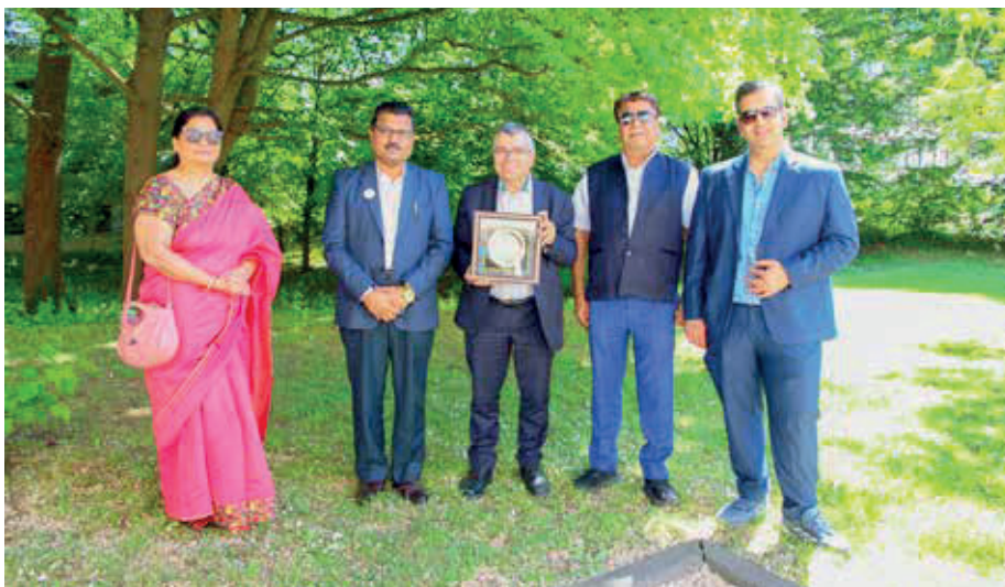
Zu Besuch an der THM: Eine Delegation des Indian Institute of Information Technology Allahabad (IIIT).