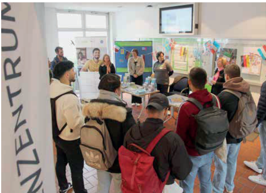
In Friedberg beginnen 180 Studierende ihr Studium zum Sommersemester.

Volles Haus in der Gießener Kongresshalle auf dem Campus Friedberg und in Wetzlars Spilburg: Die THM hat zum Sommersemester 1167 neue Studierende willkommen geheißen. Sie starteten wie üblich mit dem STEP-Programm, eine Kennenlern-Woche mit vielfältigen Angeboten rund um Studium und Stadtleben.