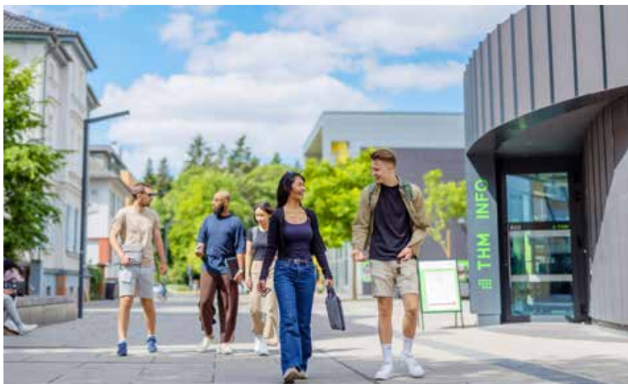
Mehrere Studiengänge der THM punkten im CHE-Hochschulranking.

HeyStadium veröffentlichte das Ranking für Fächergruppen wie „Angewandte Naturwissenschaften“, an Hochschulen für angewandte Wissenschaften. Die Elektrotechnik-Studiengänge erreichten 4,3 von 5 Punkten in „Betreuung durch Lehrende“, „Studienorganisation“ und „Bibliotheksausstattung“. In „Laborpraktika“ und „Räume“ gab es sogar 4,4 Punkte. Die allgemeine Studiensituation wurde mit 4,2 Punkten bewertet. Die dualen Studiengänge von StudiumPlus überzeugten mit 4,7 Punkten in „Studienorganisation“