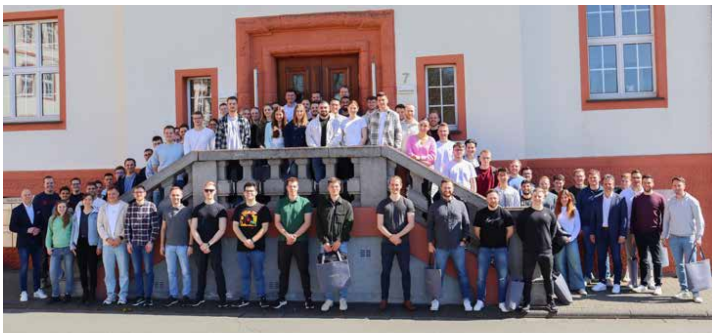
In der Wetzlarer Spielburg hat StudiumPlus, das Duale Studienangebot der THM, 112 neue Studierende begrüßt.