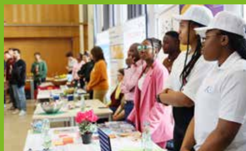
Beim „Markt der Möglichkeiten“ haben die internationalen Studierenden die Möglichkeit, über die vielfältigen Angebote zu informieren.

Zu den „Stammgästen“ zählten langjährige Partner des International Office: die Evangelische Studierenden Gemeinde (ESG), die Katholische Hochschulgemeinde (KHG), die Abteilung Beratung und Soziales des Studierendenwerks Gießen, STUBE Hessen, der Solifonds und das Antidiskriminierungsnetzwerk Mittelhessen (AdiNet). Neu dabei war in diesem Semester die Ehrenamtsagentur Friedberg. Als studentische Initiativen waren „AfroGeek“ und „Youth Challenge International“ vor Ort. Darüber hinaus stellte das Team des „Buddy Programmes“ den regelmäßig stattfindenden internationalen Stammtisch vor, der es den Teilnehmenden ermöglicht, sich in entspannter Atmosphäre auszutauschen und neue Bekanntschaften zu machen. ■