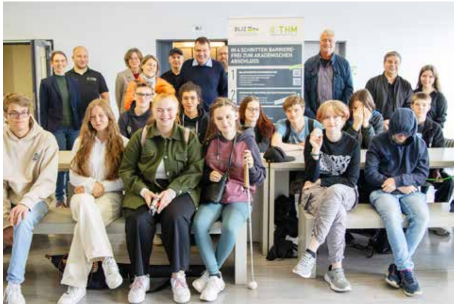
Der Tag der offenen Tür bietet die Gelegenheit, das Bliz kennenzulernen.

Der Tag der offenen Tür wurde speziell für blinde und sehbehinderte Studierende konzipiert und bot die Gelegenheit, das Zentrum näher kennenzulernen, Einblicke in das Programm zu gewinnen und sich mit einer barrierefreien Umgebung ver-