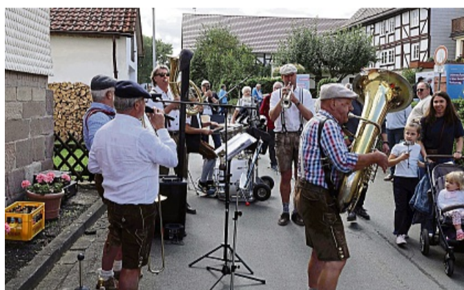
Die Kapelle „Blechgedöns“ unterhielt die Besucher des stehenden Festzuges zur 650-Jahrfeier in Ersrode musikalisch. Mehr Bilder unter hersfelder-zeitung.de .

und die Bundespolizei waren mit einigen Einsatzfahrzeugen vor Ort und gaben Informationen zu Fragen rund um ihre Organisationen. Wieder mit dabei war die Gruppe „Skulptura 2025“, die ihre Kunstwerke ausstellte, die von den Künstlern beim Holzbildhauersymposi-