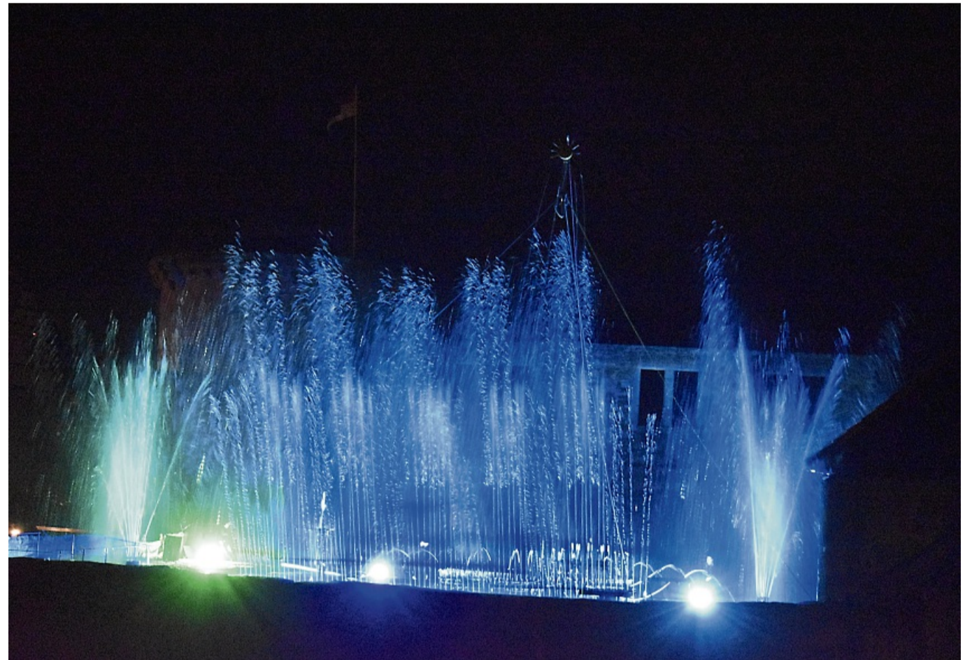
Wenn Licht auf Wasser trifft, entsteht ein buntes Farbenspiel, das sich sehen lässt.