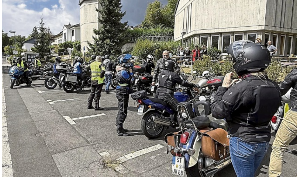
Zwischenstopp: Zur Mittagszeit trafen die Motorradfahrer an der Bad Hersfelder Martinskirche im Schlipplental ein.