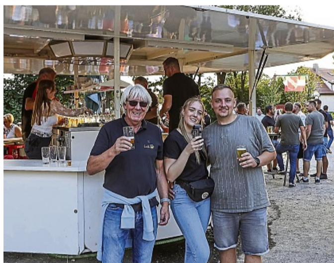
Gläser hoch für die Feierlaune: Die Heinebacher und ihre Gäste sind gut gelaunt. zks

Weiter gehen die nächsten Test-Tage mit einer Disko, dem Familien-Nachmittag mit Spiel und Spaß auf dem Festplatz.