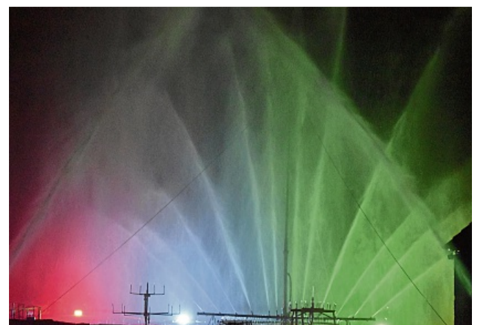
Tolle Farbspektakel sind garantiert.

Für das leibliche Wohl ist mit leckerer Bratwurst vom Grill sowie Pommes gesorgt. Außerdem steht ein Eiswagen bereit sowie Trinkbares von der mobilen Cocktailbar mit Weinstand. Der Eintritt ist frei.