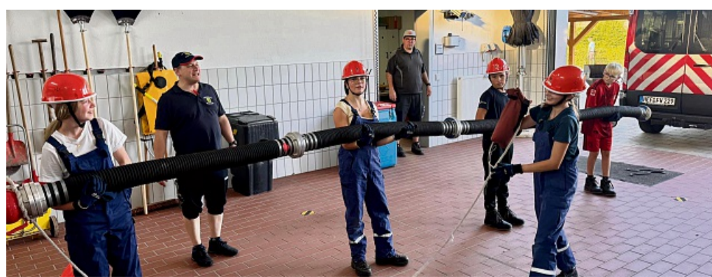
Freiwillige Feuerwehr Richelsdorf: Arbeitseinsatz für den kommenden Dämmschoppen.

Wehr tätig gewesen, was somit auch der Öffentlichkeit zugutekomme. „Der Dämmschoppen ist für uns eine schöne Gelegenheit, die Dorfgemeinschaft zu stärken, miteinander ins Gespräch zu kommen und unsere Arbeit vorzustellen“, sagt Moritz. Für Essen und Trinken ist gesorgt, und eine Blasmusikkombo soll für zünftige Stimmung sorgen. red/mas