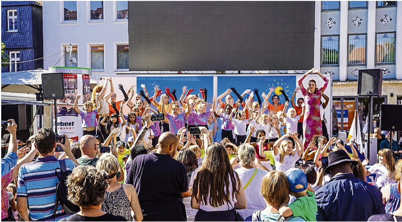
Bühnenprogramm, zahlreiche Aktivitäten und mehr verwandeln Bad Hersfeld zum 25. Mal in die Kinder-City.