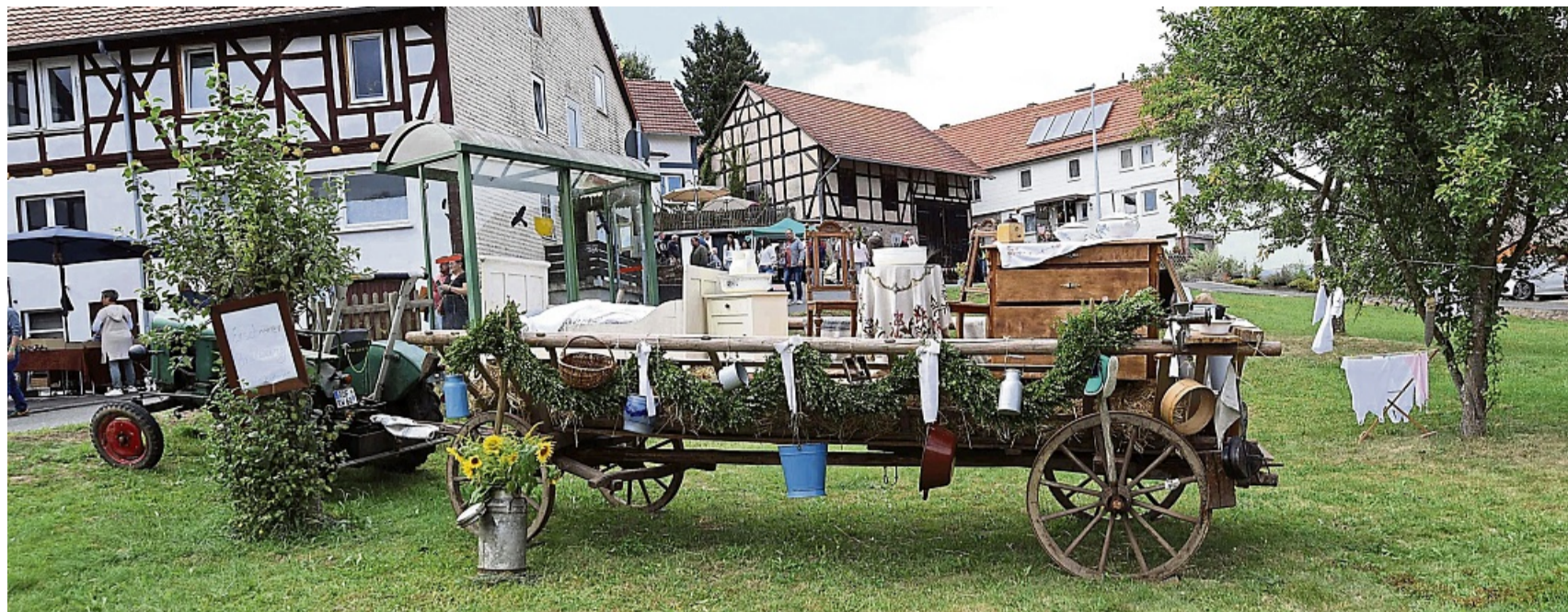
Ersröder Brauchtum: Auch dieser Aussteuerwagen wurde im stehenden Festzug gezeigt.