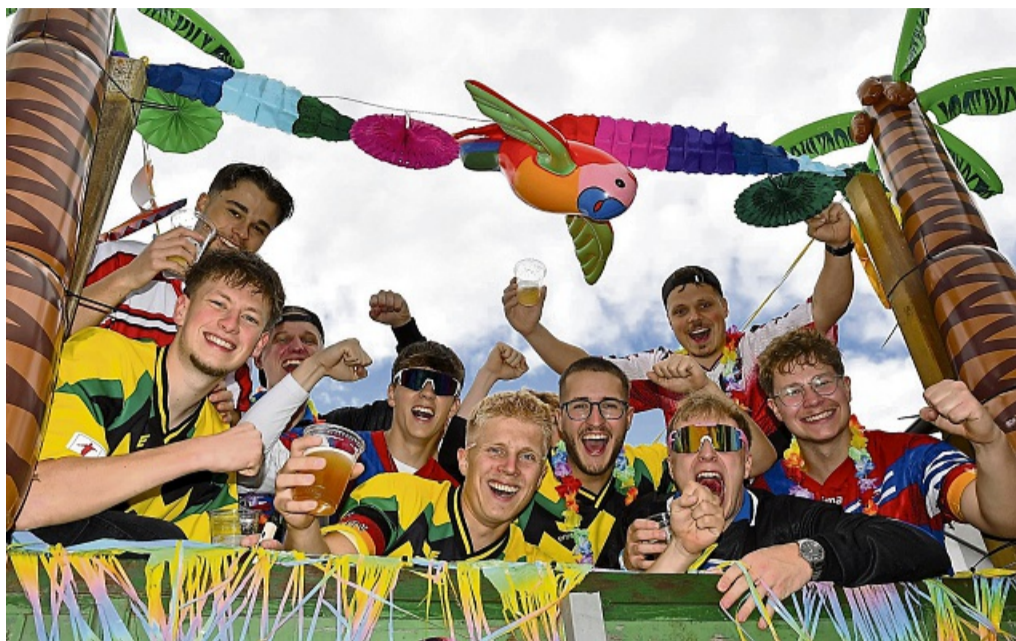
Auf Meisterfahrt: Unter dem Motto „Einer für alle, alle für Malle“ zieht es die Jungs der SV Eintracht Solz auf die Insel, auf der man gerne Bier trinkt.