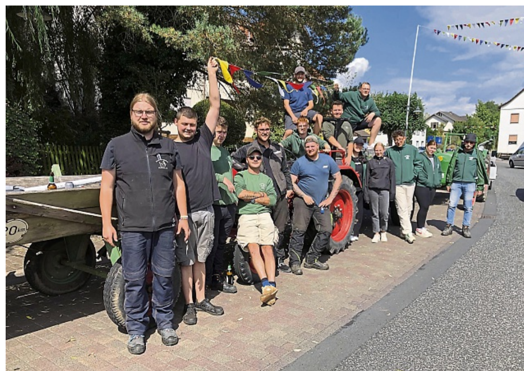
Auf der Kirmes Obersuhl wird es auch in diesem Jahr wieder jede Menge zu entdecken geben.

Das Team der Kirmes Obersuhl bedankt sich an dieser Stelle bei den zahlreichen Vereinen und Privatpersonen, die tatkräftig bei der Planung und Umsetzung der Kirmes geholfen haben. nh