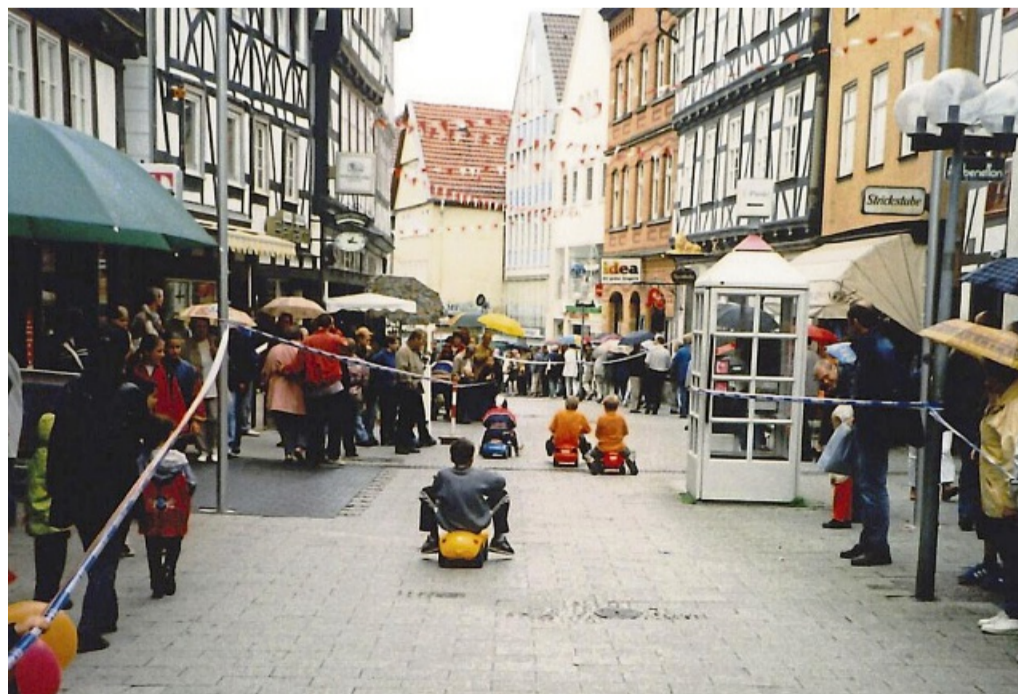
Ein Blick zurück: Schon beim ersten VR-Kindertag am 2. September 2000 sorgte das Bobbycar-Rennen für Begeisterung – eine Tradition, die bis heute Kinderaugen zum Strahlen bringt.

Für strahlende Gesichter sorgen außerdem Karussells, Fotospaß mit Kinohelden, glitzernde Tattoos, farbenfrohes Kinderschminken und viele weitere tolle Aktionen. Natürlich ist auch für das leibliche Wohl gesorgt – von süßen Crêpes über erfrischende Snacks bis hin zu herzhaften Leckereien und vieles mehr. So wird Bad Hersfeld auch 2025 erneut zur bunten, fröhlichen Kinder-City, in der fast alle Angebote wie immer kostenlos sind.