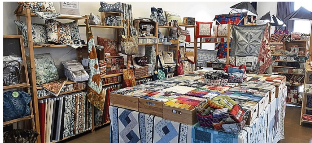
Beim Handarbeitsmarkt in Rotenburg werden Patchwork-Stoffe, Kissen und vieles mehr geboten.

Die Veranstalter, das sind Anke Hanstein von „Im Stübchen“ aus Rotenburg und Ulrike Fastenau von „Profi Patchwork und Quilten“ aus Bad Hersfeld. Sie freuen sich auf viele Besucher. kmh