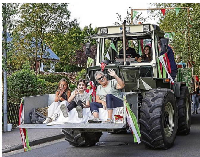
Alternative Sitzgelegenheit: Die Kirmesbesucher in Heinebach sind für jeden Spaß zu haben.

Am Ziel angekommen, wurden es immer mehr Gäste. 200 Besucher genossen schließlich bei kühlen Getränken und leckerer Bratwurst bis zwei Uhr