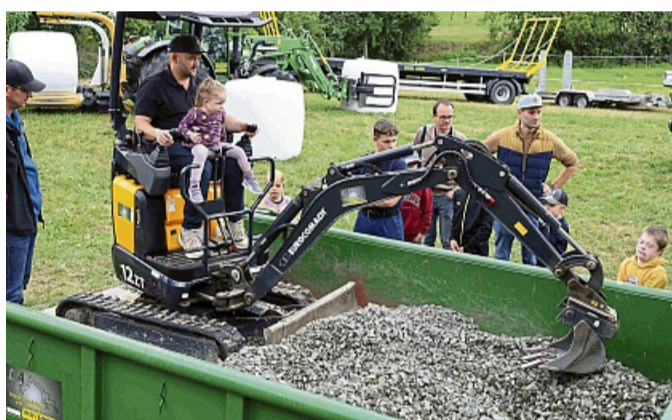
Früh übt sich: An dieser Station des stehenden Festzugs durften die Kinder unter fachkundiger Anleitung selbst ans Steuer eines Minibaggers.

In der Kirche konnten sich die Besucher in einer Chronik und über das Ersröder Brauchtum informieren. Auch an die Kinder hatte man gedacht – mit Stationen, an denen sie sich bei