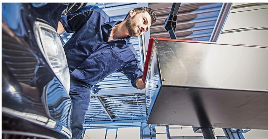
Für Durchblicker: Auch im Oktober 2025 sorgt der Licht-Sicht-Test dafür, dass Autofahrer in der dunklen Jahreszeit gut sehen und gesehen werden.

In diesem Jahr gibt es noch mehr gute Gründe, das kostenlose Angebot zu nutzen. Mit einem frischen Konzept wurde aus dem Licht-Test der Licht-