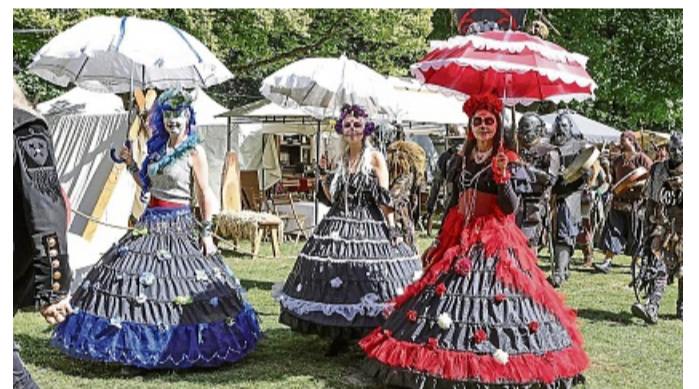
Die „Catrinas“ brachten einen Hauch Mexiko nach Rotenburg. STEFAN KOST-SIEPL

Anzeigensonderveröffentlichung | 13. September 2025