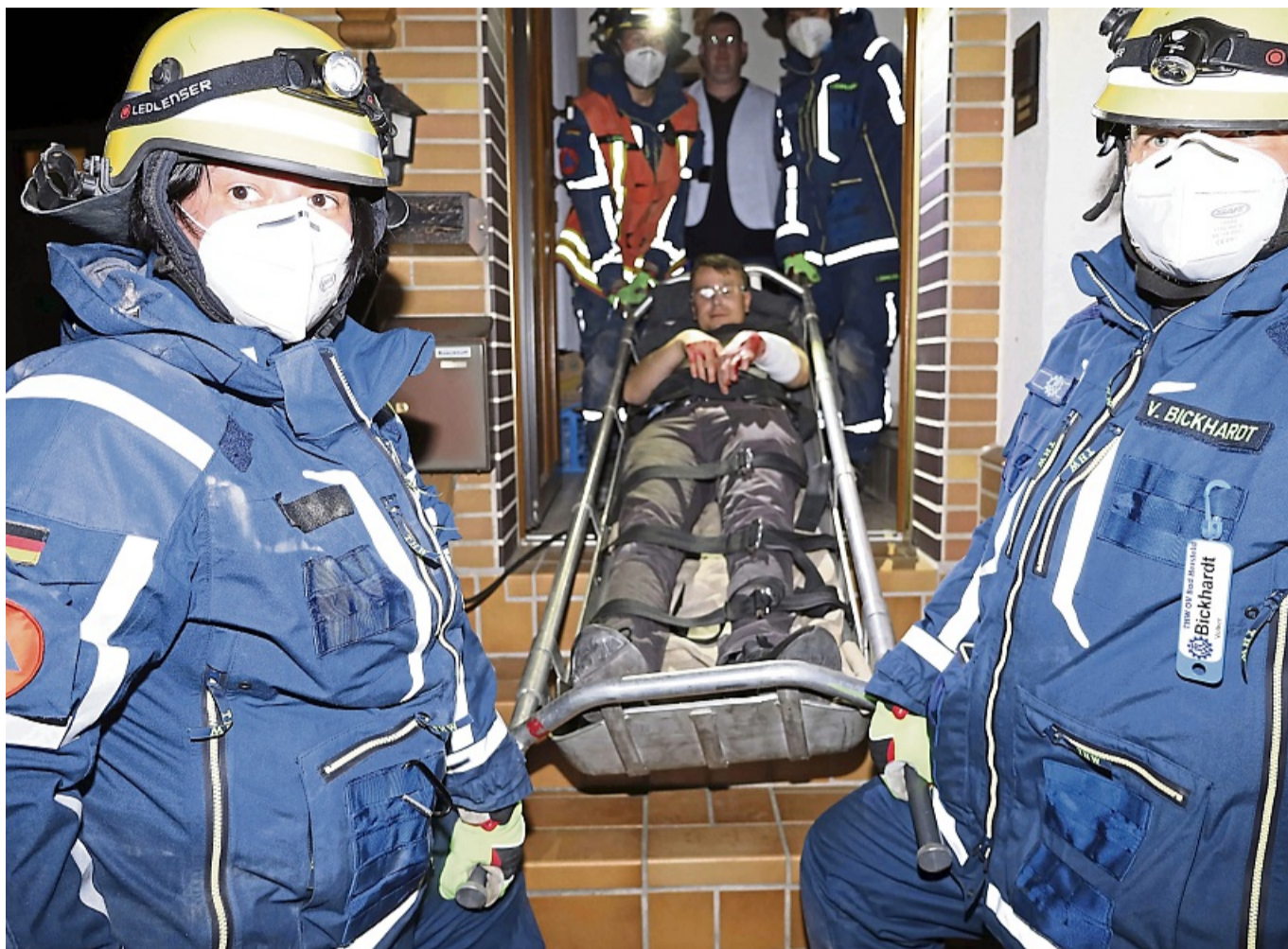
THW-Übungseinsatz: Personenrettung bei Stromausfall.