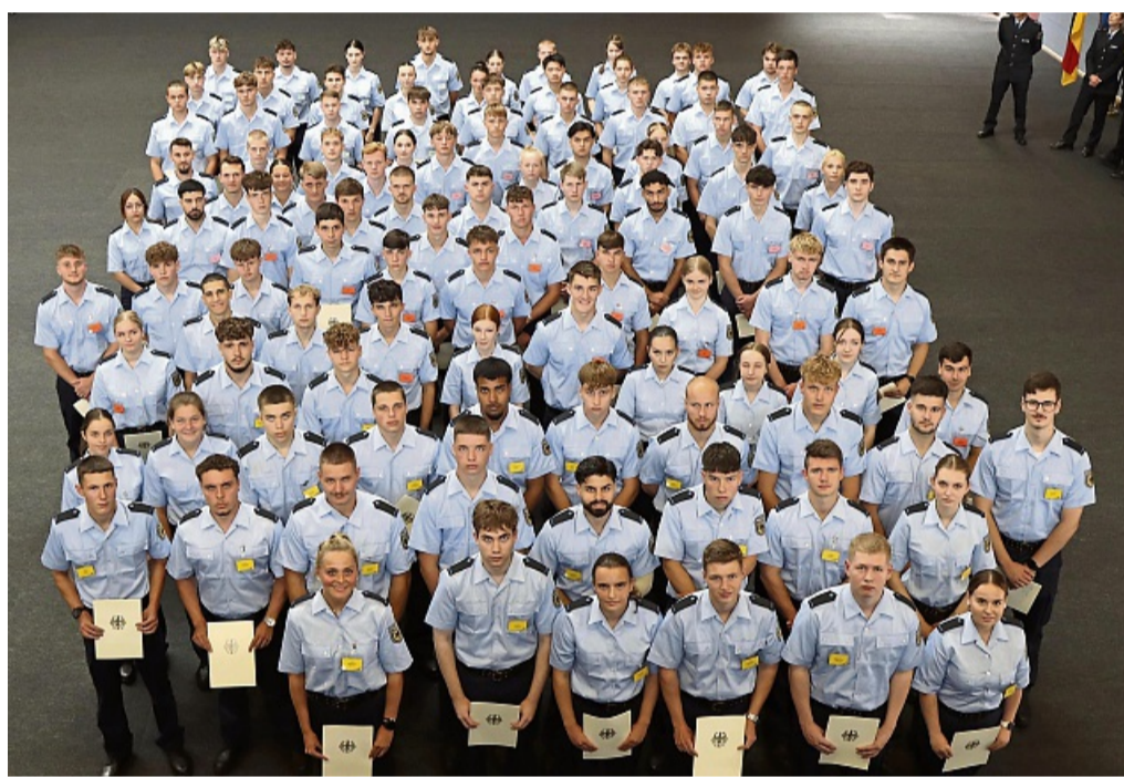
Der neue Ausbildungsjahrgang 25 II startete am Montag mit 101 jungen Auszubildenden.