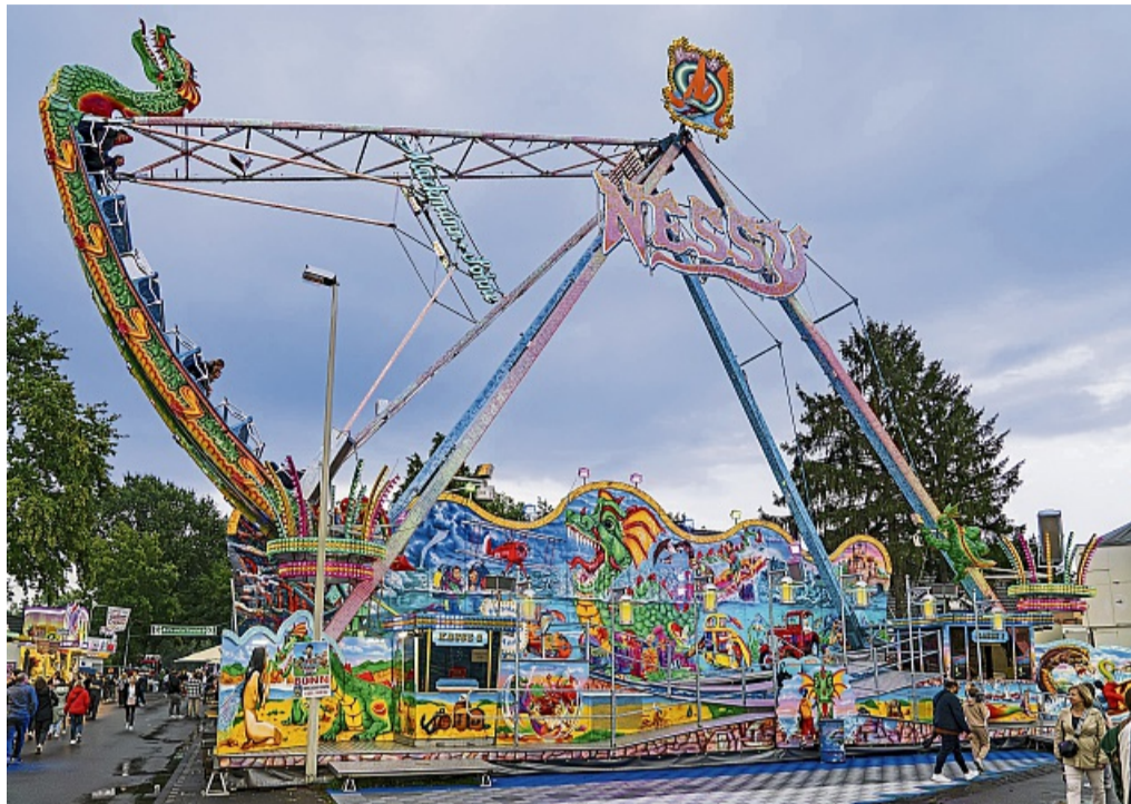
Die „Nessy“ kommt zurück auf dem Marktplatz und bringt die Besucher des Lollusfests ordentlich in Schwung.

Das Fahrgeschäft, das seine Premiere 2024 feierte, verfügt über vier Kabinen, die sich um ihre eigene Achse drehen und so den Rundum-Blick garantieren. Der „LOOK“ fährt im Parallsystem – zwei Gondeln fahren nach oben, zwei nach un-