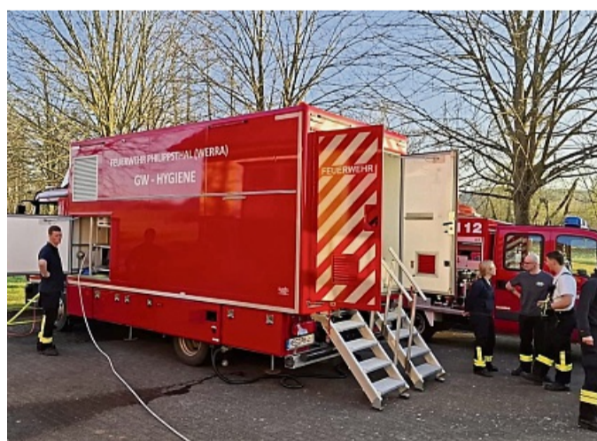
Im Einsatz: Der Gerätewagen Hygiene (GW Hygiene) der Feuerwehr Philippsthal wurde mit dem Hessischen Katastrophenschutzpreis ausgezeichnet.

Philippsthal – Die Freiwillige Feuerwehr Philippsthal hat den ersten Platz des Hessischen Katastrophenschutzpreises belegt. Diese Auszeichnung des Hessischen Ministeriums des Innern, für Sicherheit und Heimatschutz wurde der Wehr laut Pressemitteilung der Marktgemeinde für ihr innovatives Einsatzkonzept des Gerätewagens Hygiene (GW Hygiene) am „Tag des Ehrenamtes“ im Hessenpark Neu-Anspach verliehen.