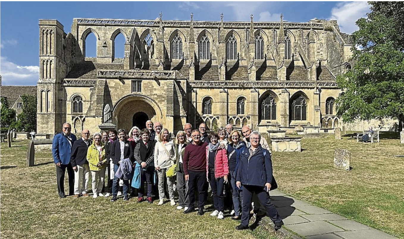
Die Reisegruppe vor der Malmesbury Abbey.

Die Reisegruppe hatte erlebnisreiche Tage und begann nach der Fährfahrt über den Kanal von Calais nach Dover den Engländeraufenthalt mit einem kurzen Stopp beim Dover Castle. Danach ging es weiter nach Canterbury, wo sie die Altstadt und die Kathedrale kennenlernten. Die Canterbury Cathedral gehört zum Unesco-Weltkulturerbe und ist Hauptsitz der Anglikanischen Kirche. Nach der Übernachtung in Maidstone fuhr die Reisegruppe nach London, wo sie ihre Stadterkundung mit einem Spaziergang durch den Royal Greenwich Park begannen und den Null-Meridian sahen. Die Themse-Bootsfahrt begann mit einem Regenschauer, aber gerade zur rechten Zeit kam die Sonne wieder und bei der Stadt-