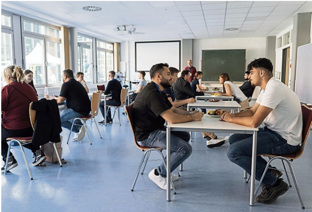
Beim Speed Dating werden in kurzen Gesprächen viele Fragen beantwortet.