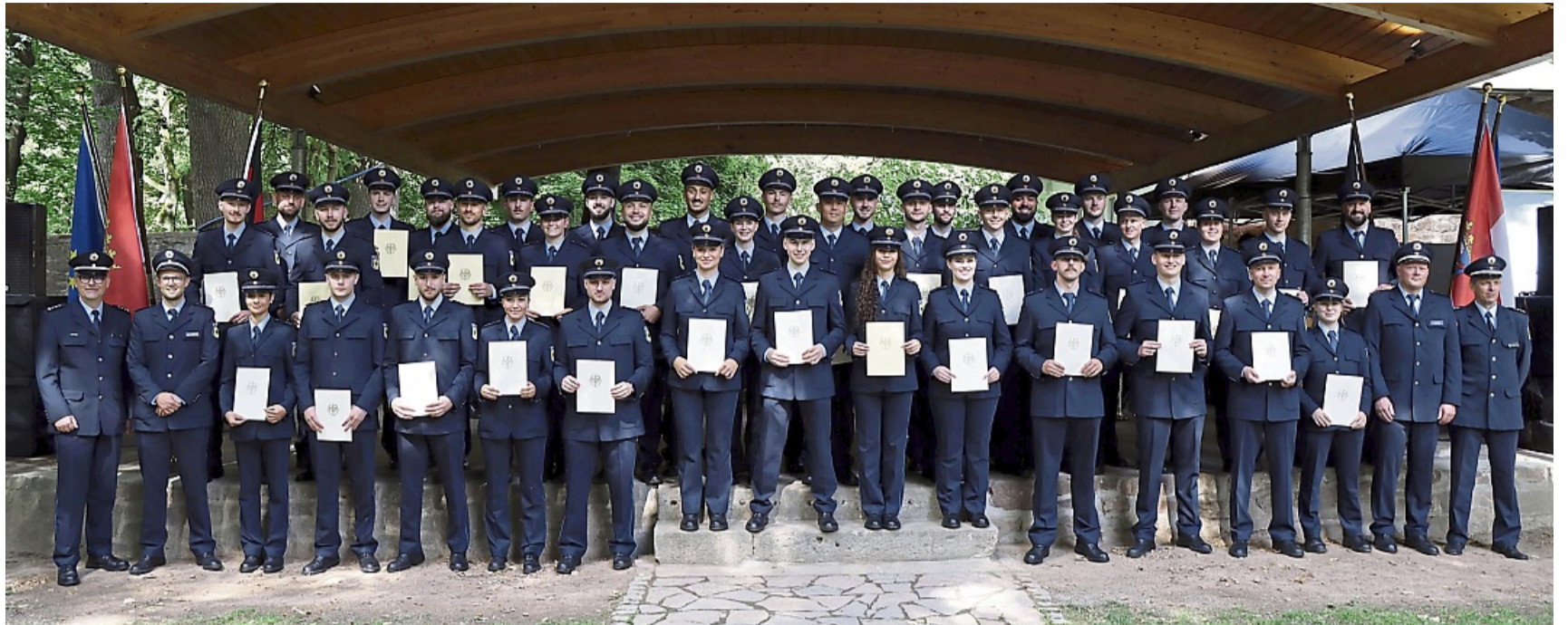
Festlicher Rahmen im Schlosspark: 42 junge Polizistinnen und Polizisten nahmen ihre Ernennungsurkunden entgegen.