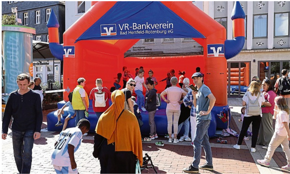
Mehrere Hüpfburgen sorgten beim VR-Kindertag für Spaß.

Die Tradition durfte dabei nicht fehlen: Das beliebte Bobbycar-Rennen sorgte am Lullusbrunnen wieder für Spannung und Jubel. Um 11:30 Uhr starteten die Jüngsten bis fünf Jahre, ab 12:30 Uhr gingen die älteren Kids an den Start. Die Siegereh-