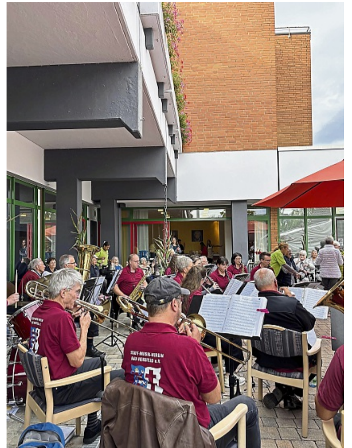
Der Stadt-Musik-Verein Bad Hersfeld trat beim Erntemarkt auf.

Musik-Verein Bad Hersfeld im Erlebnisgarten auf. Der Sonntag wurde von der Volkstanzgruppe des RSV-Ludwigsau-Tann sowie vom Eisenbahn-Blasorchester Bebra begleitet. Rikscha-Fahrten von Chrisbikes rund um die Stiftsruine