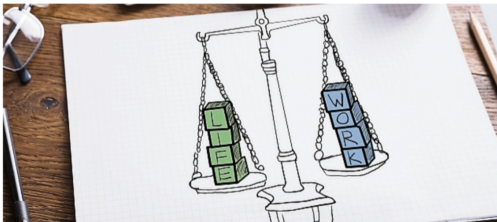
Damit die Work-Life-Balance gelingt, müssen klare Absprachen mit dem Arbeitgeber getroffen werden.

Natürlich bleibt die Herausforderung bestehen, klare Grenzen zwischen Beruf und Privatleben zu ziehen – gerade im Homeoffice. Doch mit transparenten Regeln, digitaler Unterstützung und einer offenen