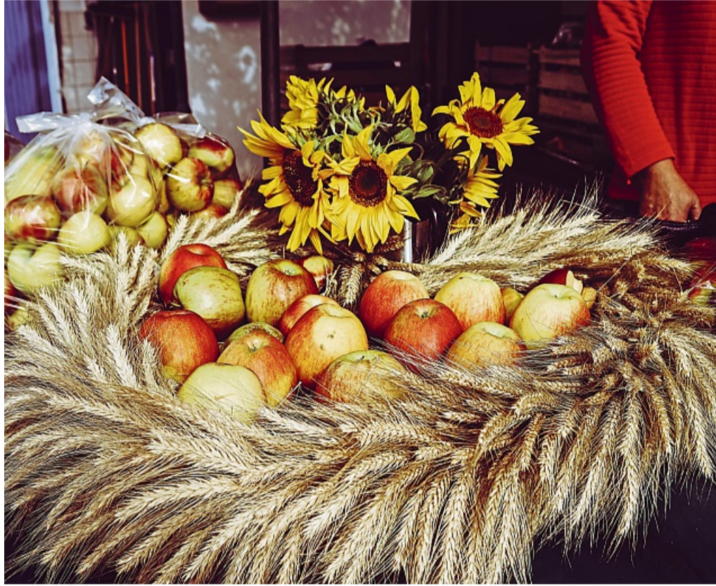
Kuckucksmarkt in Braach: Am Sonntag gibt es erntefrische Äpfel, Birnen und Säfte direkt vom Bauern.