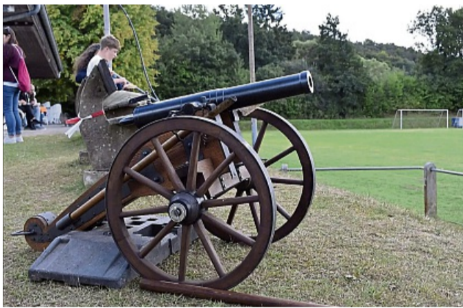
Auch eine Kanone durfte beim Jubiläum des Schützenvereins Meckbach nicht fehlen.

an diesem Sonntag so gut mitgespielt, freute ihn. „Gutes Wetter ist die Grundvoraussetzung für ein gutes Fest. Wenn es regnet, würde ja keiner kommen“ sagte der erste Vorsitzende.