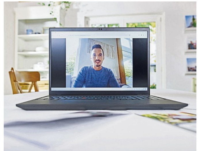
Vor einem Online-Bewerbungsgespräch sollte man die Technik und das Setting checken. So sind Fenster im Rücken wegen des Gegenlichts eher ungünstig.

Unruhe, Haustiere oder andere Menschen im Hintergrund sind ungünstig – schon wegen des Datenschutzes. Diesen müssen Beschäftigte schließlich auch später im Homeoffice gewährleisten. Ein weiterer Tipp: Öfter in die Kamera statt auf den Bildschirm gucken, denn so blickt man dem Gegenüber direkt in die Augen.