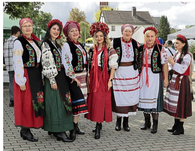
Der ukrainische Frauenchor „Kalina“ aus Rotenburg. Mehr Fotos unter hersfelder-zeitung.de

gen der kleinen Gäste leuchten. Mit dabei waren unter anderem örtliche Kindertagesstätten, die Ernst-von-Harnack-Schule, die Evangelische Auferstehungsgemeinde, die Klima-Initiative Bad Hersfeld, die St. Bonifatius-Gemeinde und das Interkulturelle Zentrum. Die Kita Rappelkiste ließ zum Beispiel Specksteine schleifen und mit einer Farborgel große Bilder malen. Beim Turmbau war Teamgeist gefragt. Die Freiwillige Feuerwehr Hohe Luft/Petersberg präsentierte ihr nagel-