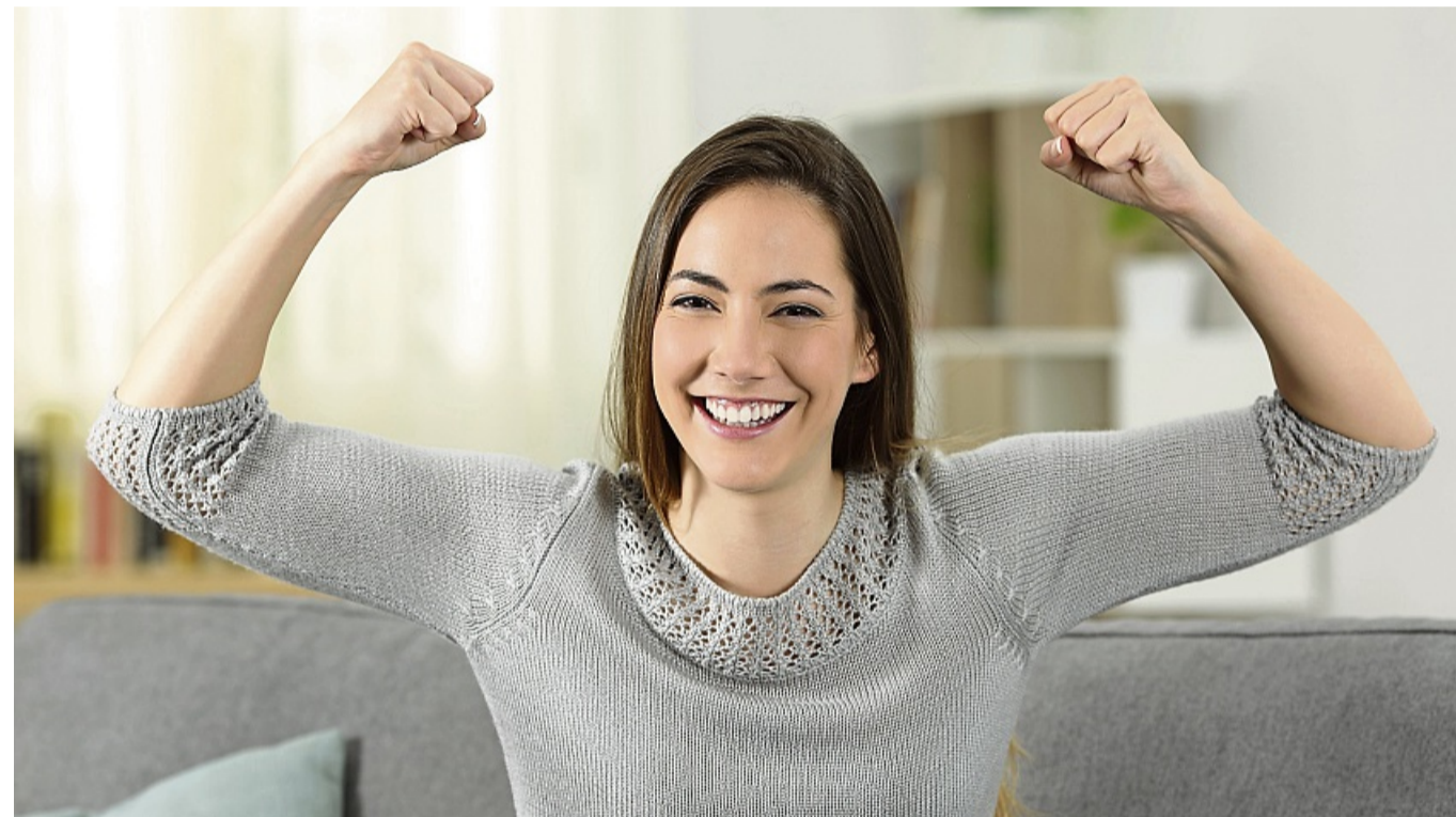
Eine gut vorbereitete Online-Bewerbung kann zu einem digitalen Vorstellungsgespräch führen. Die Zusage zum Job gibt es dann natürlich auch auf modernem Wege.