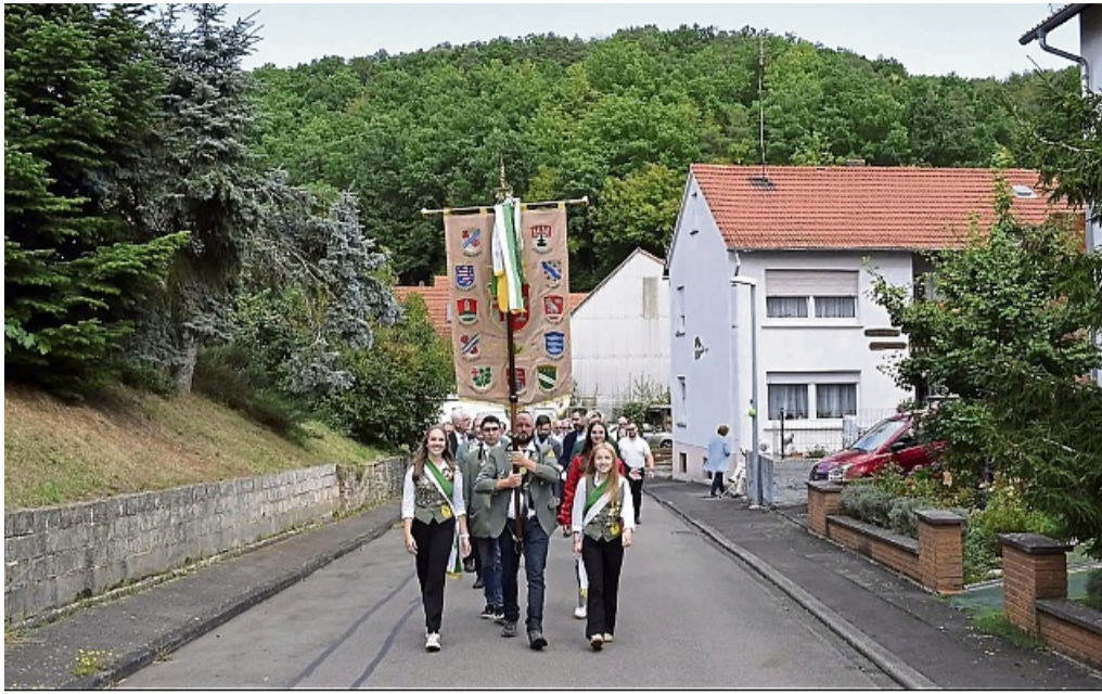
100-jähriges Bestehen: Festzug des Schützenvereins Meckbach.