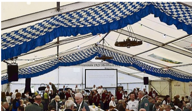
Viele Besucher feierten den 100. Geburtstag des Schützenvereins Meckbach. Mehr Fotos unter hersfelder-zeitung.de

Seit acht Jahren habe es laut Schröder kein Zeltschützenfest mehr gegeben. Dass das Wetter