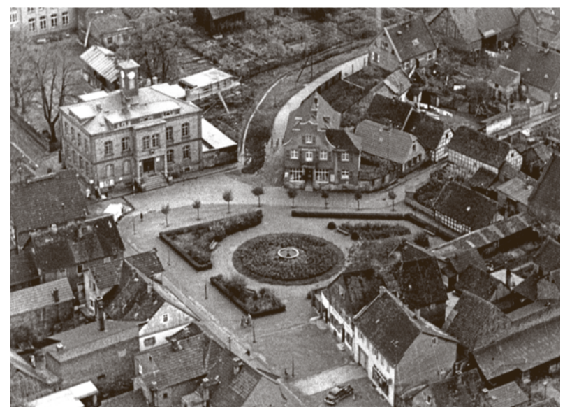
Rathaus und ehemaliger Schulplatz 1950

Bischofsheim erstreckt sich von Am Mainweg bis zur Friedrich-Ebert-Straße und Freiligrathstraße, der Eisenbahn und der Rüsselsheimer Straße sowie der Mainzer Straße und Am Himmelspfad und hat 7.890 Einwohner: Geflüchtete aus Ostpreußen, Oberschlesien und Sudeten, sowie Kriegsrückkehrer, aber auch neue Arbeitskräfte für den Wiederaufbau von Opel, der MAN und der Eisenbahn sorgen für einen steten Bevölkerungszuwachs. Der Gemeinderat besteht aus SPD (7 Sitze), CDU (5), Bischofsheimer Bürgerblock BBB (5) und KPD (1). Bürgermeister ist der beherrschende Kommunalpolitiker Karl Graf (SPD). Die Vorortfrage zu Mainz, hier die Rückgabe des Eigentums an Straßen, Gebäuden und Grundstücken, ist weiter strittig. Am Schulplatz wird ein Springbrunnen gebaut. Als April-Scherz schreibt der Lokal-Anzeiger, dass am 1. April erstmals der Springbrunnen, dessen Wasserstrahl eine Höhe von 20 Meter erreicht, eröffnet würde. 40 cm große Plastikbälle würden bis zu 15 Meter hochgetrieben werden und dort tanzen. Das Vereinsgeschehen wird durch eine Vielzahl von Vereinen und Organisationen aus Sport, Kultur und Gesellschaft geprägt. 1950 zählt der Ort 18 Vereine. Die SV 07 und die drei Gesangsvereine, „Germania“, „Lieder-