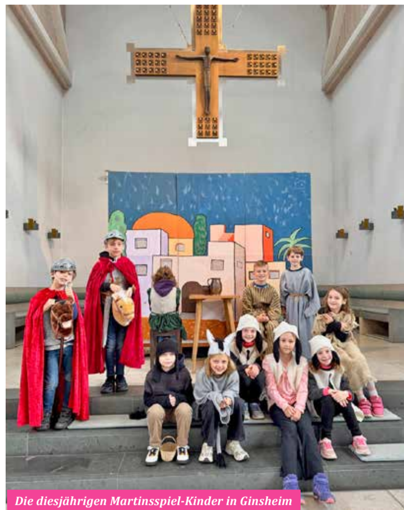
Die diesjährigen Martinsspiel-Kinder in Ginsheim

An der evangelischen Kirche erwartet die Besucher am Martinsfeuer ein einladendes Angebot: Die Kinder dürfen sich auf warmen Orangensaft und Martinsbrezel freuen, während die Erwachsenen die Möglichkeit haben, Glühwein zu genießen. Wenn das Wetter es erlaubt, wird die beeindruckende „1-Millionen-Sterne-Aktion“ der Caritas stattfinden. Mit vielen Kerzen setzen wir gemeinsam ein Zeichen der Hoffnung und Solidarität für Menschen in Not, sowohl