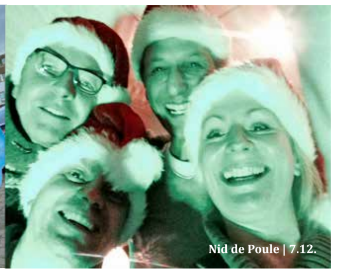
Nid de Poule | 7.12.

12 Uhr Zentrum aller Generationen (ZAG) Gustavsburg Mittagstisch für Senioren Anmeldung und Bezahlung erfolgen jeweils eine Woche im Voraus vor Ort in bar | Seniorenbüro GiGu, 06144 20-151, senioren@gigu.de | Pestalozzistraße 10, Gustavsburg