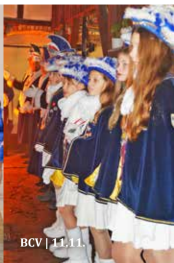
BCV | 11.11.