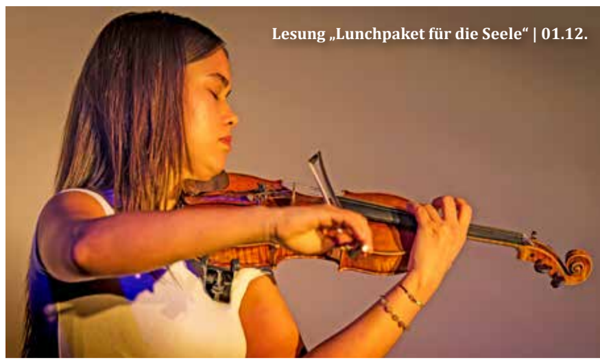
Lesung „Lunchpaket für die Seele“ | 01.12.