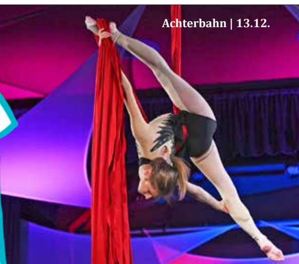
Achterbahn | 13.12.