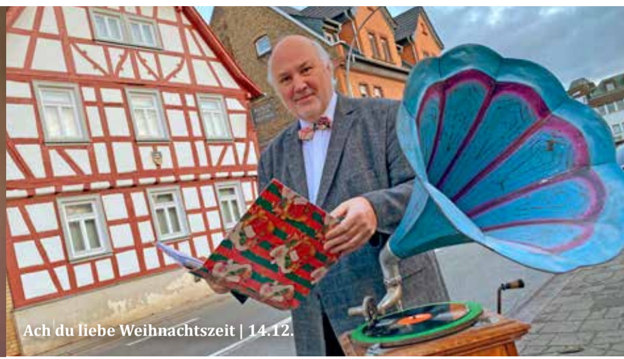
Ach du liebe Weihnachtszeit | 14.12.