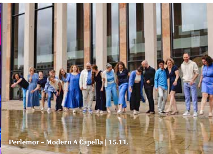
Perlemor - Modern A Capella | 15.11.