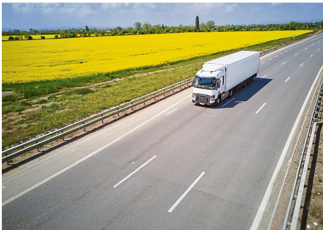
Kraftstoffe, die von unseren leuchtend gelben Rapsfeldern stammen, sparen bereits heute große Mengen CO2 ein.

Biokraftstoffe sind Baustein für die technologieoffene Verkehrswende