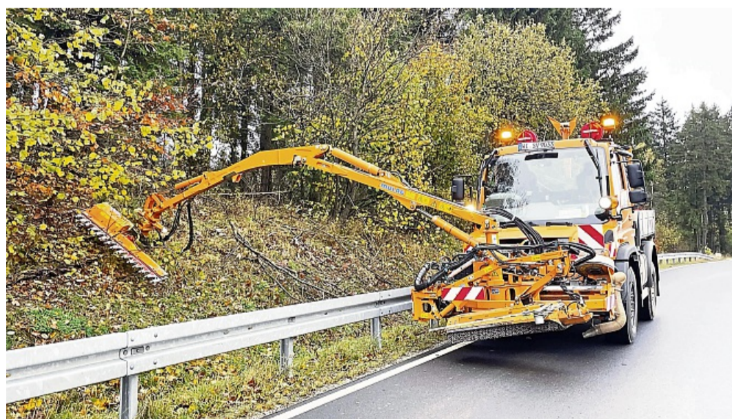
Gehölzarbeiten: Gehölzpflege im Landkreis.

Hersfeld-Rotenburg – Hessen Mobil hat im Landkreis Hersfeld-Rotenburg mit umfangreichen Arbeiten zur Gehölzpflege begonnen, um die Verkehrssicherheit auf den Straßen Hessens zu gewährleisten. Durch den Rückschnitt werde sichergestellt, dass Äste entlang der Straßen die Sicht auf die Fahrbahn, Verkehrsschilder und andere Verkehrsteilnehmende nicht beeinträchtigen, schreibt Hessen mobil in einer Pressemitteilung. „Aufgrund des Artenschutzes sind wir gesetzlich verpflichtet, die Gehölzpflegearbeiten bis Ende Februar abzuschließen. Baumfällungen erfolgen ausschließlich in Absprache mit der zuständigen Naturschutzbehörde“, heißt es von der Behörde. Um die Gefahr von Unfällen durch herabfallende Äste zu minimieren, entfernt der Straßenbetriebsdienst unter anderem Totholz. Des Weiteren werden Sträucher „auf den Stock“ gesetzt. Sie werden in einer Höhe von 10 bis 20 Zentimetern über dem Boden abgeschnitten, um ein gesundes Nachwachsen zu fördern und potenzielle Gefahren zu vermeiden. „Wir führen die Rückschnitte mit größter Sorgfalt durch, um sicherzustellen, dass nur das entfernt wird, was