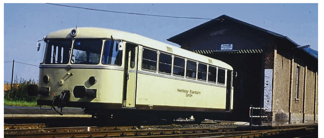
Die beige Schienenbusse der Hersfelder Kreisbahn prägten über Jahrzehnte den Nahverkehr im Ostteil des Landkreises. Das Bild aus den 1980er-Jahren zeigt den VT 52 vor der inzwischen abgerissenen Triebwagenhalle auf dem Schenkklengsfelder Bahnhofsgelände.

Nach dem Zusammenstoß mit einem Auto – letztlich aber wohl auch wegen rückläufiger Fahrgastzahlen und immer weiter ausgedünnter Fahrpläne – wurde VT 52 von der HEG im Jahr 1985 ausgemustert und im Sommer 1987 an die Museumsbahn Paderborn verkauft. Über einen Privatmann gelangte er schließlich nach Nördlingen, wo er laut Karbe zuletzt als Ersatzteilspeicher dienen sollte. Beim Bundesbahn-Schienenbus des Museums handelte es sich jedoch um die zweimotorige