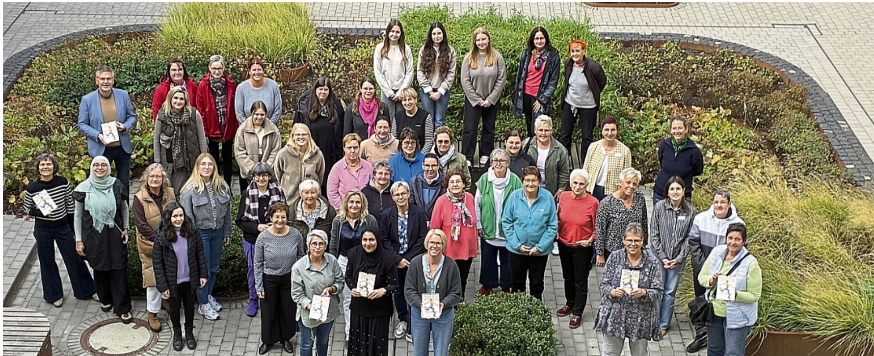
Bei der Präsentation waren auch einige Frauen, die im Kalender abgebildet sind, vor Ort.