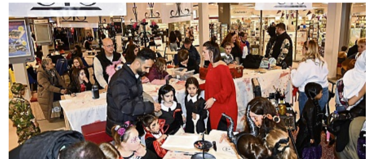
Im Untergeschoss des be! war Betrieb: Die einen bemalten Leinenbeutel, die anderen wollten ein Halloween-Tattoo.