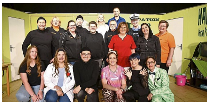
Das Team der „Theater Scheune“ mit Bühnenbildern und Helfern nach ihrem Auftritt der Kirmeskomödie „Irres Diamantenroulette“.