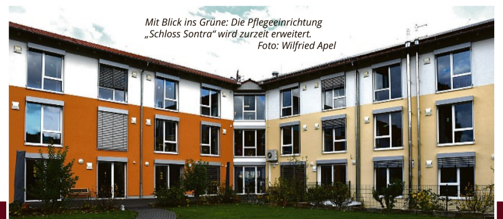
Mit Blick ins Grüne: Die Pflegeeinrichtung „Schloss Sontra“ wird zurzeit erweitert.