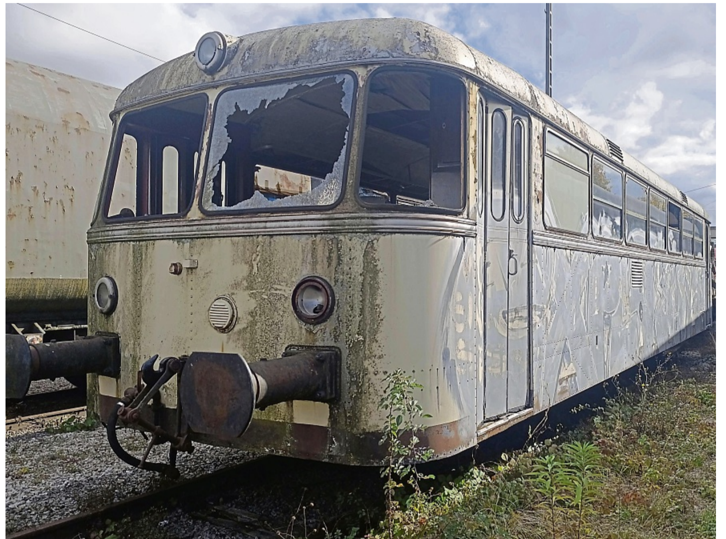
Vom Zahn der Zeit gezeichnet: Eisenbahnfreunde wollen den 66 Jahre alten Schienenbus VT 52 der ehemaligen Hersfelder Kreisbahn erhalten und aufarbeiten.

Ihre Schienenbusse setzte die Hersfelder Kreisbahn nicht nur