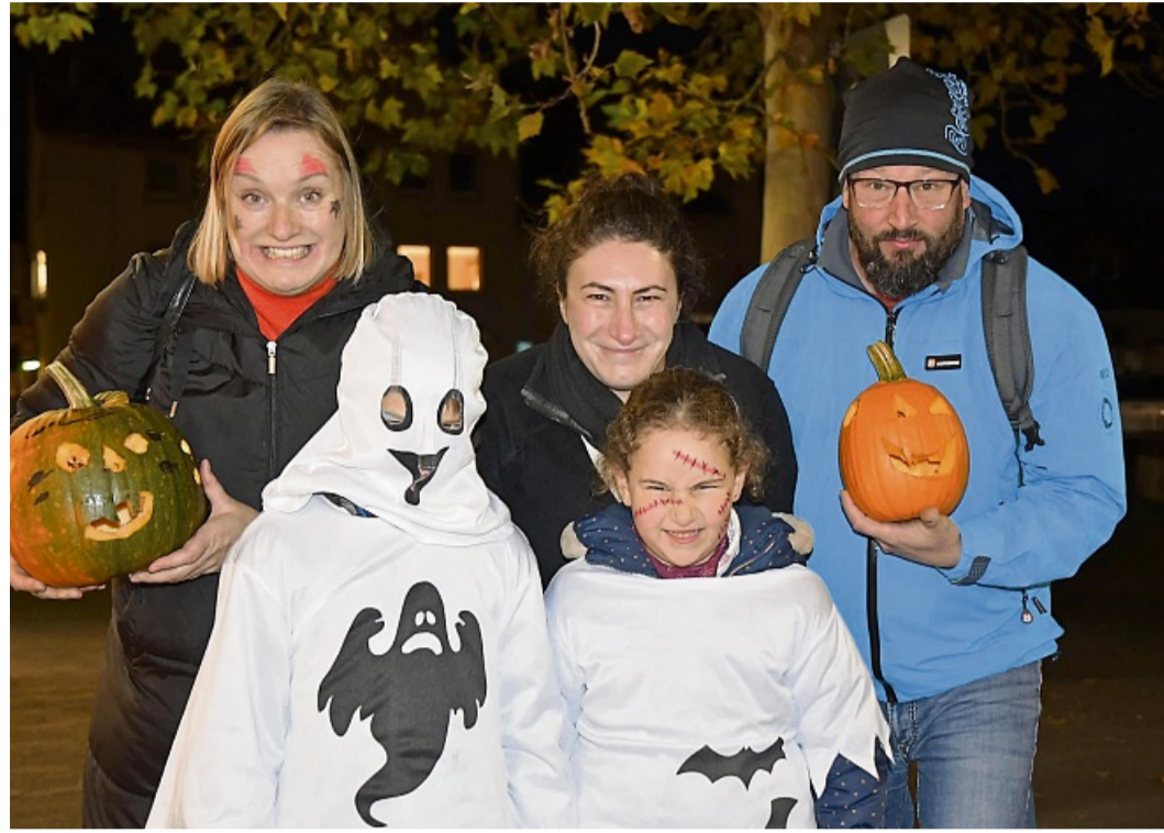
Kreativ zum Halloween-Fest: In Bebra kostümierten sich nicht nur Kinder, auch die Eltern gaben alles und hatten manchmal sogar Kürbisse parat. Weitere Bilder unter hna.de/rotenburg

Neben Verkaufswagen und Ständen, an denen man Süßes, Saures, Gruselspieße, Monsterburger, mit Augäpfeln garnierte Köstlichkeiten kaufen, aber auch Bratwurst verspeisen und Getränke zu sich nehmen