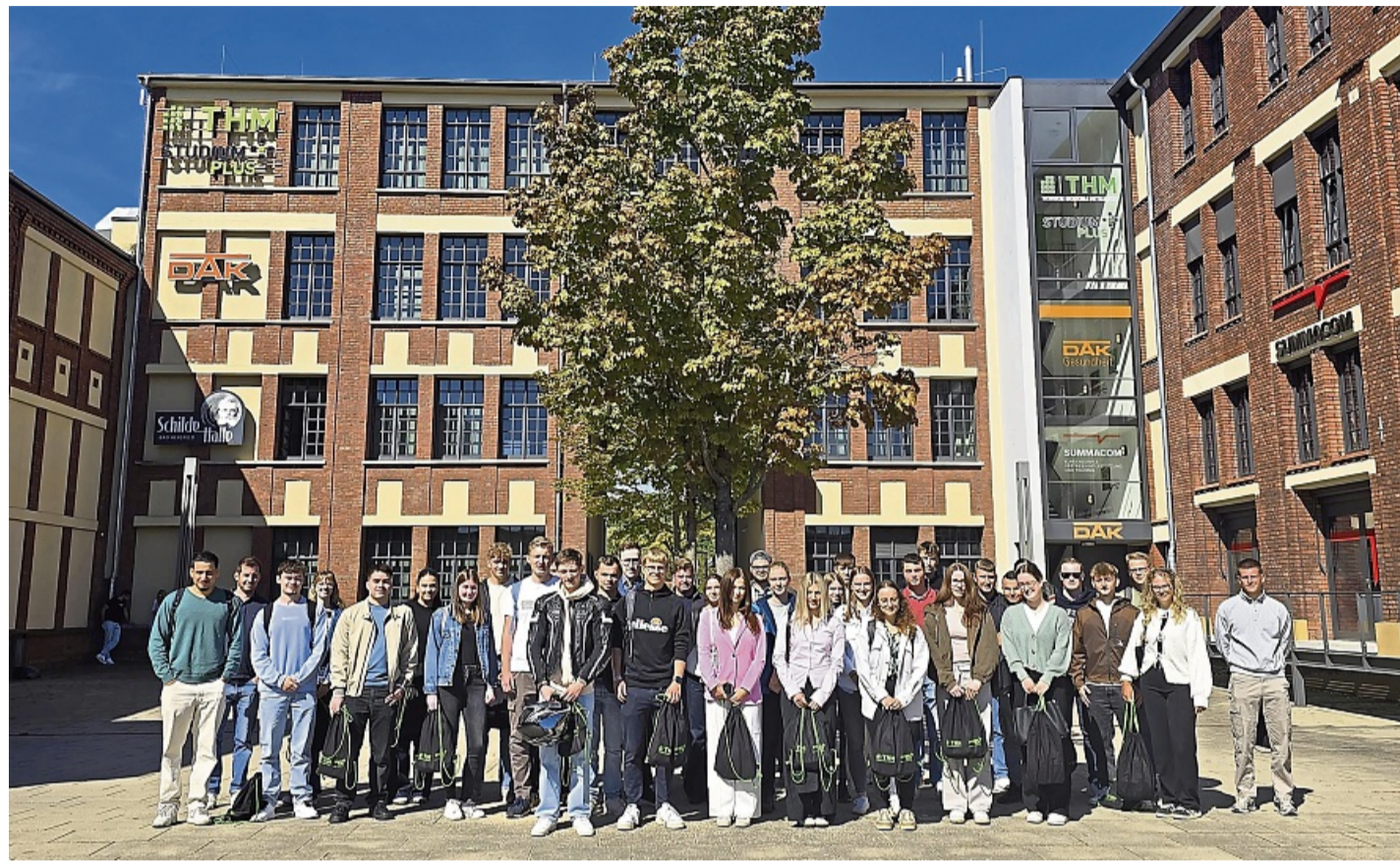
Insgesamt 46 duale Studierende starten bei StudiumPlus ihr duales Studium am Campus Bad Hersfeld.