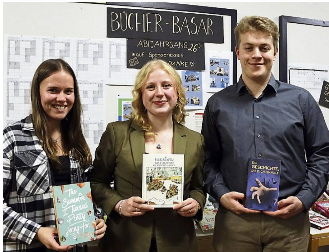
Bücher gegen Spenden: Basar des Abiturjahrgangs 2026.