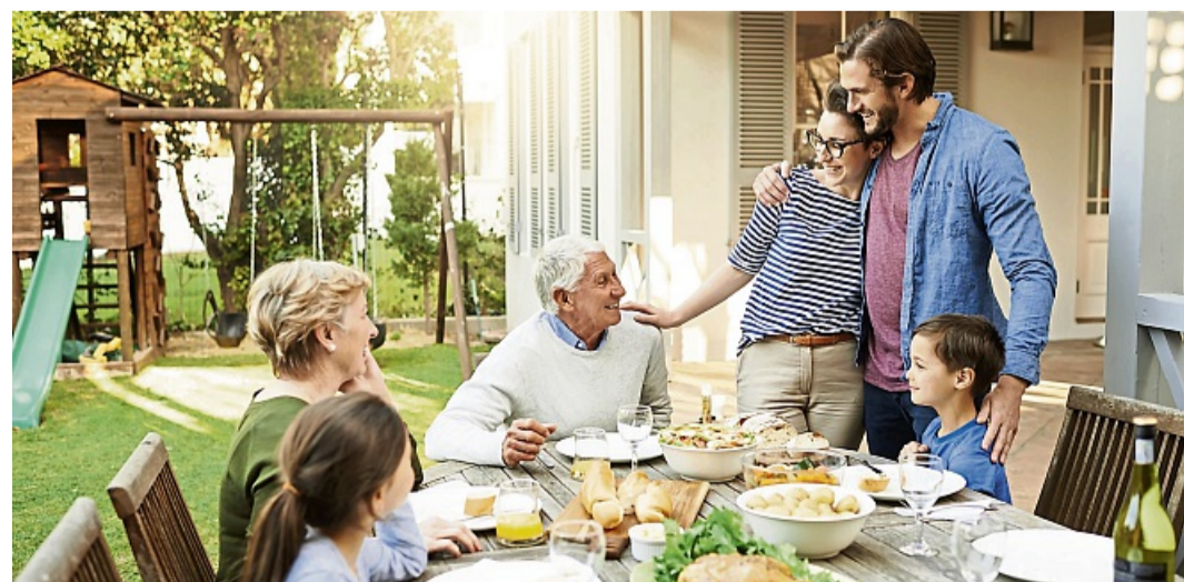
Eltern können Streitigkeiten um das Erbe vermeiden, indem sie klug vorsorgen und ihren Nachlass sorgfältig regeln – organisatorisch wie finanziell.

lebensversicherung die Freibeträge nicht belasten“, so die Experten. Ein wertvoller Tipp ist hier die „Risikolebensversicherung über Kreuz“. Dabei schließen zwei Versicherte separate Verträge auf das Leben der anderen Person ab. Verstirbt eine Person, erhält die andere als Versicherungsnehmer die Versicherungssumme, ohne dass dafür Erbschaftsteuer anfällt. Der Clou dabei: Die Auszahlung gilt nicht als Erbe, sondern als Vertragsleistung. Mit dem Geld kann der Erbe des Elternhauses etwa fällige Erbschaftsteuern und mögliche Pflichtanteile von Miterben begleichen. Eltern können also über ihren Tod hinaus dafür sorgen, dass das Haus im Familienbesitz bleibt und einen Familienstreit verhindern. djd