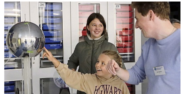
Das brizzelt: Selbstversuch bei den Naturwissenschaften.