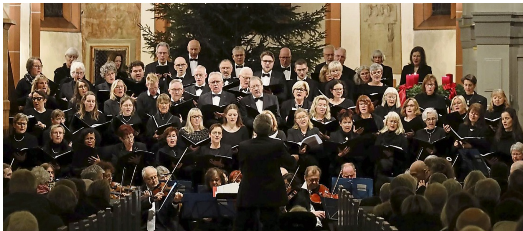
Der Chorverein singt Wolfgang Amadeus Mozarts „Requiem“ am Volkstrauertag, 16. November, in der Stadtkirche.

Im Mittelpunkt des Konzerts steht Mozarts „Requiem“, seine letzte Komposition, über der er am 5. Dezember 1791 in Wien verstarb. Das Werk entstand im