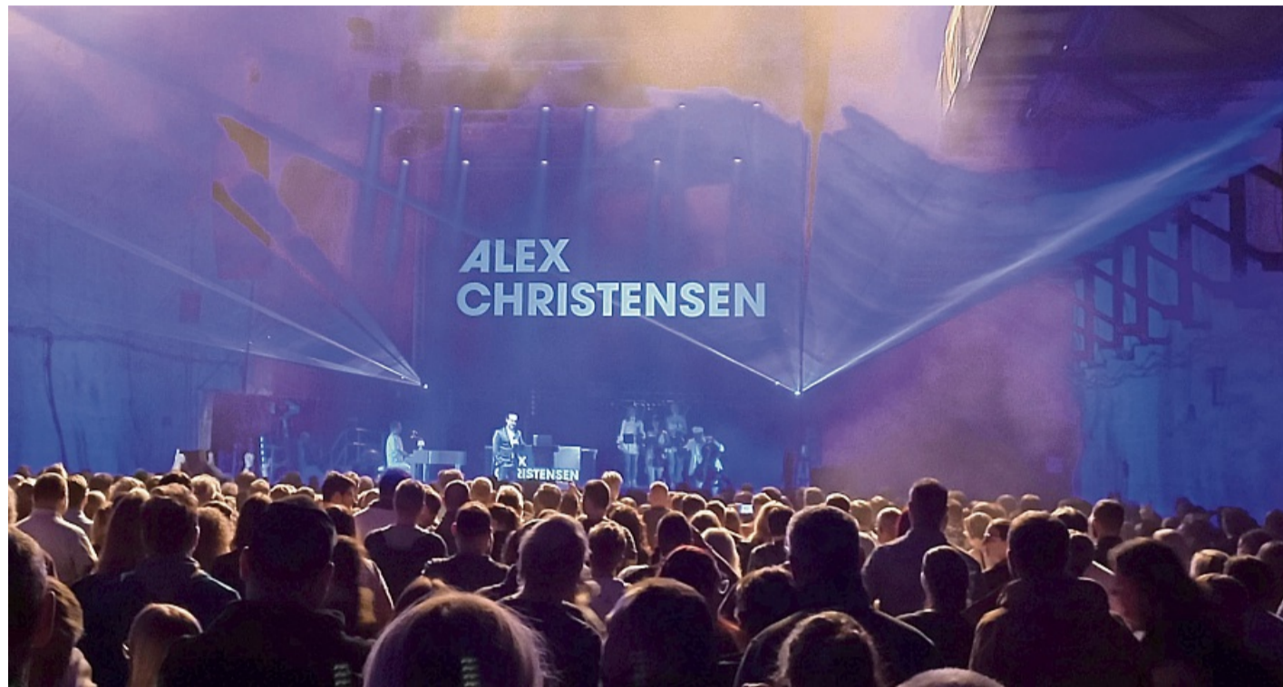
Über 2500 Fans pilgerten an zwei Tagen in den tiefsten Konzertsaal Europas.

Vom ersten musikalischen Takt an hieß es also Partystimmung im Erlebnisbergwerk und das Publikum ließ sich nicht lange bitten. Mit viel guter Laune und bester Stimmung huldigte es dem Meister des Soundtracks der 90-er Jahre. Voller Freude zelebrierten die Konzertbesucher mit dem Hit von Christensen & Friends und die Woge der Begeisterung erfasste schnell den untertägigen