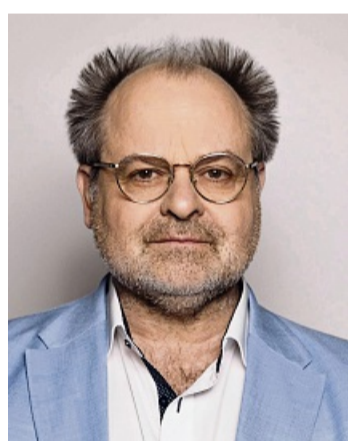
Der Komödiant Markus Majowski kommt Ende November nach Rotenburg.

Die Veranstaltung gehe über eine klassische Lesung hinaus: Majowski setze seine Texte mittels schauspielerischer Darbietung und stimmlicher Nuancierung in Szene. Wie aus einer Pressemitteilung hervorgeht, probe er aktuell mit den Rotenburger Borchschissern.