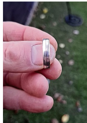
Wieder da: Der auf dem Sportplatz in Wölf verloren gegangene Ehering.