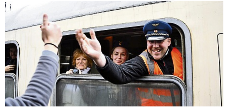
Bei zwei ICEs wäre das nicht möglich gewesen: Fröhliches Shake-Hands bei einer fliegenden Überholung auf der Cornberger Rampe.