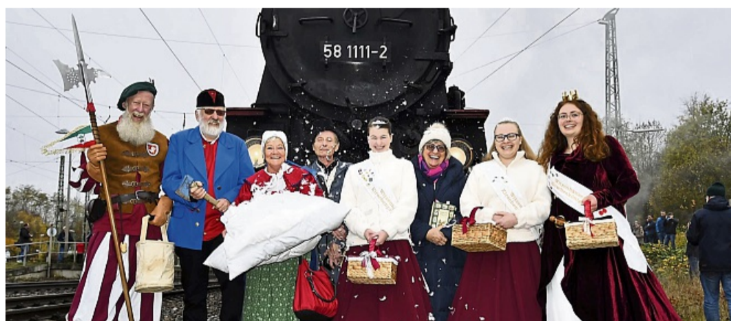
Wie im Märchen: In Eichenberg lässt es Frau Holle zur Freude der für Städte der Grimmheimat Nordhessen stehenden Originale schnell mal schneien.