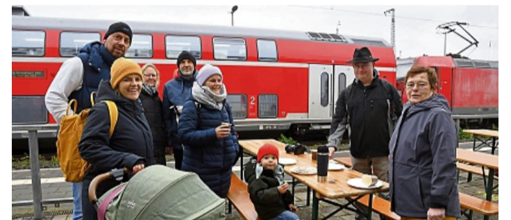
Familienausflug: Eisenbahnfahren oder nach Dampflokenthusiasten Schauen macht hungrig, durstig und manchmal auch ein bisschen müde.