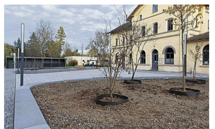
Der neue Bahnhofsvorplatz in Sontra erstrahlt in neuem Glanz. Nach sechs-monatiger Bauzeit eröffnet er am 22. November.

tra liegt damit bei 194.389 Euro. Am Einweihungstag bestehe erstmals auch die Gelegenheit, sich persönlich ein Bild vom sanierten Bahnhofsgelände zu machen, das in diesem Jahr sein 150-jähriges Jubiläum feiert.