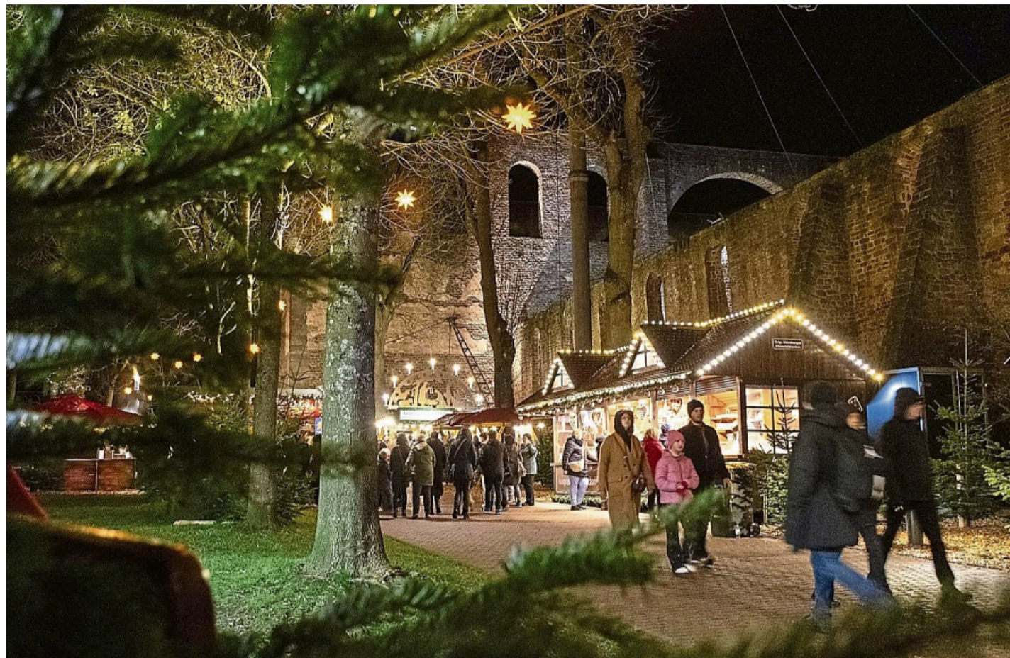
Die einmalige Atmosphäre im Stiftsbezirk macht den „Weihnachtsmarkt der Träume“ jedes Jahr zu etwas ganz Besonderem.