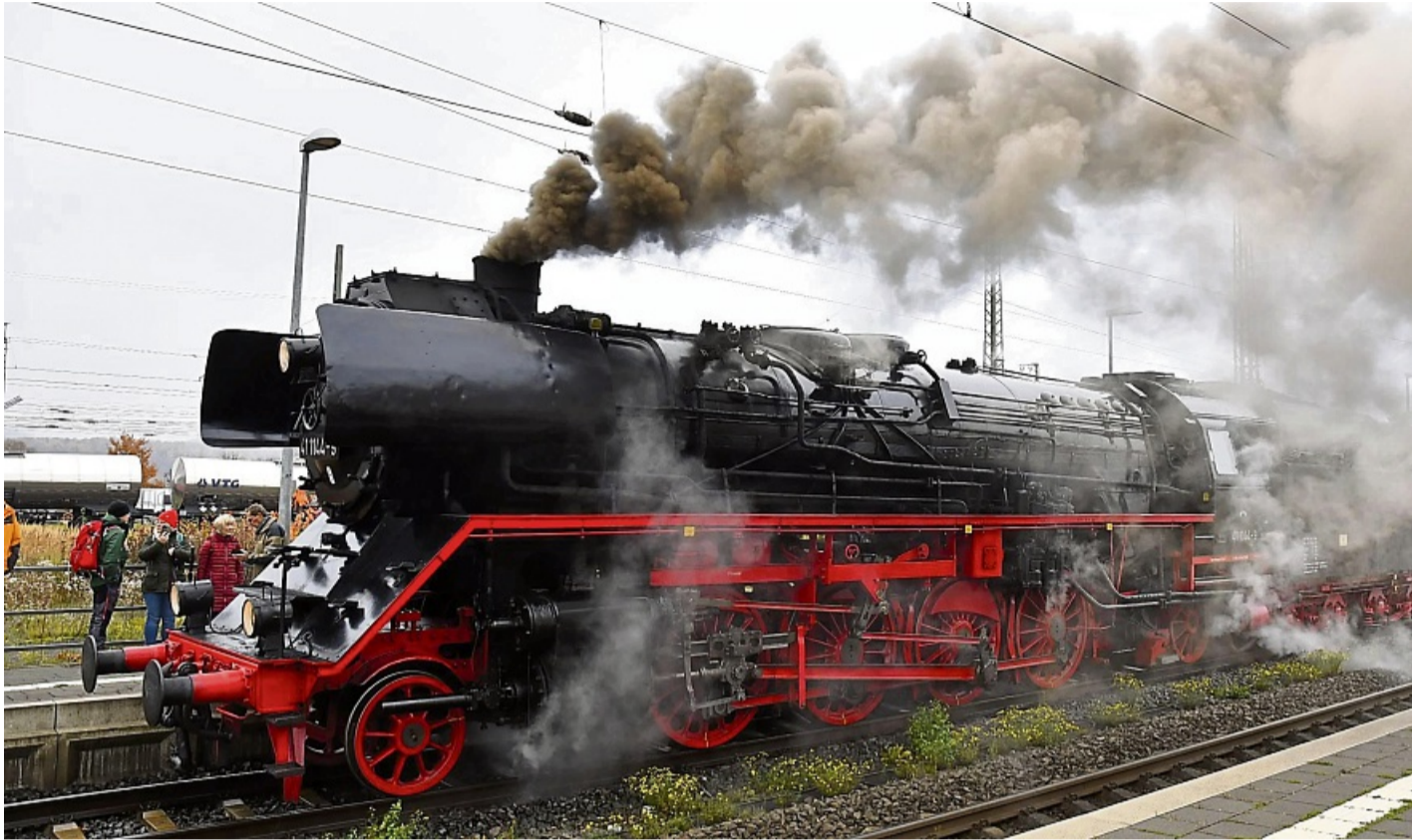
Kurz vor der Abfahrt der 41 1144-9 in Richtung Gerstungen: Man ahnt, dass zum Trocknen aufgehängte Wäsche in Bebra früher schnell mal einen „Grauschleier“ bekam.

Hunderte Eisenbahnfans erleben beim Dampfloktreffen nostalgische Technik und kräftige Lokomotiven