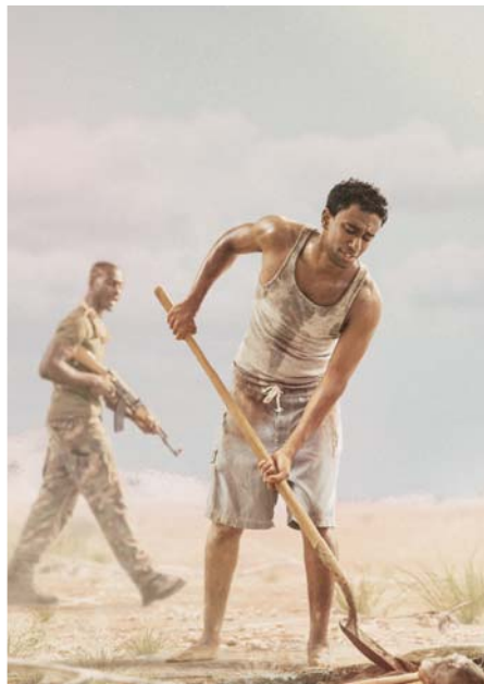
Jehova wird seine treuen Diener von Leid befreien (Siehe Absatz 13)

ne besonders enge Bindung. Sie bedeuten ihm so viel, dass er sich regelrecht danach sehnt, sie zum Leben zurückzubringen, falls sie sterben. Er wird den Schmerz, der durch den Tod verursacht wurde, vollständig heilen (Jes. 65:17).