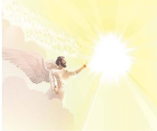
Jehova erlaubte Satan in Gegenwart anderer, seine Behauptungen unter Beweis zu stellen (Siehe Absatz 8-9)

6. Woran sieht man, dass Jehova bei der Versammlung im Himmel alles unter Kontrolle hatte? (Hiob 1:7, 8).