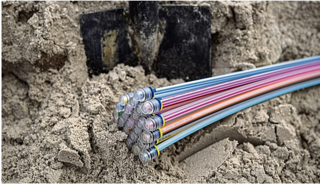
Lässt weiter auf sich warten: Glasfaser Plus hat sich von seinem bisherigen Partner für den Ausbau von Hausanschlüssen in Schenklengsfeld und Mansbach getrennt.