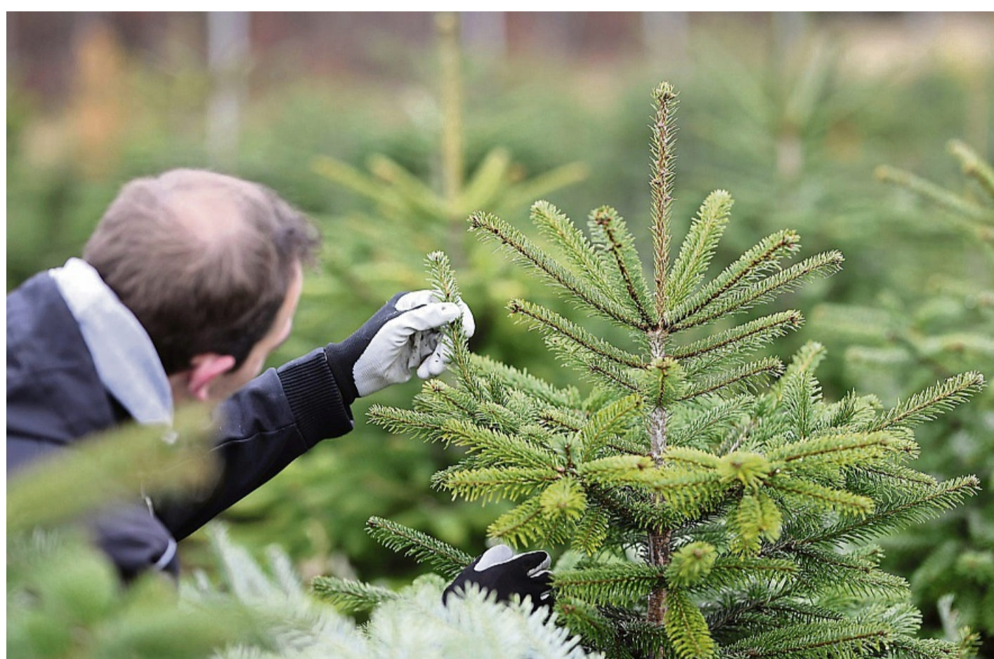
Tannen werden teurer: Ein Mitarbeiter begutachtet auf einer Weihnachtsbaumplantage eine Nordmannanne.