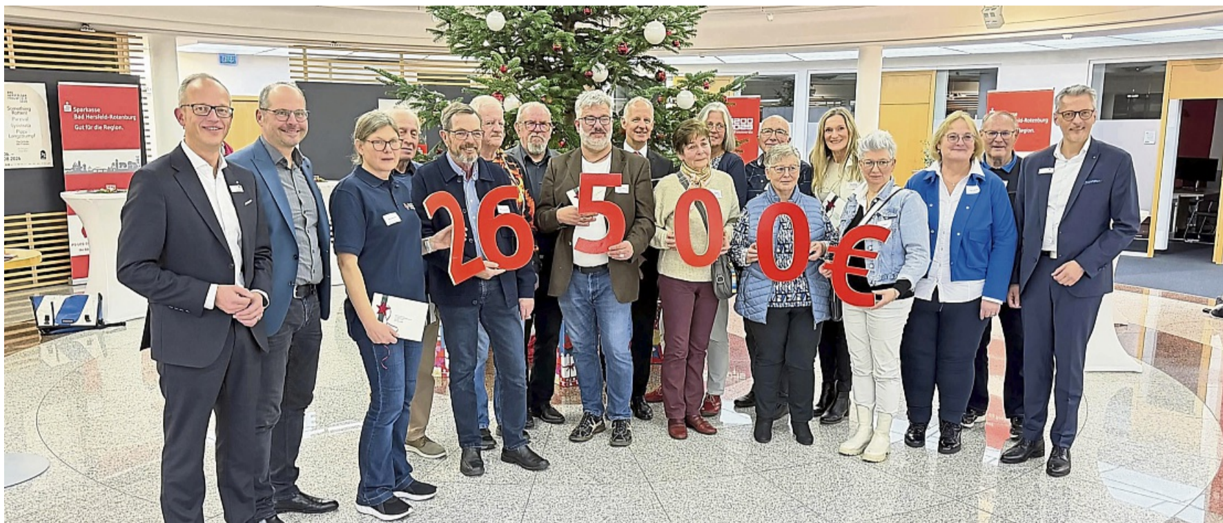
Sparkasse würdigt karitative Vereine: Gruppenbild mit den Vereinsvertretern und der Chefetage Sparkasse Bad Hersfeld-Rotenburg.