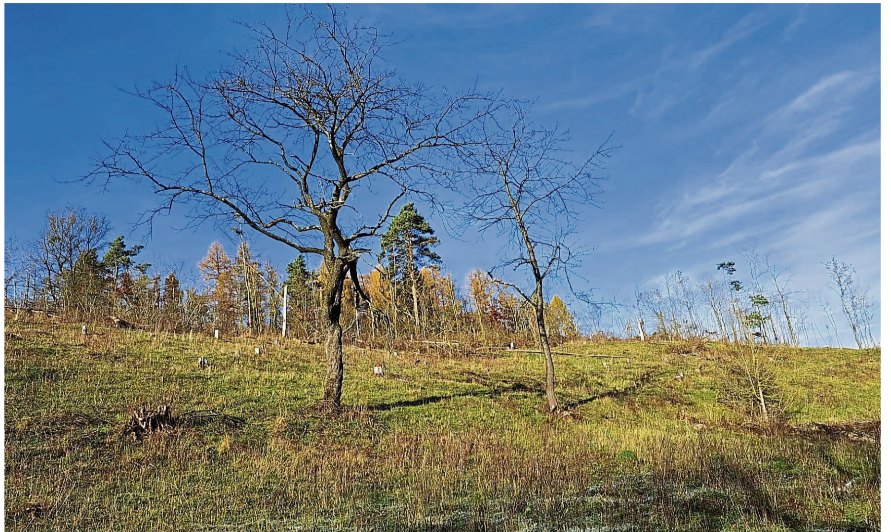
Auf dem Hesselkopf bei Solz zeigt sich der freigestellte Kalkmagerrasen wieder offen und licht – ein Ergebnis der jüngsten Pflegemaßnahmen, bei denen Kiefern und Gehölze entfernt wurden, damit sich die typische Vegetation erholen kann.

Am Hesselkopf wurden nach Verbandsangaben rund 200 Festmeter Kiefern aus einer etwa 7000 Quadratmeter großen Fläche geholt. Das Holz wurde möglichst schonend per Seilwinde aus dem Hang gezogen.