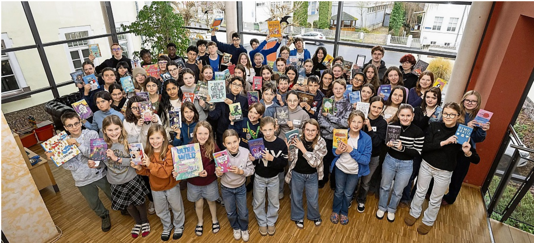
Literanauten mischen mit: Beim bundesweiten „Literanauten“-Treffen in Bad Hersfeld entwickelten rund 70 Jugendliche Ideen für Demokratie, Teilhabe und Leseförderung.