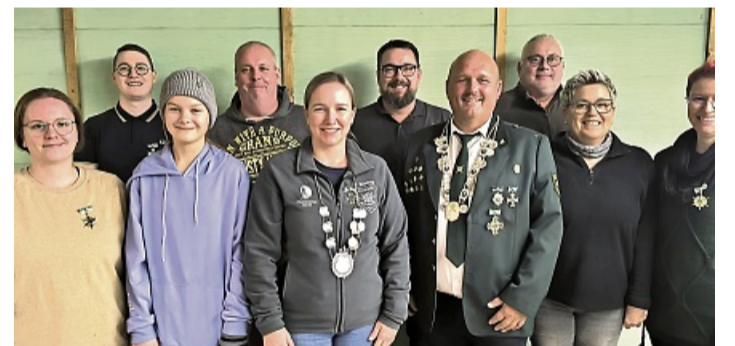
Das neue Königshaus im SV Diana 55 steht fest und hat beim Schießen ganze Arbeit geleistet.

SV Diana 55 Obersuhl hat neues Königshaus