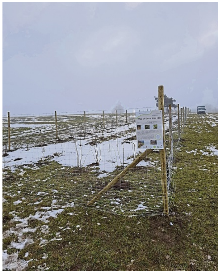
Mit Wildzaun und Infoschild: Entlang einer Grundstücksgrenze wurde eine fünfreihige Hecke neu angelegt.

Den Erhalt der Kulturlandschaft am Eisenberg sichern die örtlichen Landwirte durch Mahd und Beweidung. Hecken brauchen zusätzlich eine regelmäßige Pflege. In diesem Jahr wurden vom Landschaftspflegeverband verschiedene Maßnahmen am Eisenberg umgesetzt. Im Bereich Neuenstein-Salzberg wurden die Hecken abschnittsweise auf den Stock gesetzt. Die Abschnitte sind höchstens 30 Meter lang und umfassen maximal ein Drittel der Hecke. So bleibt stetig ausreichend Lebensraum für die Vogelarten erhalten. Große Bäume – darunter auch Fichten – wurden entfernt, um die Heckenstrukturen zu stärken. So erhalten die Hecken mehr