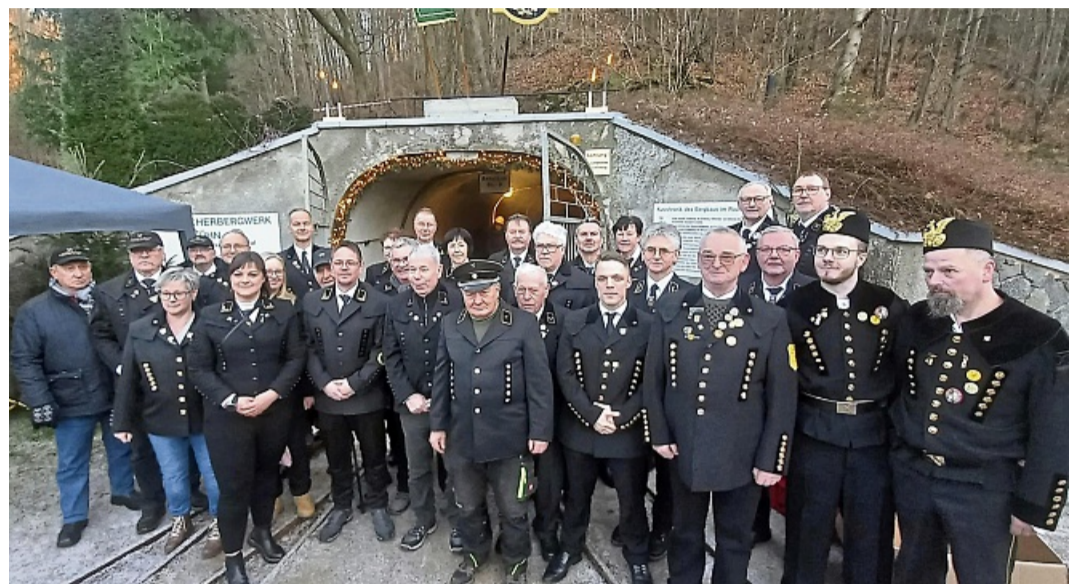
Bergmännische Brauchtumpfleger aus Heringen, Unterbreizbach und Trusetal bei der diesjährigen Mettenschicht am Bergwerk Hühn.

Bergmannsvereine besuchten gemeinsam die Mettenschicht in Trusetal