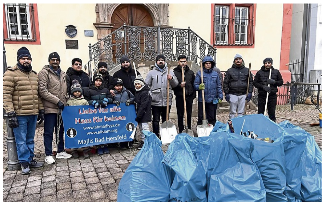
Sie sammelten auch auf dem Rotenburger Marktplatz Unrat ein: Teilnehmer der Putzaktion der Majlis Khuddam-ul Ahmadiyya.