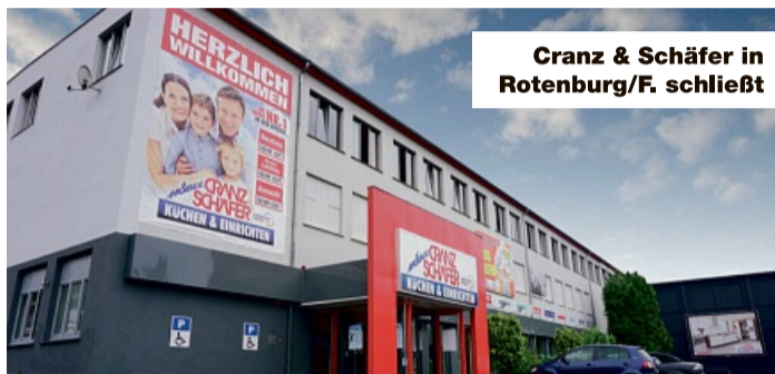
Cranz & Schäfer in Rotenburg/F. schließt

Die Geschäftsleitung von Möbel Cranz und Schäfer in Rotenburg/F. hat sich den Auftrag, den gesamten Warenbestand loszuwerden, wohl anders vorgestellt. Denn nach einigen Wochen Räumung ist noch immer zu viel Ware vorhanden und die Zeit sitzt ihr im Nacken. „Wir sind schon eine Menge an Ware losgeworden. Doch noch immer ist die Ausstellung voll. Jetzt haben wir erneut massiv die Preise gesenkt und wir verkaufen zu radikal reduzierten Preisen. Hauptsache das Möbelhaus wird leer.“ Das sind die Worte der Geschäftsleitung. Unter echten Schnäppchenjägern weiß man, was das bedeutet. Der Druck auf die Geschäftsleitung ist groß, so dass sie zu stark reduzierten Preisen verkauft. Die Geschäftsleitung hat nur ein Ziel: Alles muss raus. Daher purzeln die Preise. Um das Haus komplett zu räumen, gibt es ab sofort auf alles bis zu 69% Rabatt. „Ein Besuch lohnt sich. Es wird nicht einfach sein in den kommenden Tagen alles rauszuverkaufen“, so die Geschäftsleitung weiter. Das heißt, dass alles an Ware raus