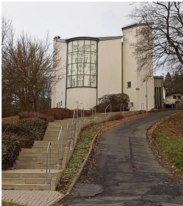
Die katholische Kirche „Zur schmerzhaften Mutter Gottes“ in Lisenhausen wurde vergangenen Monat entweihet und nun verkauft. Aus dem Gebäude soll ein Retreat-Zentrum mit Goldschmiedekursen werden.

Der Weg aus der Sakralität unterscheidet sich formal zwi-