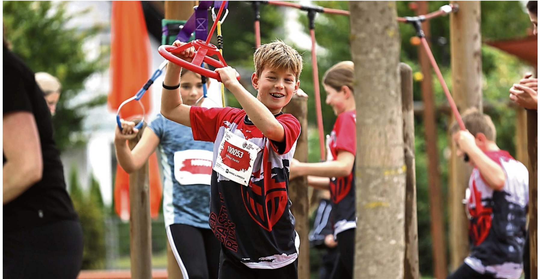
Klettern, kriechen, durchqueren: Teilnehmende überwinden beim Red Castle Run auf mehreren Strecken zahlreiche Hindernisse – auch 2026 soll der Hindernislauf in Rotenburg stattfinden.

Am bewährten Konzept hält der Veranstalter fest. Auf drei Strecken mit Längen von vier, acht und 16 Kilometern gilt es, bis zu 30 Hindernisse zu überwinden, zu erklettern oder zu durchschwimmen. Bereits direkt nach dem sechsten Rotenburger Red Castle Run gingen die ersten 150 Anmeldungen ein. Bis zum Meldeschluss werde sich diese Zahl – dem Trend der vergangenen Jahre folgend – mehr als verzehnfachen. Beim jüngsten Durchgang gingen 1500 Teilnehmende an den