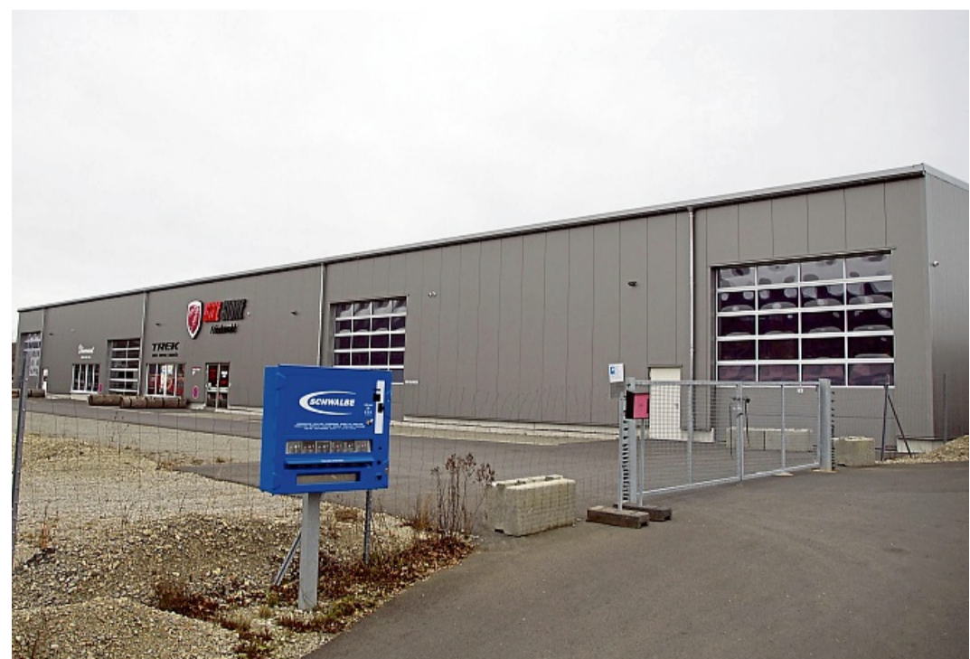
Trotz Insolvenzverfahrens setzt der Bike-Store Friedewald seinen Geschäftsbetrieb nach der Winterpause fort.