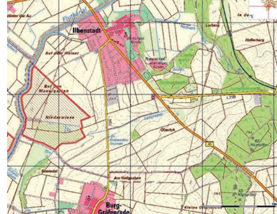
Karte: Schraffierte Fläche des Betretungsverbots vom 1. März bis zum 30. Juni 2019

Da auf den umliegenden befestigten Wegen jederzeit die Möglichkeit zur Naherholung besteht und das Betretungsverbot des Feuchtwiesengebietes nur auf den Zeitraum vom 1. März bis zum 30.