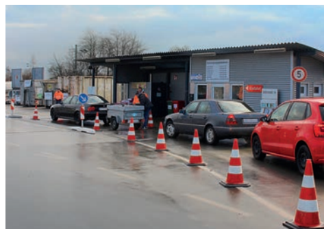
Die Wetterauer Recyclinghöfe erheben künftig eine Pauschale für Kleinmengen.

„Außer der leider notwendig geworden Einführung der Pauschale für Kleinmengen bis 40 Kilogramm ändert sich an unseren Gebühren nichts. Es bleibt auch dabei, dass viele Abfälle kostenlos an unseren Recyclinghöfen angenommen werden“, betont Dr. Roth. Kostenfrei können Altkleider, CDs und DVDs, Druckerpatronen und Tonerkartuschen, Elektroaltgeräte, Gerätebatterien, Flach- und Hohlglas, Korken, LED- und Energiesparlampen, Leichtverpackungen, Metallschrott sowie Papier, Pappe und Kartons an allen Recyclinghöfen abgegeben werden. Der Hof in Niddatal nimmt darüber hinaus auch Hartkunststoffe aus Polyethylen (PE) und Polypropylen (PP) kostenlos an.