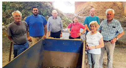
Teilnehmer der Juni-Führung, die anlässlich des Tages der Daseinsvorsorge angeboten wurde

Zuschauen, wie der Wetterauer Bioabfall zu Strom und Kompost wird