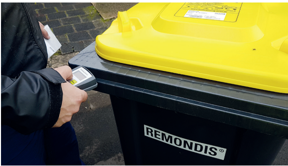
Jede Tonne erhält einen Aufkleber mit der Adresse (Ort, Straße und Hausnummer).

Die Sammlung des Verpackungsabfalls wird im Wetteraukreis auf Hochtouren neu organisiert. Statt in Säcken wird dieser Abfall künftig in Gelben Tonnen gesammelt, sauberer und zuverlässiger als bisher. Bis zum Jahresende sollen alle Wetterauer Haushalte mit den neuen Tonnen versorgt sein. In der östlichen Wetterau sind die Behälter bereits verteilt worden.