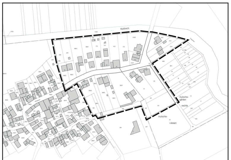
Bauleitplanung der Stadt Niddatal, Stadtteil Ilbenstadt

Bebauungsplan I 3 „Im Auloch“ – 1. Änderung und Erweiterung