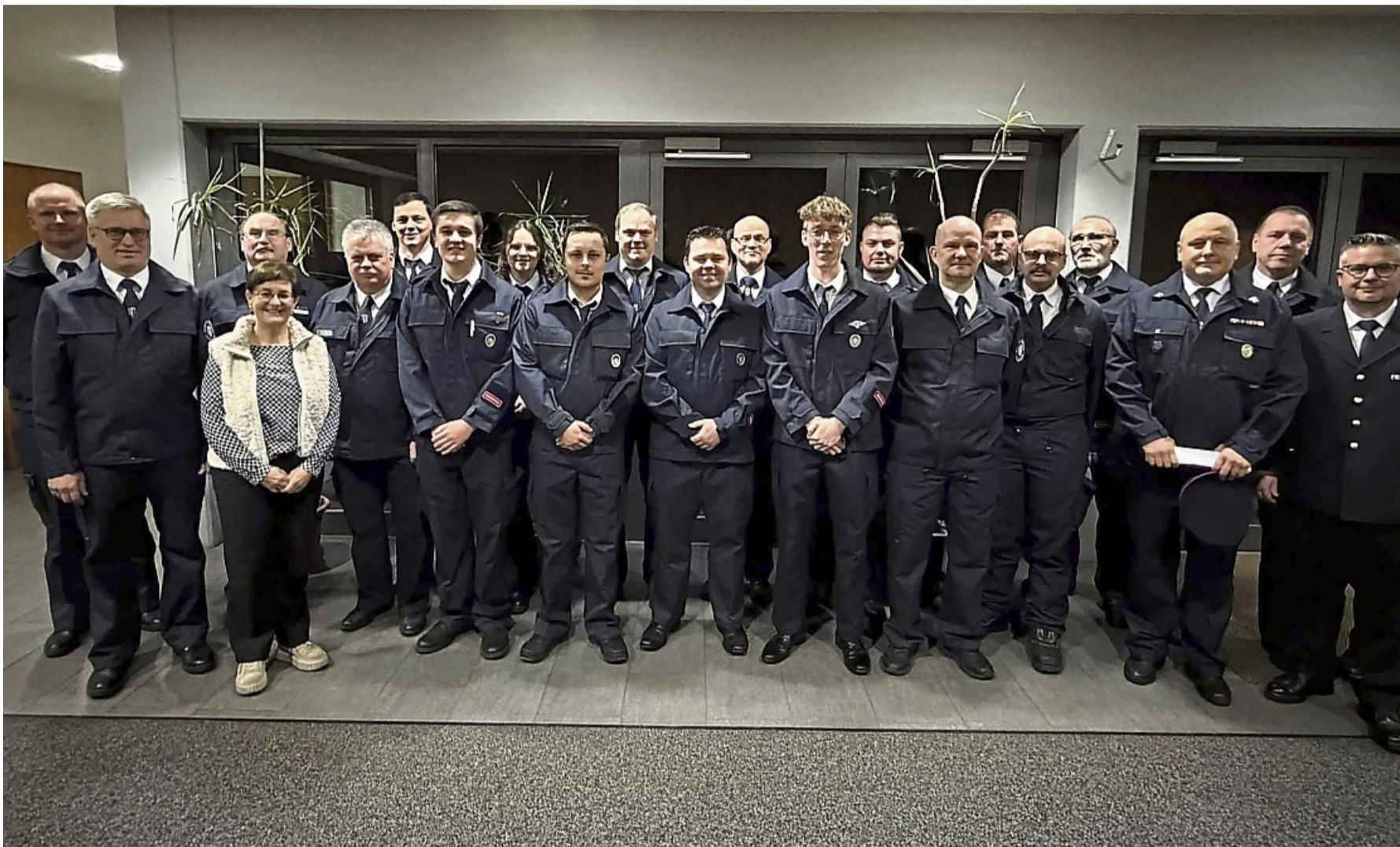
Glückwunsch: Die während der Jahreshauptversammlung der Bad Hersfelder Feuerwehren ausgezeichneten Einsatzkräfte.

Bad Hersfelder Feuerwehren ziehen in gemeinsamer Jahreshauptversammlung Bilanz