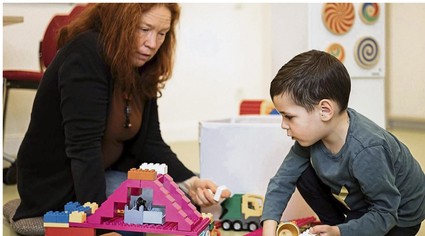
Das Café der kleinen Schätze wird fortgesetzt. Während Eltern sich beraten lassen, können die Kinder derweil unter Aufsicht spielen.

„Besonders für Familien ist das Angebot sehr wertvoll. Sie erhalten Beratungen zu verschiedenen sozialen Leistungen gebündelt an einem Ort – und gleichzeitig ist die Kinderbetreuung gesichert. Zudem findet alles in einer sehr entspannten Atmosphäre statt, was die Familien enorm schätzen. Der bisherige Höhepunkt war das Sommerfest, was viele interessierte Besucherinnen und Besucher aus dem gesamten Landkreis anlocken konnte“, erklärte der Erste Kreisbeigeordnete und Sozialdezernent, Dirk Noll.