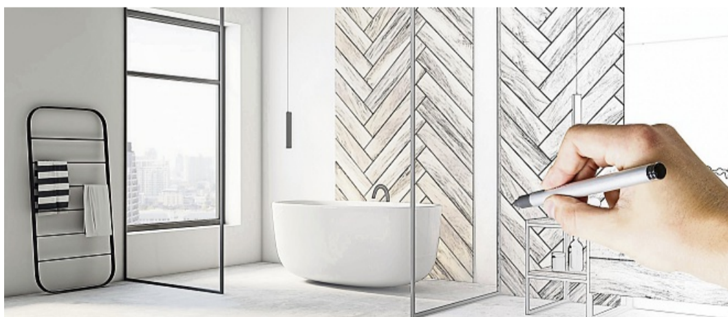
Fachbetriebe bieten alle Leistungen für eine Komplettbadmodernisierung aus einer Hand – von der ersten Planungsphase bis zur sauberen Übergabe des neuen Bads.

So gelingt die Komplettisanierung im Eigenheim weitestgehend stressfrei