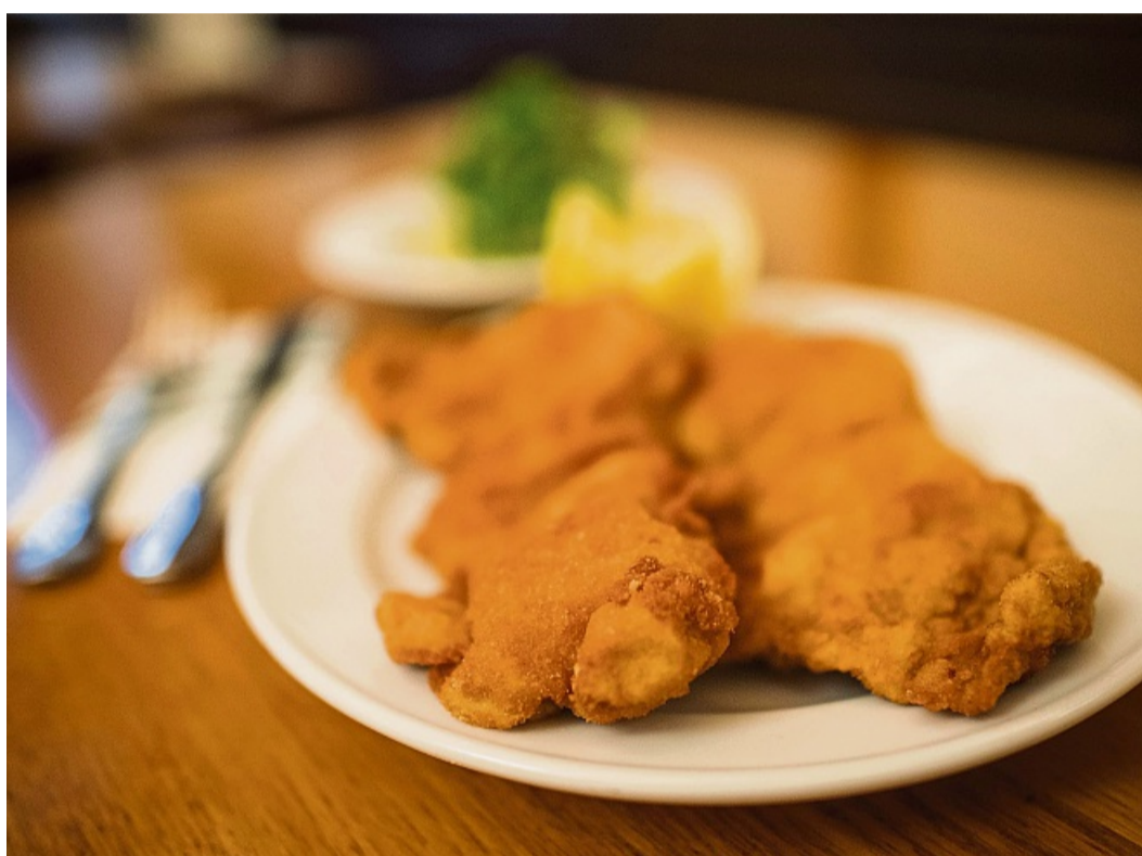
Die Kosten für Schnitzel und Pommes im Restaurant sinken, aber die Preise geben nicht nach.

Denn gleichzeitig zum Steuernachlass zum Jahresstart gibt es eine neue Hürde für die Gastronomie: Der Mindestlohn steigt auf 13,90 Euro. Bisher waren es 12,82 Euro. „Die Mindestlohnerhöhung ist eine erhebliche Belastung, besonders für kleine und mittlere Betriebe“, sagt Reichenauer. Dazu kommen ständig steigende Kosten für Energie und Einkäufe. Um das auszugleichen, werden die Extraprozente dringend benötigt, erklärt der Kreis-Dehoga-Chef. Immerhin haben die Kostenschübe schon viele Betriebe zur Aufgabe gezwungen, weiß Hotelier Achim Kniese aus Bad Hersfeld. Er sieht die Steuersenkung für seine Hotel-Restaurants in Bad Hersfeld und auf Norderney als längst überfällig: „Die Steuersenkung um 12 Prozent ist Existenzsicherung.“ Kniese rechnet die Ausgabensteigerung einmal vor: „Unsere Kosten sind seit der Zeit vor Corona und dem Ukrainekrieg um bis zu 30 Prozent gestiegen.“