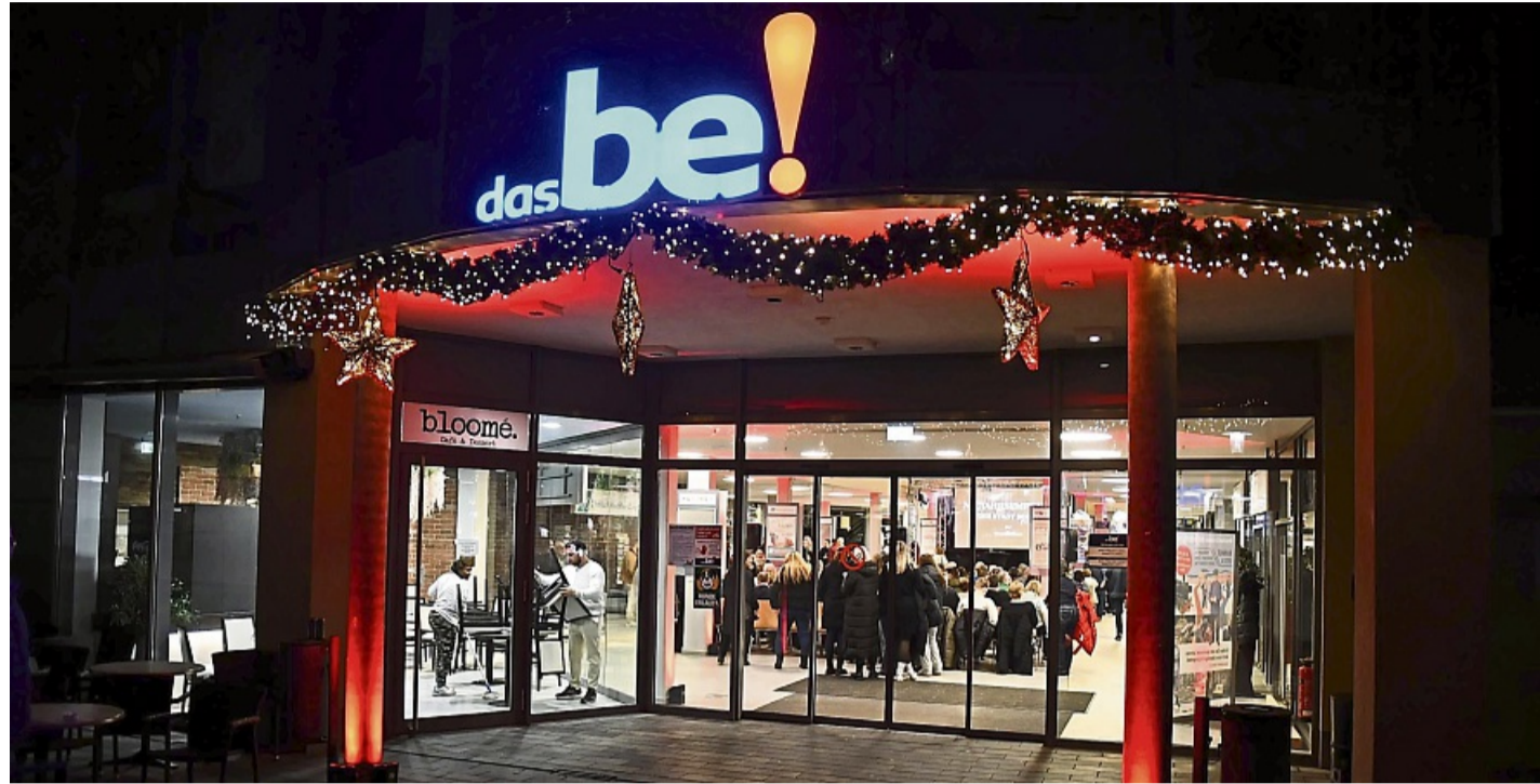
Erstmals fand der Neujahrsempfang der Stadt Bebra im Einkaufszentrum „das be!“ statt.

Umso wichtiger sei der Blick auf das eigene Umfeld. Auf das, was vor Ort funktioniere. Koch spricht über Engagement, über Ehrenamt, über Menschen, die Verantwortung übernehmen. Und über eine Innenstadt, die