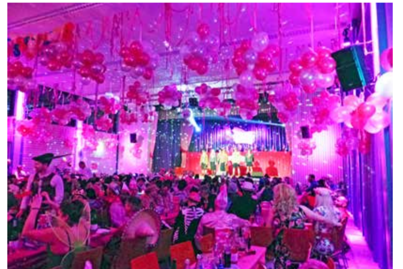
Rosa Sitzung im Bürgerhaus Ginsheim mit rosa geschmücktem Saal

Die Rosa Käppscher – Seit 2016 lädt der queere Fastnachtsverein „Die Rosa Käppscher“ zu seinen „Rosa Sitzungen“ in das Bürgerhaus Ginsheim ein. Karten für die Sitzungen sind immer schnell vergriffen. Daher bietet der Verein nun eine weitere Sitzung am 08.02.2026 um 15:11 Uhr an. Interessierte sollten die Chance nutzen und sich schnell Karten unter www.rosa-kaeppscher.de sichern.