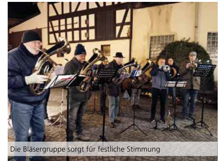
Die Bläsergruppe sorgt für festliche Stimmung

Den ersten Akzent für die kommenden Festtage setzte am 29. November 2025 der traditionsreiche Schloßborner Weihnachtsmarkt . Spätestens hier begann für die Bürger der Gemeinde eine Vorweihnachtszeit, die von weiteren festlichen Ereignissen in den anderen Ortsteilen geprägt ist. Der Heimat- und Geschichtsverein Schloßborn organisierte die Veranstaltung. Ab 15.00 Uhr konnten die Besucher die weihnachtliche Atmosphäre genießen und wiederum zahlreiche Angebote und kulinarische Leckereien genießen.