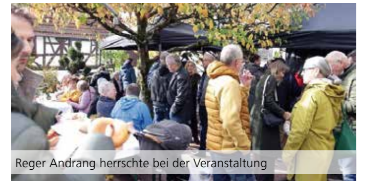
Regier Andrang herrschte bei der Veranstaltung