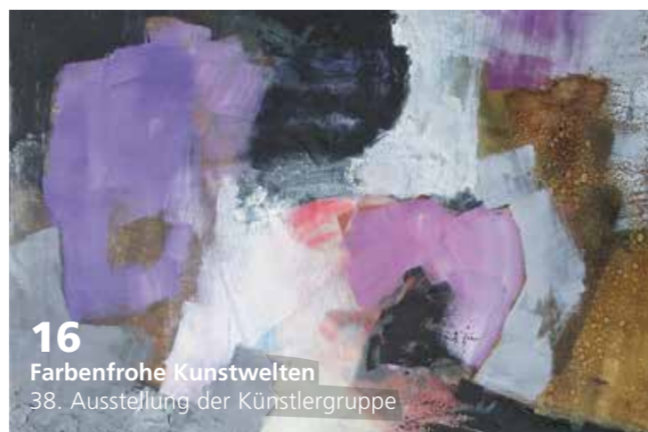
16 Farbenfrohe Kunstwelten 38. Ausstellung der Künstlergruppe