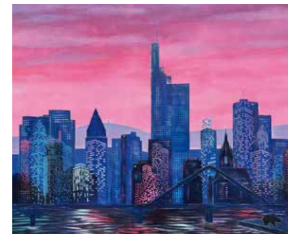
Pascale Ihler - Stadtträume im Abendrot