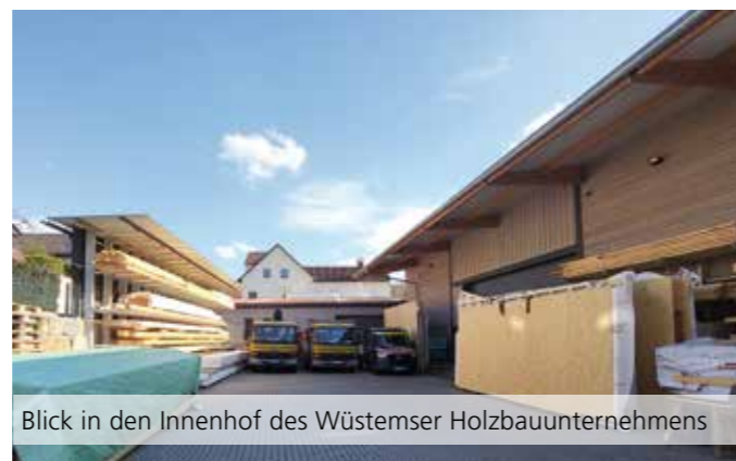
Blick in den Innenhof des Wüstemser Holzbaubetriebes

Weitere Informationen: holzbau-reuter.com