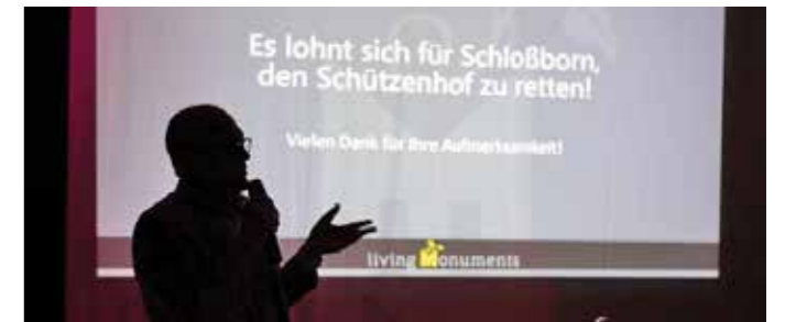
Eine Multimedia-Show zeigte Visionen einer Neubelebung