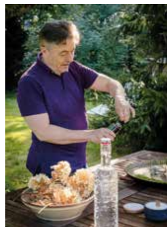
09 Lecker aus Oberems Alles ist handgemacht