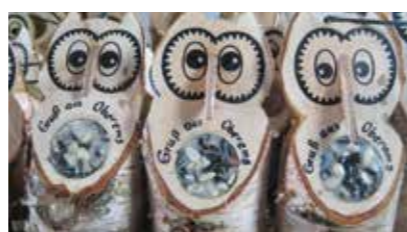
21 Festlicher Glanz Weihnachtsmärkte bieten viel selbst Gefertigtes an