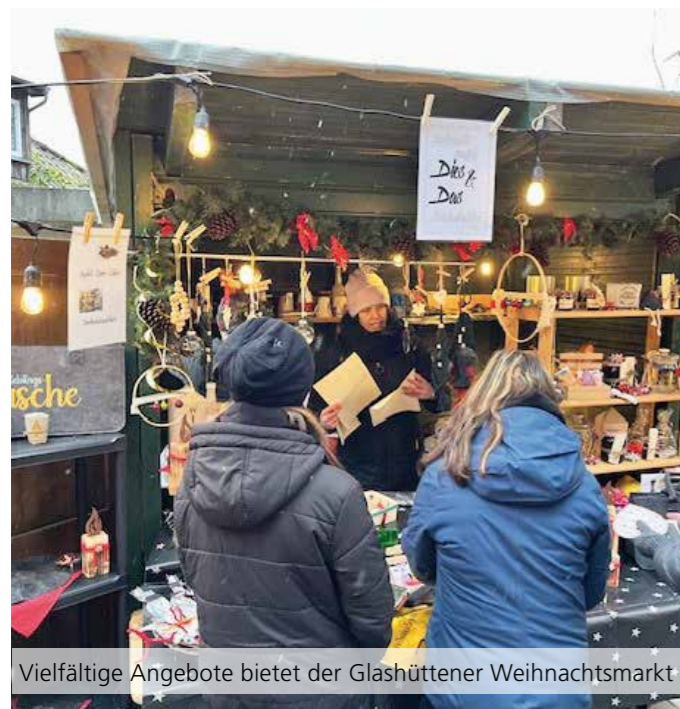
Vielfältige Angebote bietet der Glashüttener Weihnachtsmarkt

Der Glashüttener Weihnachtsmarkt zieht dieses Jahr um – vom Waldrand Richtung Tal und findet auf dem Kleinsportfeld des SC Glashütten unterhalb der Sporthalle statt. Und er hat einen neuen Titel erhalten: „Hüttenzauber beim SC“. Am 3. Adventswochenende 13./14. Dezember 2025 erwartet die Gäste auch an dem neuen Standort ein gemütliches Markttreiben. Die Organisation obliegt dem SC Glashütten. Der Weihnachtsmarkt am Samstag beginnt um 16:00 Uhr, rechtzeitig zum