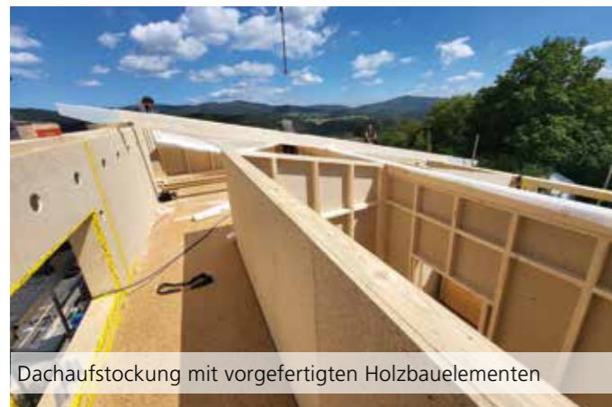
Dachaufstockung mit vorgefertigten Holzbauerelementen

Das Unternehmen ist heute breit aufgestellt und spe-