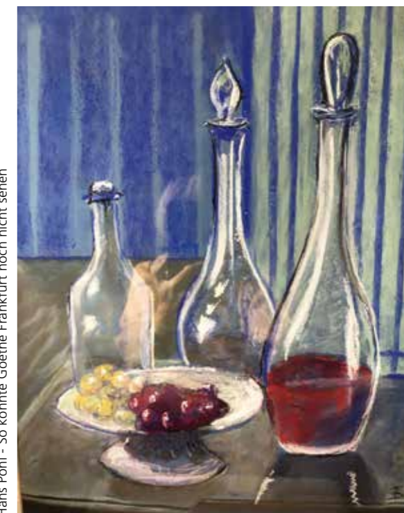
Francette Franck - Stilleben mit Karaffen