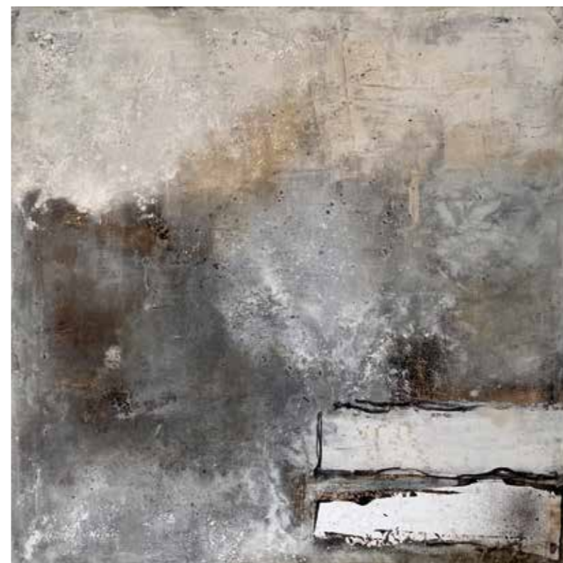
Erosion des Lichts Gudrun Auner