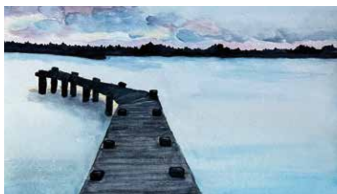
Evelyn Gier - Stille