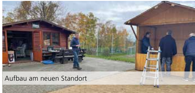
Aufbau am neuen Standort

Der Glashüttener Weihnachtsmarkt zieht dieses Jahr um – vom Waldrand Richtung Tal und findet auf dem Kleinsportfeld des SC Glashütten unterhalb der Sporthalle statt. Und er hat einen neuen Titel erhalten: „Hüttenzauber beim SC“. Am 3. Adventswochenende 13./14. Dezember 2025 erwartet die Gäste auch an dem neuen Standort ein gemütliches Markttreiben. Die Organisation obliegt dem SC Glashütten. Der Weihnachtsmarkt am Samstag beginnt um 16:00 Uhr, rechtzeitig zum