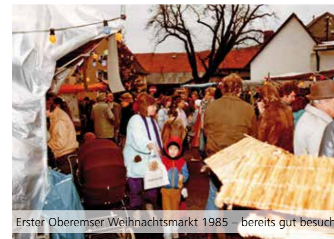
Erster Oberemser Weihnachtsmarkt 1985 – bereits gut besucht