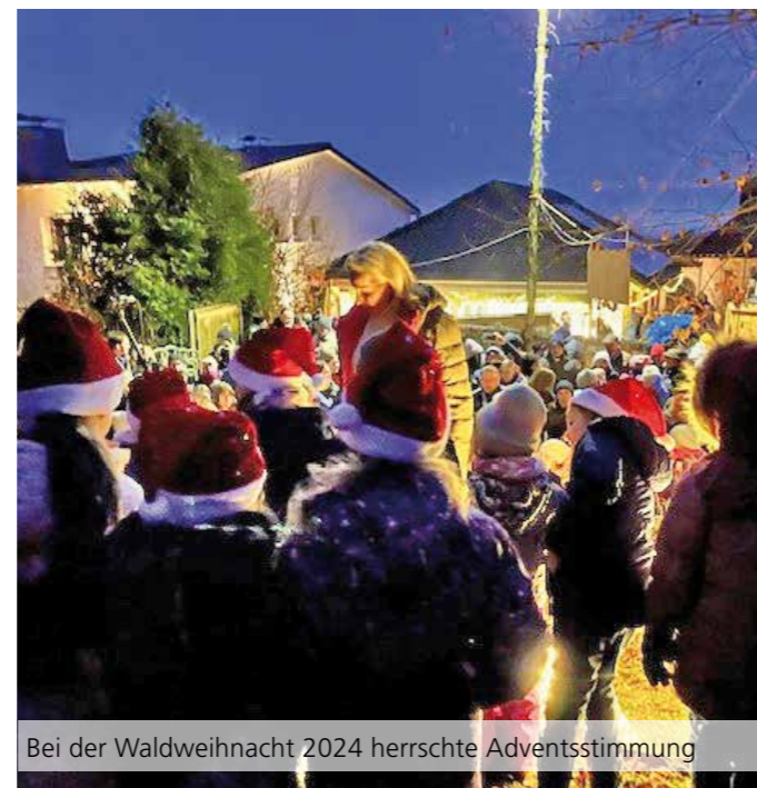
Bei der Waldweihnacht 2024 herrschte Adventsstimmung

Am Sonntag öffnen die Stände von 14:00 bis 20:00 Uhr.