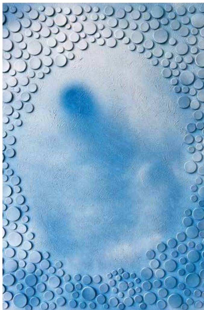
Seunghee Shin - Moleküle der Seele - Nacht

Wie immer zeigen wir hier eine Auswahl der Bilder. Weitere Informationen: kuenstlergruppe-glashuetten.de