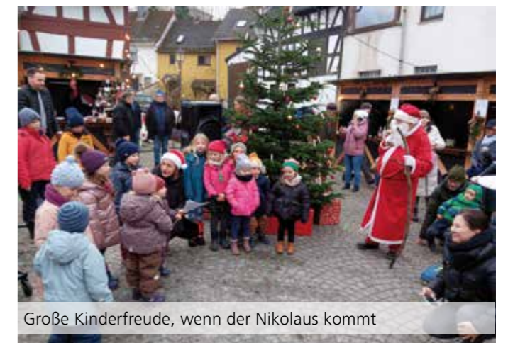
Große Kinderfreude, wenn der Nikolaus kommt