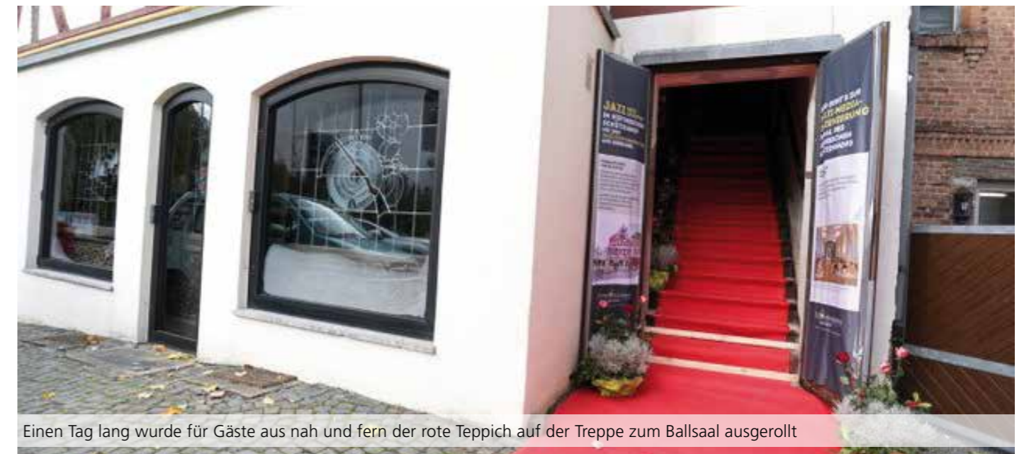
Einen Tag lang wurde für Gäste aus nah und fern der rote Teppich auf der Treppe zum Ballsaal ausgerollt