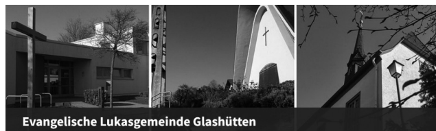
Evangelische Lukasgemeinde Glashütten

Bundesweit erreichbar über die gebührenfreien Telefonnummern: 0800 1110111 oder 0800 1110222