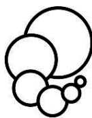
Kulturkreis Glashütten e. V.

Nach der beim Publikum in Glashütten besonders beliebten Pause folgte mit Kodály's Cellosonate aus dem Jahr 1915 ein wahrer Brocken der Celloliteratur – ein Werk, das nur selten im Konzert zu hören ist, weil es höchste technische und künstlerische Ansprüche an die Interpreten stellt und auch vom Auditorium hohe Konzentration und Aufnahmebereitschaft erfordert. „Dabei hat Kodály darin auch Elemente