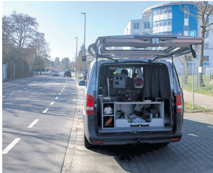
Das neue städtische Messfahrzeug im Einsatz.

Aktuell sind im Stadtgebiet sechs sogenannte Säulenblitzer installiert. Neu hinzugekommen sind zwei zusätzliche Kamerasysteme, die flexibel und je nach Bedarf in den vorhandenen Säulen eingesetzt werden können. Dadurch kann die Stadt an diversen Standorten im Wechsel messen und auf verschiedene Verkehrsschwerpunkte reagieren. Darüber hinaus wurde ein neues Messfahrzeug angeschafft.