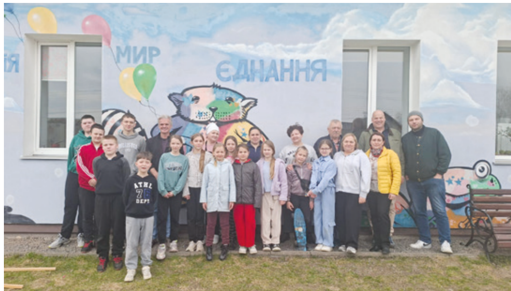
Hilfsgüterübergabe in Neszabudka.

Erzhäuser (rs). Liebe Unterstützerinnen und Unterstützer, liebe Spenderinnen und Spender, vom 25. bis 28. März führten wir einen Hilfstransport nach Ivanychi in der Ukraine durch. Dank eurer großzügigen und sehr zahlreichen Spenden aus Bevölkerung und der Erzhäuser Vereinswelt konnten wir große Mengen an Hilfsgütern zu den Menschen vor Ort bringen, an die Stellen wo sie so dringend benötigt werden. Anlaufstationen unseres Hilfstransportes waren die Kita Kalinonka, die Schule Novovolinski Naukovj Licy, die Schule 1, das