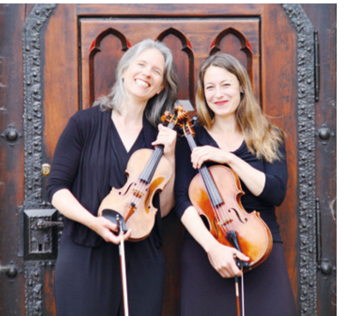
Streichzarte Klänge auf 8 Saiten mit dem „Duo Carphelia“ mit Werken von Sibelius, Mozart, Brustad, Martinu, Pleyel und Halvorsen.

Duo Carphelia lädt zum Kammerkonzert ein