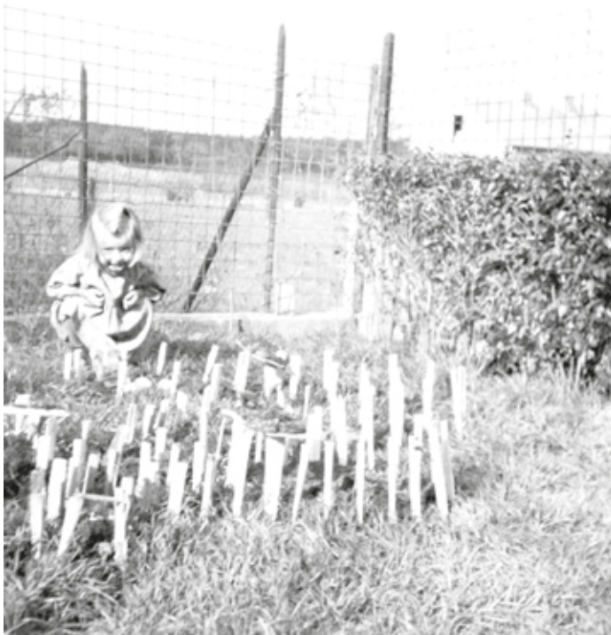
Ostergärtchen aus der Nachkriegszeit.