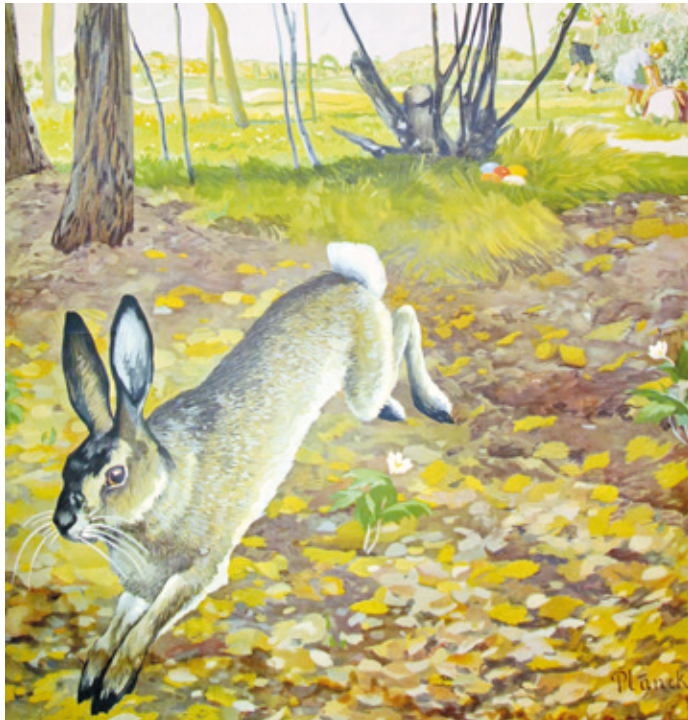
Ausschnitt aus alter Vorkriegs-Schulwandkarte aus der Sammlung des Ortskundlichen Arbeitskreises.

Erzhäuser (hs). Osterhasen jeder Größe und Verpackung füllen derzeit die Regale der Geschäfte. Ostereier in bunter Vielfalt ebenso. Ostern als christliches Fest der Auferstehung, Osterhase und Ostereier bringt man eigentlich nicht in Verbindung miteinander. Die Älteren verbinden damit nostalgische Erinnerungen an die Kindheit. Zu Ostern gab es früher von den Eltern und Paten bunt gefärbte Eier, selten Süßigkeiten. Die Eier brachte natürlich der Osterhase. Um ihn anzulocken, bauten Kinder in Erzhäuser Ostergärtchen. Manchmal auch heute noch. Das Gärtchen hatte einen Eingang und war mit Moos oder Gras zur Bequemlichkeit des Hasen weich ausgelegt. Natürlich wussten die älteren Kinder, woher und wie die gefärbten Eier in das Gärtchen kamen.