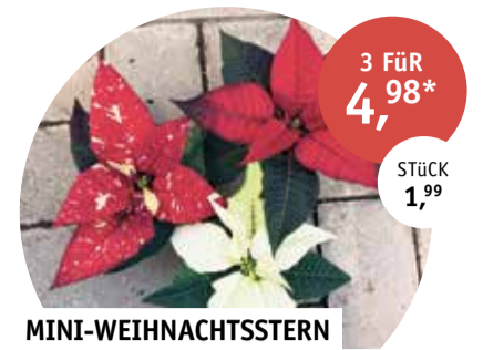
MINI-WEIHNACHTSSTERN aus eigener Anzucht | in vielen verschiedenen Farben | Topf-Ø 6 cm