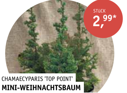
CHAMAECYPARIS 'TOP POINT' MINI-WEIHNACHTSBAUM Topf-Ø 9 cm