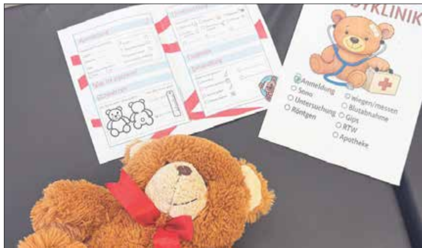
In der Teddyklinik im GZO wurden kleine Kuschelpatienten liebevoll versorgt.

Spielerisch mögliche Ängste vor Arztbesuchen abbauen