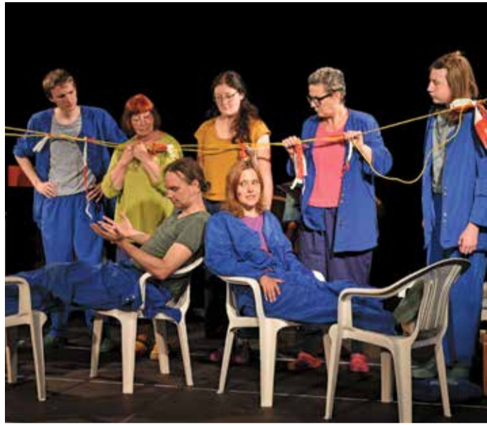
Chaos als Kunst: Die Schauspieler beim Proben.