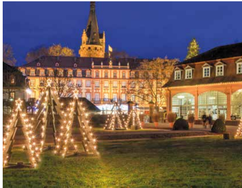
Weihnachtlicher Lichterglanz beim Erbacher Schloss.

Doch der Odenwald lebt auch von seinen kleineren, liebevoll gestalteten Märkten: vom Gütersbacher Abendweihnachtsmarkt an der Quellkirche über die Reichelsheimer Lichterweihnacht bis hin zum Weihnachtsmarkt am Brunnen in Beerfelden. Hier zeigt sich die unverfälschte, dörfliche Adventsstimmung, die so viele schätzen – warmherzig, authentisch und stets mit viel Engagement der Vereine gestaltet. Echte Originale finden