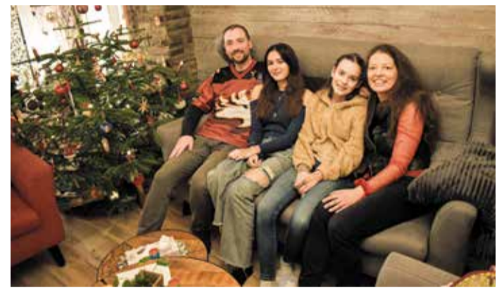
Eine Gastfamilie an Weihnachten.