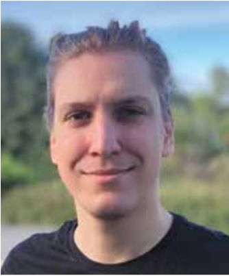
von Aleksandar Kerošević, Redaktionsleiter